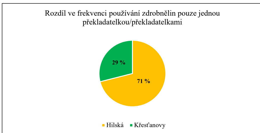
Graf 1: Rozdíl ve frekvenci používání zdobnělin pouze jednou překladačkou/překladačkami

V druhé části analýzy II jsem postupovala tak, že jsem ze zbylého počtu 225 příkladů z prvotního počtu 376 příkladů, ze kterého jsem odečetla příklady, kde zdobnělinu použily jak Hilská, tak Křesťanovy, vytvořila graf 1 níže, ve kterém jsou procentuálně znázorněny hlavní výsledky. Ty jsou takové, že z počtu 225 příkladů bylo 160 takových, kde zdobnělinu použila pouze Hilská, a 65 takových, kde zdobnělinu použily pouze Křesťanovy.