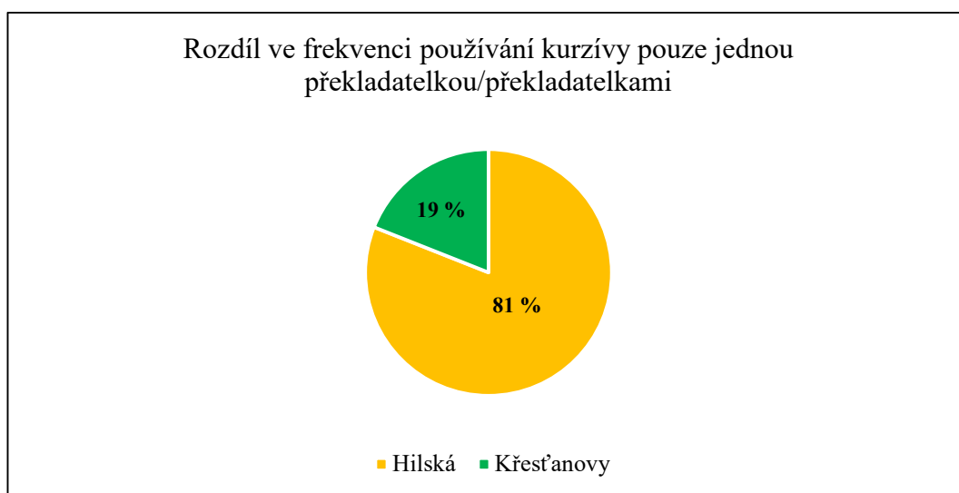
Graf 3: Rozdíl ve frekvenci používání kurzívy pouze jednou překladačkou/překladačkami

V druhé části analýzy VI jsem postupovala tak, že jsem ze zbylého počtu 27 příkladů z prvotního počtu 30 příkladů, ze kterého jsem odečetla příklady, kde kurzívu použily jak Hilská, tak Křesťanovy, vytvořila graf 3 níže, ve kterém jsou procentuálně znázorněny hlavní výsledky. Ty jsou takové, že z celkového počtu 27 příkladů bylo 22 takových, kde kurzívu použila pouze Hilská, a 5 takových, kde kurzívu použily pouze Křesťanovy.