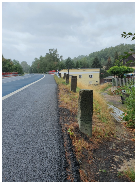
Obr. č. 18 a 19 Kamenné patníky u silnice.