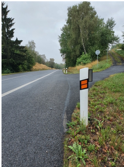
Obr. č. 20 Směrové sloupky.

stálé a při střetu s vozidlem nezpůsobily velké škody. Rovněž aby byla jejich výměna snadná. 82