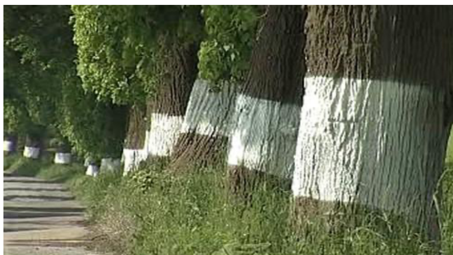
Obr. č. 1 Bílé nátěry na stromech.

výsadba stromů podél silnic motivuje řidiče ke snížení rychlosti, zatímco pravidelná výsadba v řadách přispívá ke zvyšování rychlosti. Nejrizikovějšími jsou koruny stromů, které jsou přes silnici spojené, vzniká totiž tzv. tunelový efekt, který funguje jako vodící prvek a nabádá řidiče k rychlejší jízdě. V případě pravotočivých začátků stromy vysazené vně oblouku vzbuzují u řidičů vyšší rychlost, kdežto uvnitř oblouku vedou ke snižování rychlosti. Kmeny stromů bývají na některých úsecích natírány bílou barvou, cílem by mělo být zviditelnění stromových alejí a řidiči by měli při projíždění stromořadí snížit svou rychlost a jet opatrně, ovšem žádná ze studií doposud toto opatření jako účinné nepotvrdila. 59