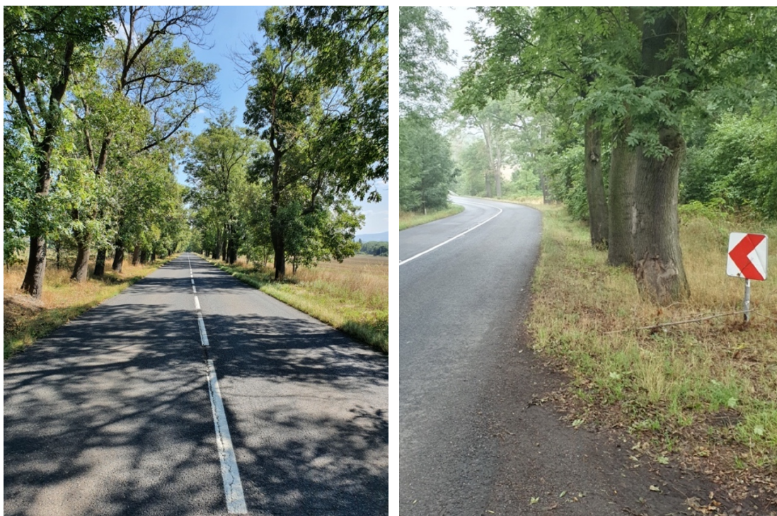
Obr. č. 4 Stromořadí v blízkosti vozovky vrhající střídavé stíny.