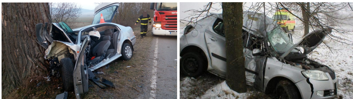
Obr. č. 2 Čelní náraz vozidla do kmene stromu v blízkosti vozovky.