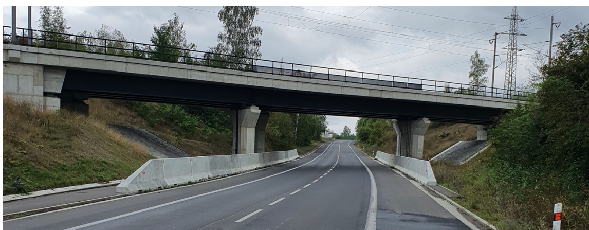
Obr. č. 13 Ukázka dostatečně chráněných mostních pilířů.