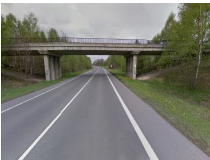
Obr. č. 12 Nechráněné mostní pilíře v blízkosti vozovky. Zdroj: Vymoly.cz: Nebezpečný úsek CZ7176 [online]. [cit. 7.9. 2022] Dostupné z: https://www.vymoly.cz/detail/silnice-i-20-u-touzimi-pilire-nadjezdu/

Velice nebezpečnou překážkou pro řidiče mohou být různé pilíře a podpěry u mostů a viaduktů. Nebezpečnou se stává zejména při zhoršených viditelnostních podmínkách, například v nočních hodinách, kdy jsou mosty či pilíře nedostatečně osvětleny a ještě, pokud zde chybí bezpečnostní zachytý systém. Riziko představují mostní podpěry především v blízkosti směrových oblouků, kdy za nepříznivých povětrnostních podmínek může na vozovkách vznikat námraza, která zvyšuje pravděpodobnost nárazu. 69