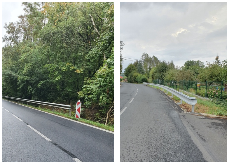
Obr. č. 7 a 8 Nebezpečné zakončení svodidel

k čelnímu nárazu vozidla do náběhové části svodidla, které je ledabyle ostře zakončeno. Chová se svodidlo úplně stejně jako nůž a snadno pronikne kabinou skrze deformační zónu vozidla, a následně způsobí mnohem závažnější následky, než kdyby bylo vhodně ukončeno určitým náběhem, který by eliminoval vznik takovéto nehody. Proto je velmi důležité volit ta správná svodidla ve vztahu k podmínkám na dané pozemní komunikaci.