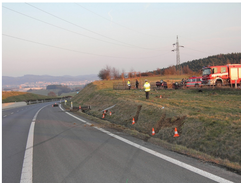
Obr. č. 6 Dopravní nehoda automobilu při nárazu do svahu v blízkosti komunikace. Zdroj: Pozary.cz: Řidič vozidla s přívěsným vozíkem vyletel u obce Chlaponice na Písecku mimo silnici, spolujezdec zemřel [online]. [cit.7.9. 2022] Dostupné z: https://www.pozary.cz/clanek/132277-ridic-vozidla-s-privesnym-vozikem-vyletel-u-obce-chlaponice-na-pisecku-mimo-silnici-spolujezdec-zemrel/

Svah řadíme do kategorie přírodních pevných překážek. Jeho vznik úzce souvisí s budováním pozemní komunikace v zářezu. Při výstavbě svahu se hodnoty sklonu pohybují v rozmezí od 1:2 (do výšky dvou metrů) do 1:1,75 (do výšky šesti metrů). V případě svahu vyššího než 6 metrů je zapotřebí odborné geologické stanovisko. Strukturu svahu tvoří vrstva šterku a hlíny, ve vrchní části se typicky nachází vegetace, eventuálně drobné keře. Oproti případům, kdy vozidlo narazí do sloupu, zdi či stromu, deformace způsobená střetem vozidla se svahem nemívá tak devastující účinky. Zapříčiněno je to tím, že místem střetu vozidla se svahem zpravidla bývá spodní část vozidla, případně vozidlo pokračuje dále v pohybu po svahu. Pakliže vozidlo narazí do svahu čelně, část energie absorbuje svah a náraz se rozloží do deformačních zón. Zároveň dochází k degradaci svahu, kdy po střetu zůstávají v půdě patrné stopy po vozidle.