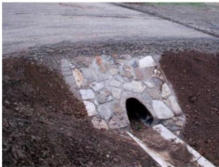
Obr. č. 11 Propustek se šikmým čelem

Na druhou stranu existují případy, při kterých se vozidlo po kontaktu se sešikmeným čelem propustku začne otáčet ve vzduchu. Pádem na zem může dojít k sekundární rotaci, kdy se vozidlo opakovaně převrátí na střechnu. Při takto vzniklé situaci jsou fatálním následkům vystavováni zejména pasažéři, kteří neuzijí bezpečnostních pásů, případně daný automobil nemá pevnou konstrukci střechy a bezpečnostní sloupky jsou nedostatečně odolné. 68