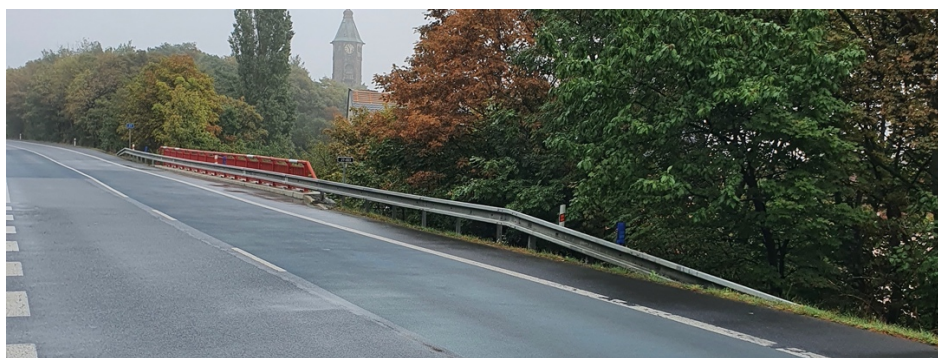
Obr. č. 9 Ocelová svodidla se zábradelní konstrukcí

Mezi nejpoužívanější svodidla patří svodidla ocelová (např. před opěrami mostů), dále svodidla betonová, ta se nejčastěji používají ve středním dělicím pásu jako ochrana vozidel v protisměrném pásu a pak svodidla lanová či dřevěná. V okolí vozovek také můžeme nalézt zábradelní či mostní svodidla, ta se používají k oddělení jízdního pruhu od chodníku nebo na vnější strany říms mostů. 65