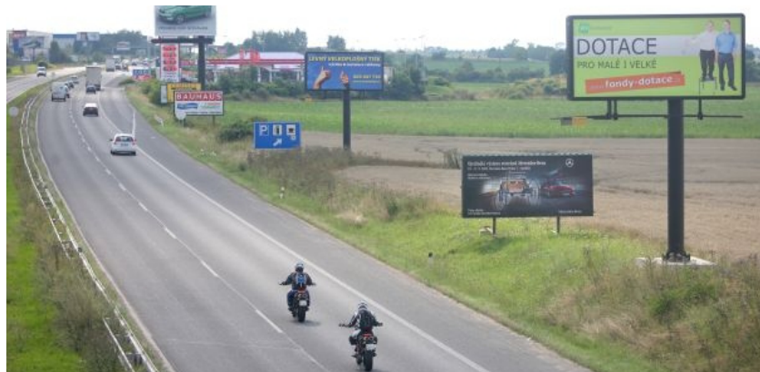
Obr. 15 Nehráněné nosné konstrukce reklam svodidlem Zdroj: Tyden.cz: Nebezpečné billboardy u silnic: odstranit jich půjde minimum [online]. [cit. 7.9. 2022]. Dostupné z: https://www.tyden.cz/rubriky/domaci/doprava/nebezpecne-billboardy-u-silnic-odstranit-jich-pujde-minimum_201722.html?showTab=nejctenejsi-24

Příčinou řady dopravních nehod bývá nesoustředění účastníků provozu v kritickém momentu. Zrovna tak reklamní plochy lemující krajnice vozovek odvádí pozornost řidičů od dění na pozemních komunikacích a ve chvílce jejich nepozornosti se pro ně stávají pevnými překážkami. Z tohoto důvodu by mělo být umístění reklam u silnic důkladně zváženo, případně přesunuto na taková místa, kde nemohou odvádět pozornost řidičů a kde nevytváří potenciální pevné překážky pro vozidla, jež v havarijních situacích opouštějí vozovku. Přednost by mělo mít především bezpečí všech účastníků dopravy na silnicích, před potenciálními výdělky inzerujících firem. Existuje spousta jiných míst, kam lze reklamy umístit a dostane se jim mnohem větší pozornosti, například parkoviště, tržiště, nádraží, pěší zóny, místa v nákupních střediscích, na stadionech apod.