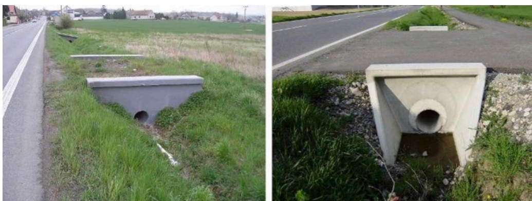
Obr. č. 10 Současná konstrukční řešení hospodářských přejezdů s rovným čelem

Šířka čelních stěn propustků není jednotně dána, tudíž u stěn užších než 30 cm hrozí, že při střetu s vozidlem se některé z jejich částí odlomí. Načež se tyto úlomky mohou dále rozptýlit do okolí nebo se nakumulovat pod vozidlo. Jestliže se vozidlo při nárazu s těmito úlomky pohybovalo větší rychlostí, může se stát, že jej vymrští nad úroveň propustku a vozidlo bude nadále pokračovat v neřízeném pohybu dále ve směru jízdy, v horším případě se převrátí na střechnu. 67