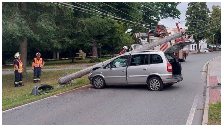
Obr. č. 17 Náráz automobilu do sloupu elektrického vedení. Zdroj: Orlicky.net : Náráz auta do sloupu elektrického vedení uzavřel silnici. Sloup totiž padnul přímo na auto [online]. [cit. 7.9. 2022]. Dostupné z: https://www.orlicky.net/index.php?id_zpravy=14067091871661316483

Podobně jako u sloupů tak i u lamp pouličního osvětlení vyvstává problém s nedeformovatelným materiálem, ze kterého jsou zhotoveny. Ten v případě srážky s vozidlem způsobuje silnou deformaci vozidla a s tím související vážná poranění osob. Velmi rychlá decelerace může následně vést k nenávratnému poškození (až utržení) vnitřních orgánů. Na trhu lze samozřejmě narazit i na lampy deformovatelné, ale i zde rozhodujícím způsobem promlouvají do případné koupě vyšší pořizovací náklady, a proto se s nimi lze na českých silnicích setkat spíše sporadicky. 80