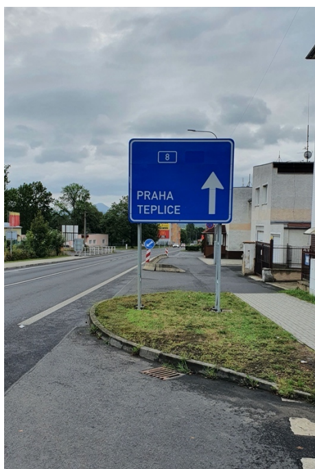
Obr. č. 14 Příhradová nosná konstrukce dopravního značení – neagresivní při nárazu.

Svislé dopravní značky se dle svého významu nejčastěji umísťují k pravému okraji pozemních komunikací, pokud je však nutné značení zvýraznit, umísťují se také k levému okraji. Samotné značení či jeho podpěrné konstrukce nesmí svým umístěním zasahovat do volné šířky komunikace určené pro dopravu. Rovněž nesmějí omezit rozhledové poměry na křižovatce, na vnitřní straně směrového oblouku, na přechodu pro chodce nebo na místech určených k přecházení a v jejich blízkosti. Do prostoru pro chodce mohou zasahovat pouze v případě, že je zachována volná šířka 1,5 metru. Nejmenší možný rozměr mezi nosnou konstrukcí značky a vnějším okrajem zpevněné části krajnice, který je nutné dodržet je 0,5 m, přičemž v obci lze tento rozměr zkrátit na 0,3 m. Jsou-li na pozemní komunikaci umístěna svodidla, je nutné podpěrné konstrukce dopravního značení stavět až za jejich deformační zónu. 73