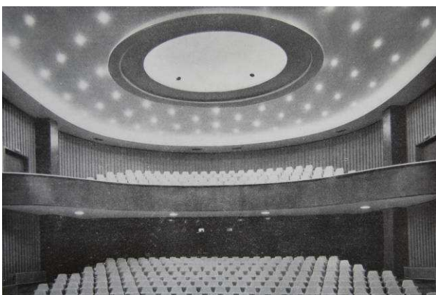
Divadelní sál, hlediště