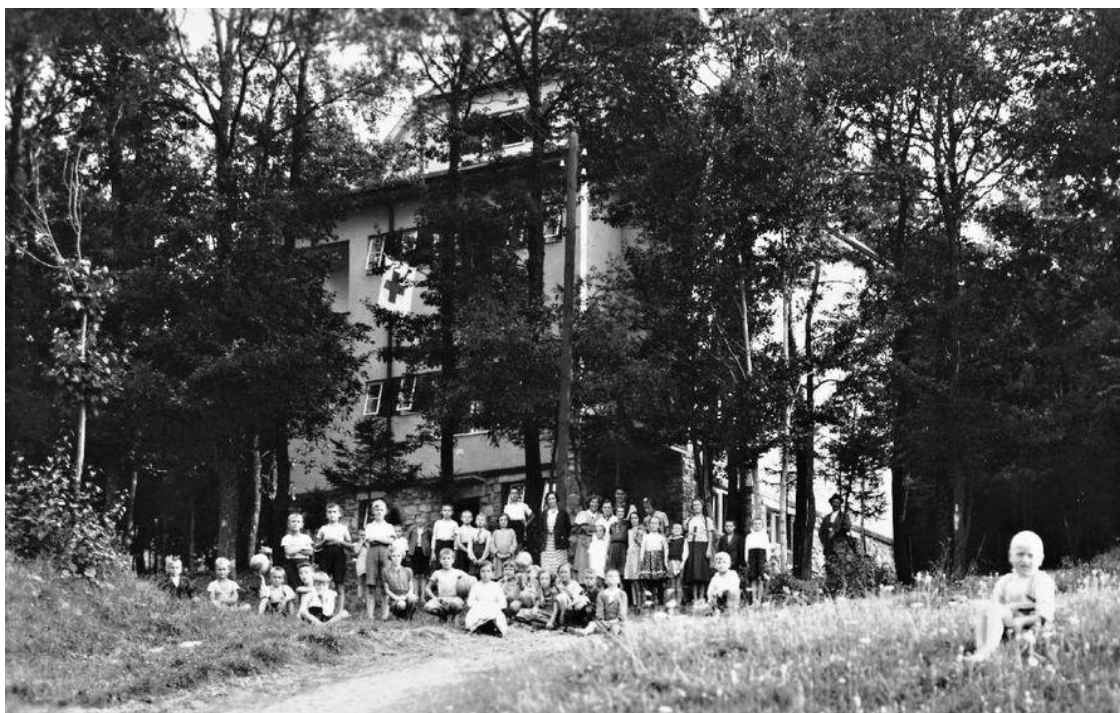
Obrázek 9: Dětská ozdravovna v Radějově