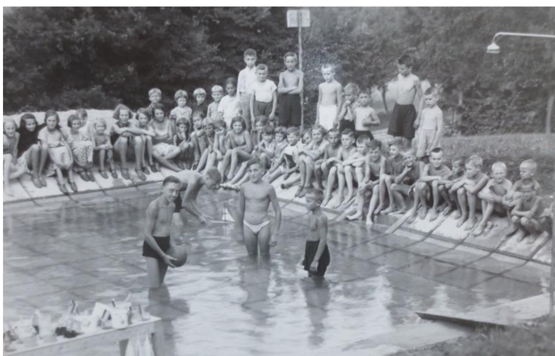
Obrázek 10: Koupaliště u ozdravovny v Radějově