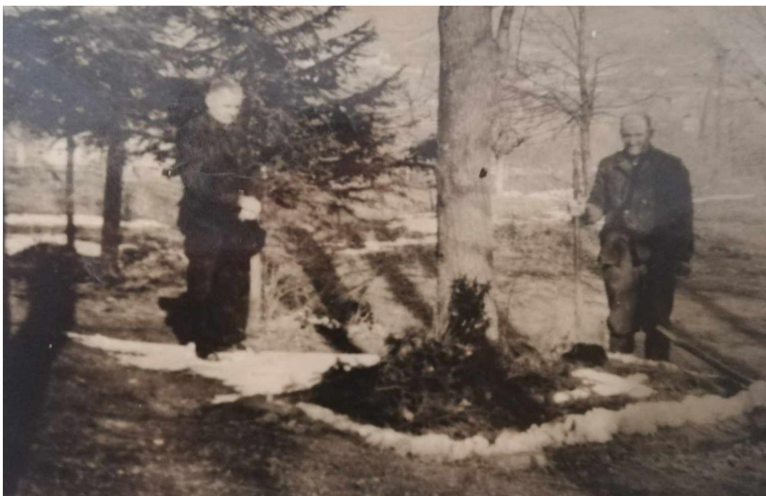
Obrázek 3: Hrob B. Hrejsové u Ozdravovny v Radějově