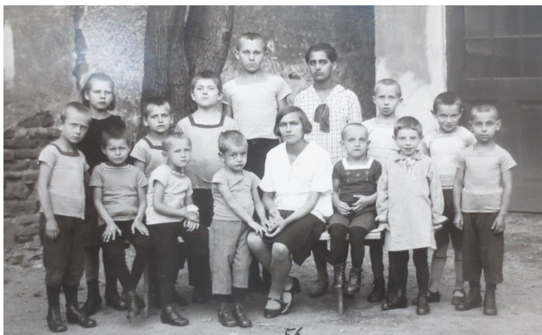
Obrázek 6: Děti z dětského domova ve Strážnici 1929