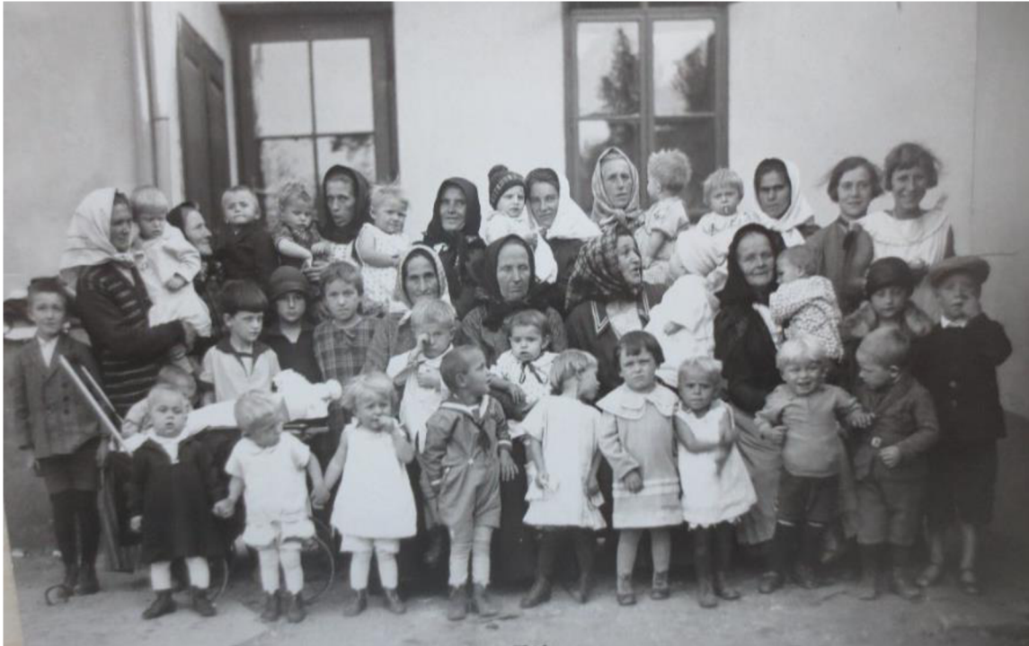
Obrázek 7: Rodinná kolonie ve Strážnici 1929