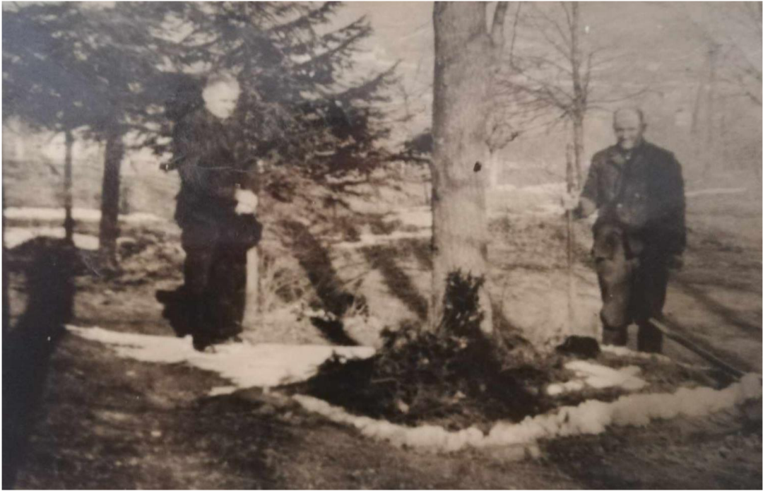
Obrázek 3: Hrob B. Hrejsové u Ozdravovny v Radějově