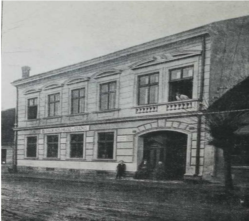
Obrázek 11: Děts. domov ve Strážnici v Židovské ulici, 1924