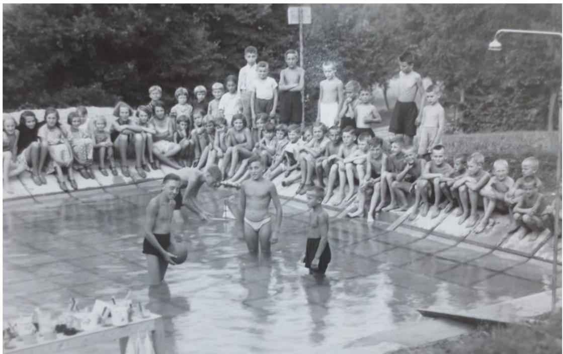
Obrázek 10: Koupaliště u ozdravovny v Radějově