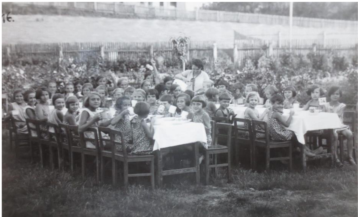
Obrázek 8: Prázdninová kolonie v Radějově