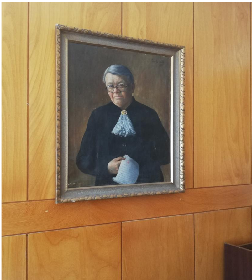
Obrázek 13: Obraz B. Hrejsové v Dětském domově ve Strážnici