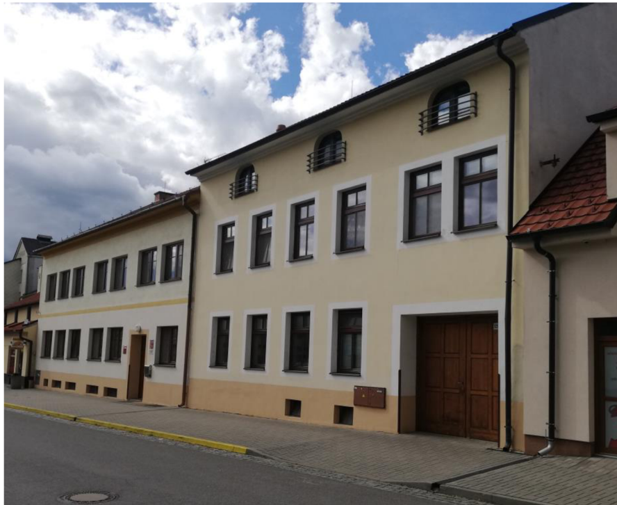
Obrázek 12: Děts.domov ve Strážnici, ulice B.Hrejsové, 2024.