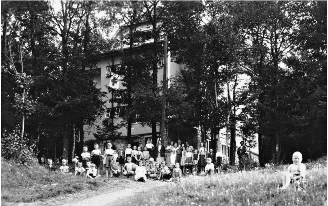
Obrázek 9: Dětská ozdravovna v Radějově