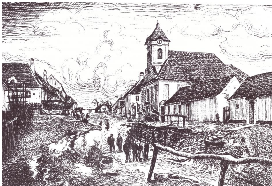
Příloha č. 1: Zástavba s kostelem sv. Anny v Žarošicích v 19. století