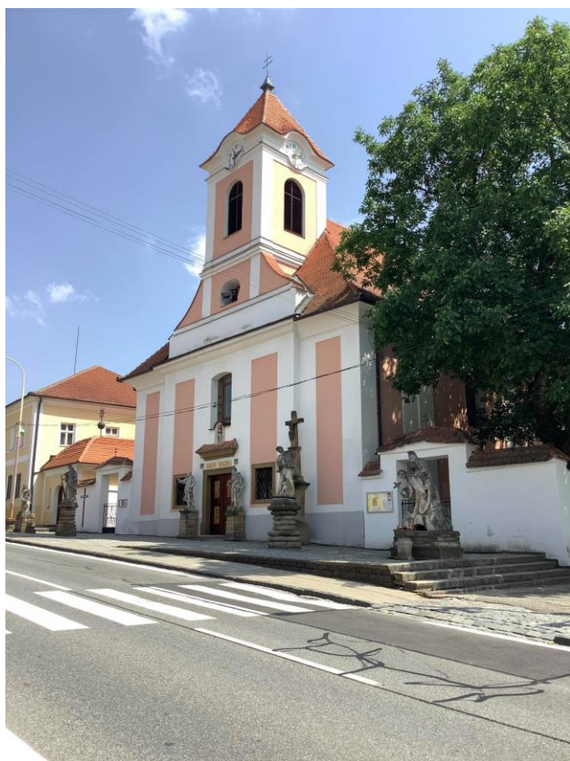
Příloha č. 2: kostel sv. Anny v Žarošicích v roce 2019