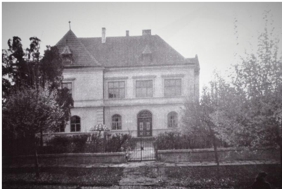
Zdroj: Zmizelé a mizející staré Žarošice v kresbách, malbách a fotografiích . Žarošice: Historicko-vlastivědný kroužek Žarošice, 2008, s. 83.