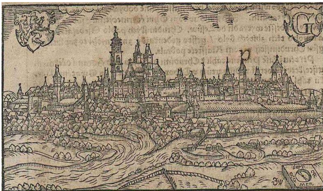
Obrázek 3 Willenbergova veduta Hradce Králové z roku 1602 202

Velice těžko badatelsky podchytilelná je problematika zadních domů. Tyto zadní domy stály na pozemcích za domy ve vnitřním městě a jsou také zachycené na vedutě Hradce Králové od Jana Willenberga z roku 1602. V Trhové knize žluté se setkáváme s jedinou zmínkou o tomto typu domů, a to když zedník Tomáš Vlach kupoval v roce 1592 dům v ulici mezi zadními domy Jonáše Zeydlera a Jana Turka za 700 kop g. míš. 203 Je ovšem možné, že je tímto míněna 4. čtvrť vnitřního města, kde stály ty nejlevnější domy v rámci prostoru uvnitř městských hradeb.