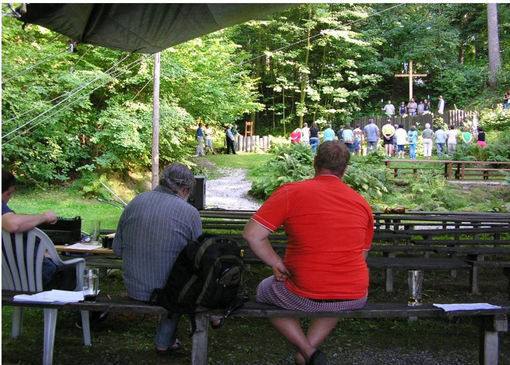
Obrázek 2. Zvuk i režijní dohled je důležitou součástí i ochotnického divadla