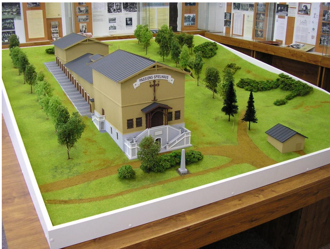
Obrázek 9. Model pašijového divadla v muzeu pašijí