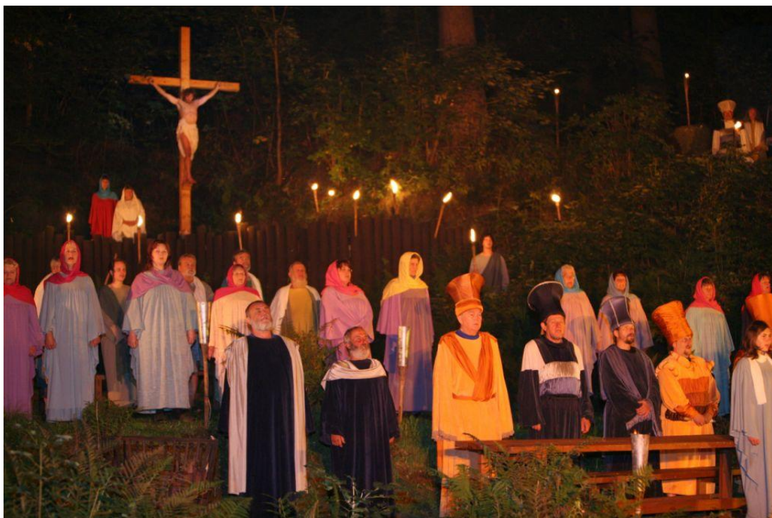
Obrázek 7. Ježíš Kristus na kříži