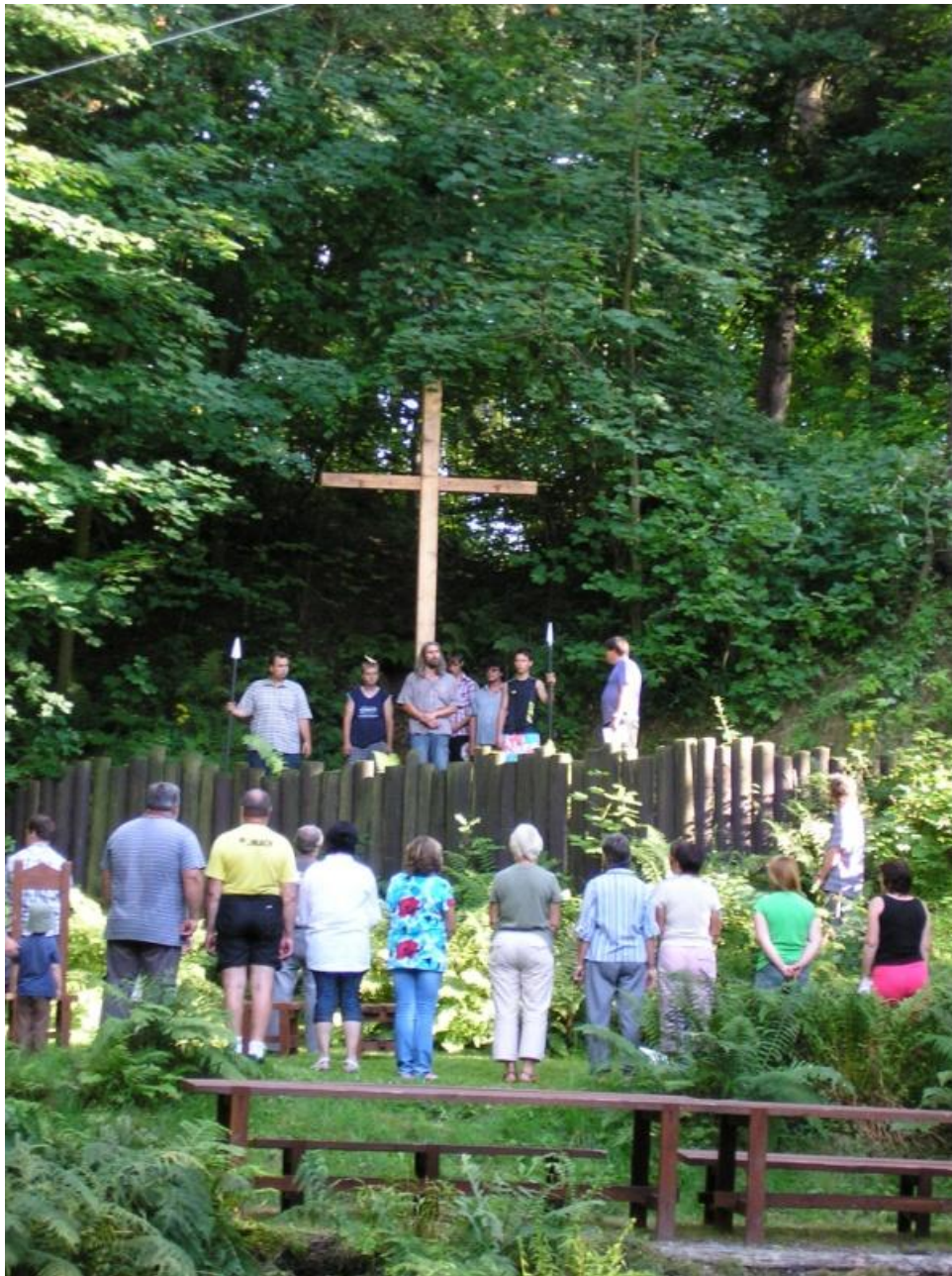
Obrázek 3. Ježíš pod křížem