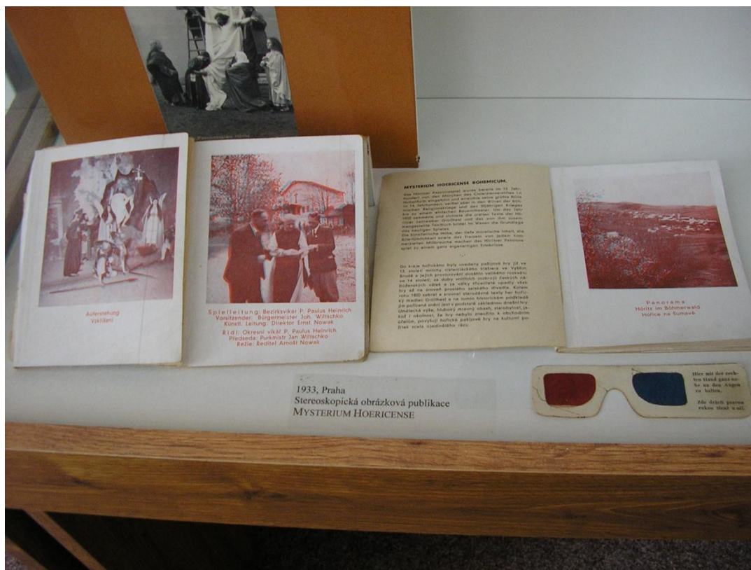
Obrázek 14. Dobové 3D obrazové publikace z roku 1933 zobrazující pašijové hry včetně brýlí