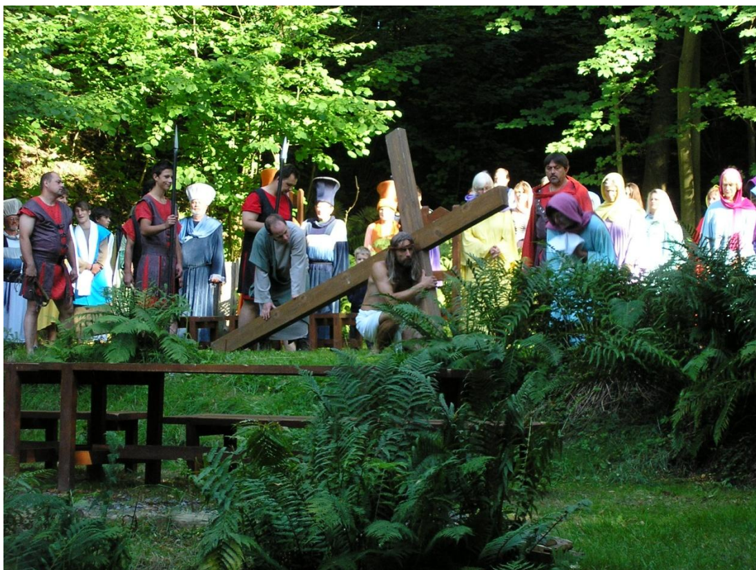
Obrázek 6. Ježíšova cesta s křížem na Golgotu