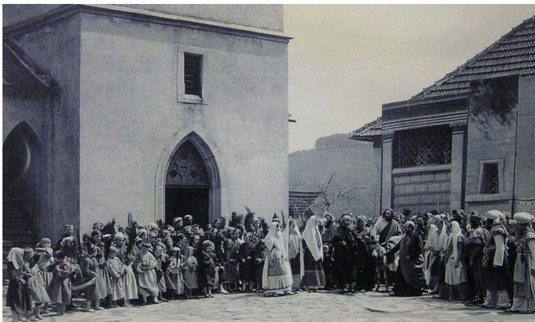
Obrázek 12. Dobová fotografie z hoříckého náměstí před kostelem, vjezd Ježíše do Jeruzaléma