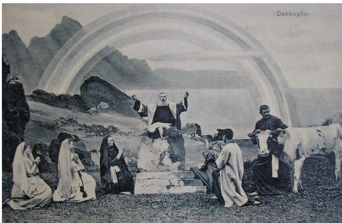
Obrázek 13. Dobová fotografie – představení starého zákona, obětování Noemovo