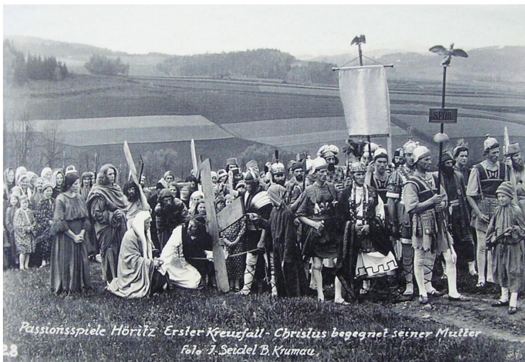
Obrázek 11. Dobová fotografie z procesí k divadlu, 1933, Hořice na Šumavě, snímek pořízený Josefem Seidelem při natáčení filmu. „Na křížové cestě ke kapli P. Marie Bolestné“