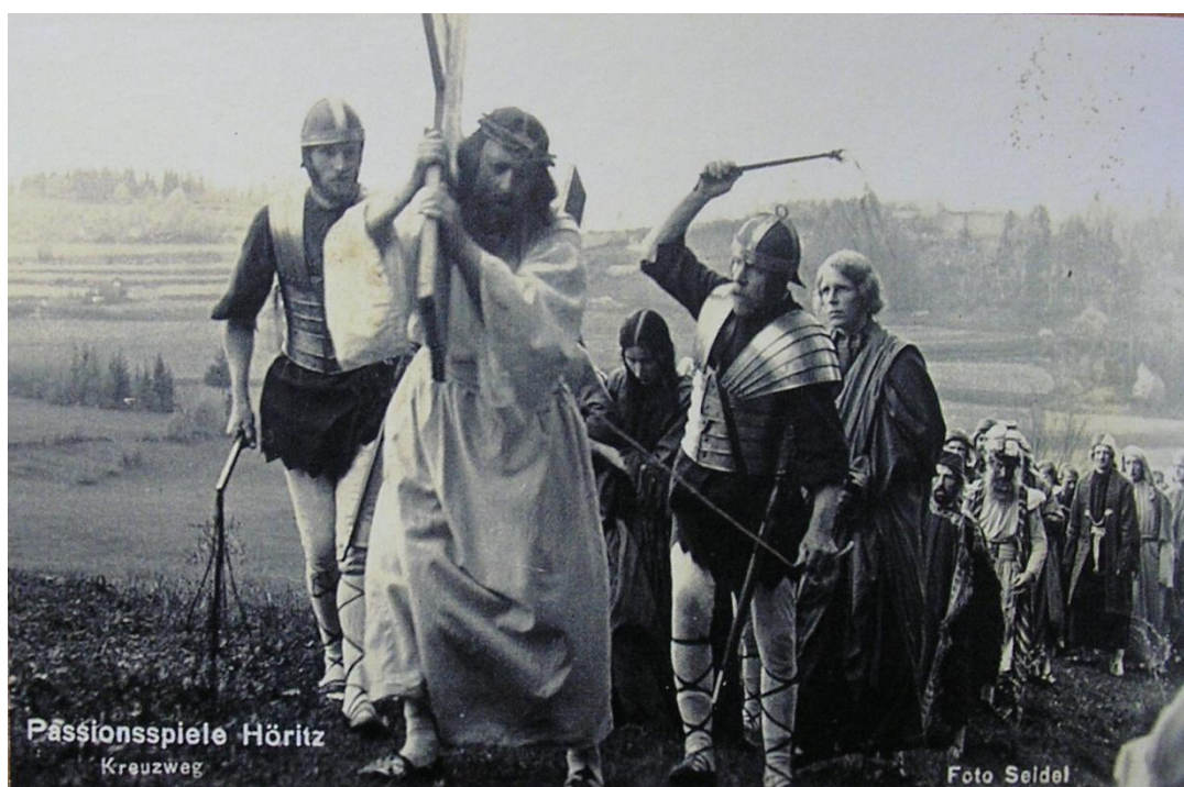
Obrázek 10. Dobová fotografie z procesí k divadlu, Kristus nese svůj kříž