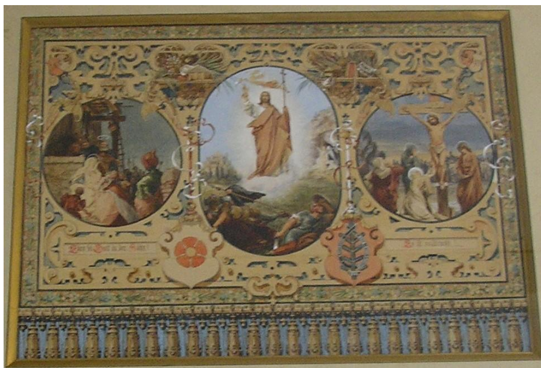
Obrázek 15. Dobová fotografie ručně malované opony, umístěné v pašijovém divadle