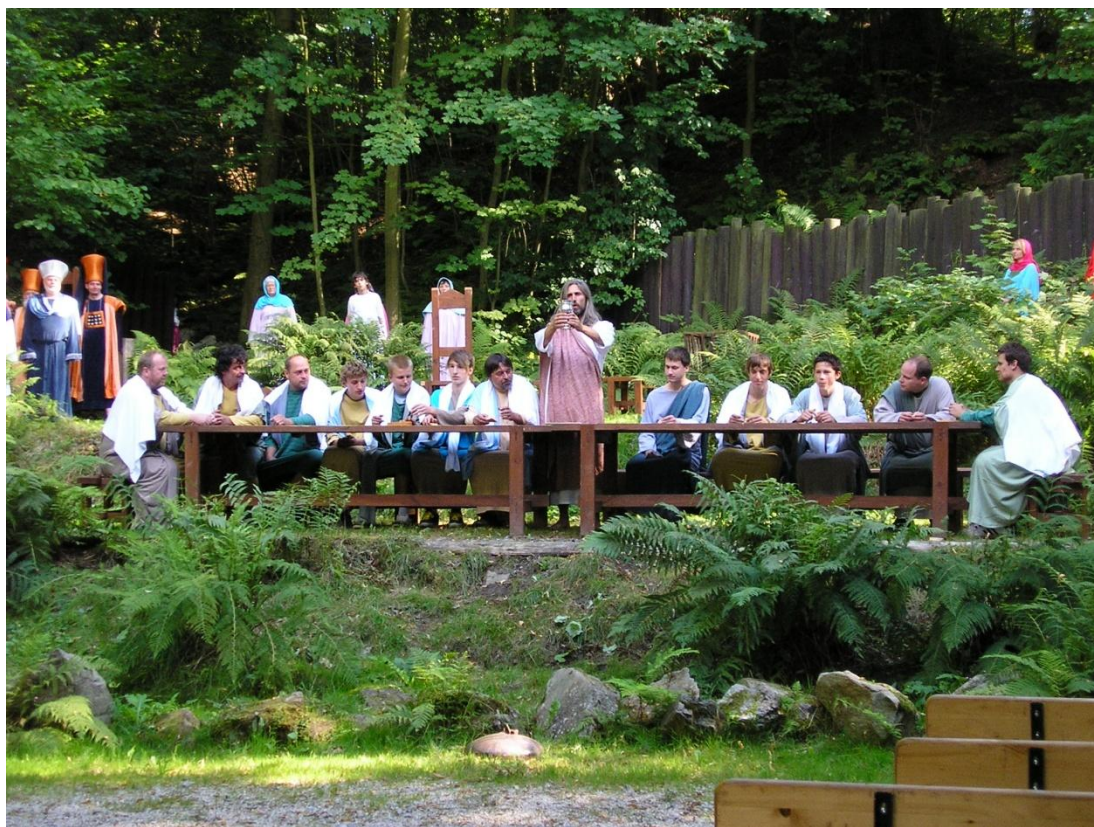
Obrázek 4. Poslední večeře Páně