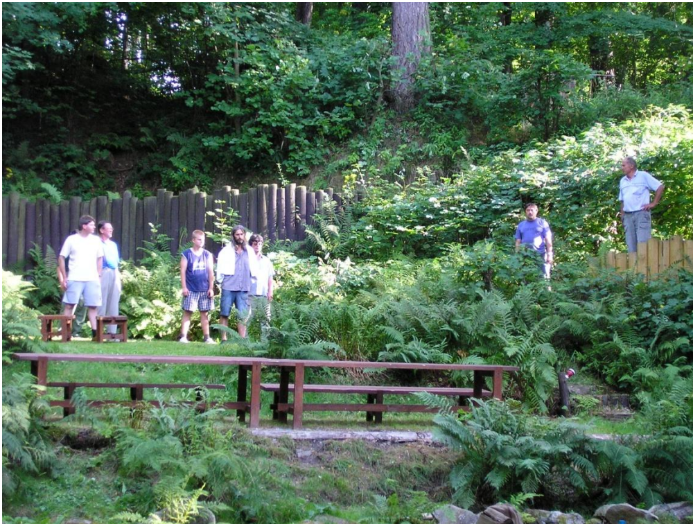
Obrázek 1. Ježíš Nazaretský před Pilátem Pontským