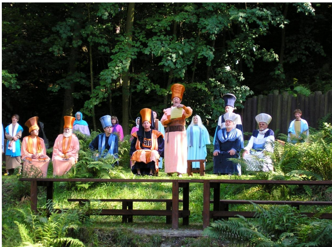
Obrázek 5. Velká rada