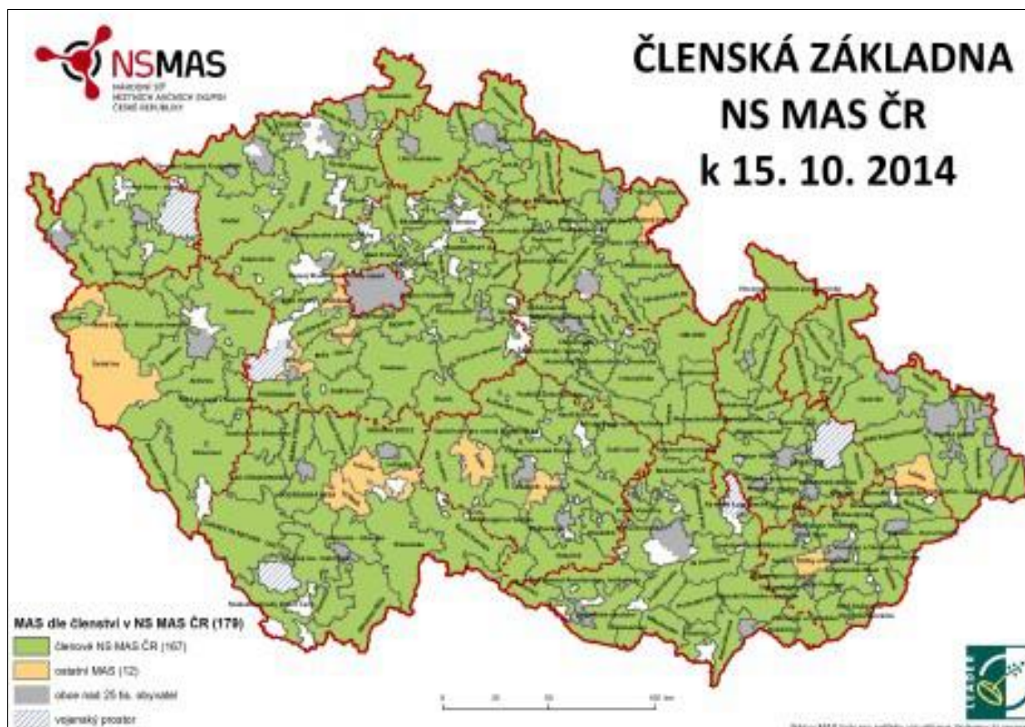
Obrázek 1 Členská základna NS MAS ČR