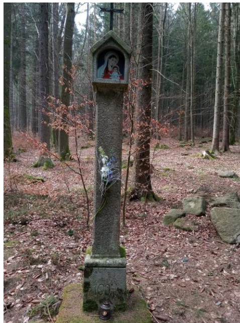
Kamenná sloupková boží muka - detail