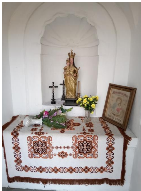
Návesní kaple - vnitřek