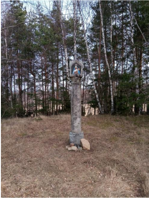
Kamenná sloupková boží muka