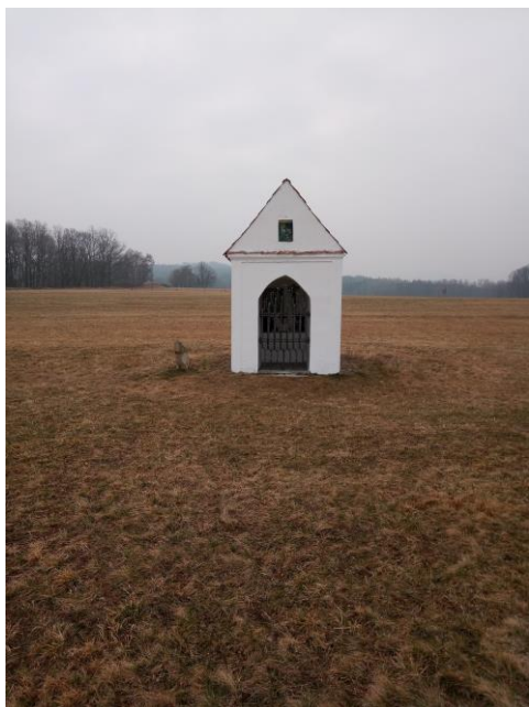
Výklenková zděná kaplička