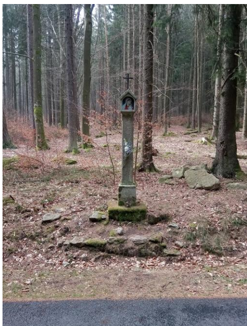
Kamenná sloupková boží muka