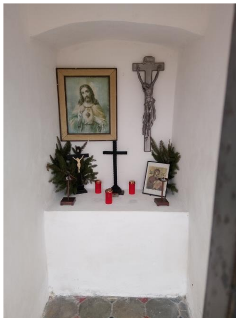
Výklenková zděná kaplička - vnitřek