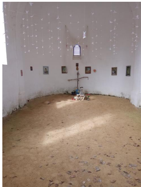
Návesní kaple - vnitřek