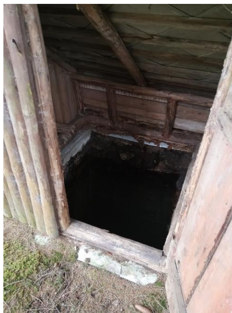
Dřevěná stavba kryjící pramen - vnitřek