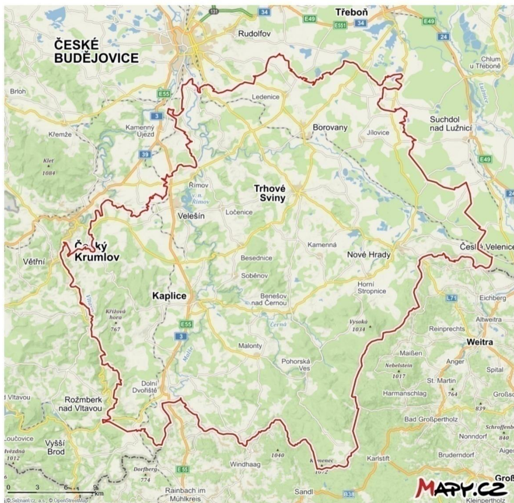
Obrázek 1 - oblast Novohradsko

Naše území jsme se snažili systematicky vytyčit a prvním vodítkem, z něhož jsme vycházeli, jsou hranice mezi Českou republikou a Rakouskem, které tvoří přirozený mezník. Vybrali jsme následující obce, které jsme použili jako vztyčné body k ohrazení území našeho bádání – Nakolice, Hlinov, Krčín, Vesce, Konratice, Staré Hutě. V takto vytyčené oblasti se poté nacházejí dvě větší města – Nové Hradý a Horní Stropnice.