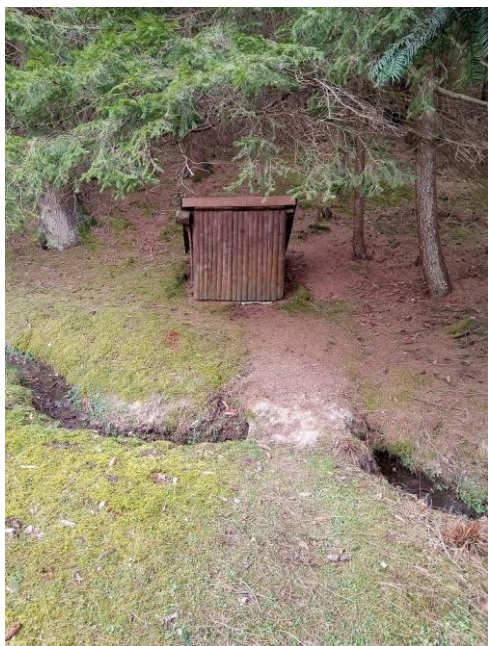
Dřevěná stavba kryjící pramen