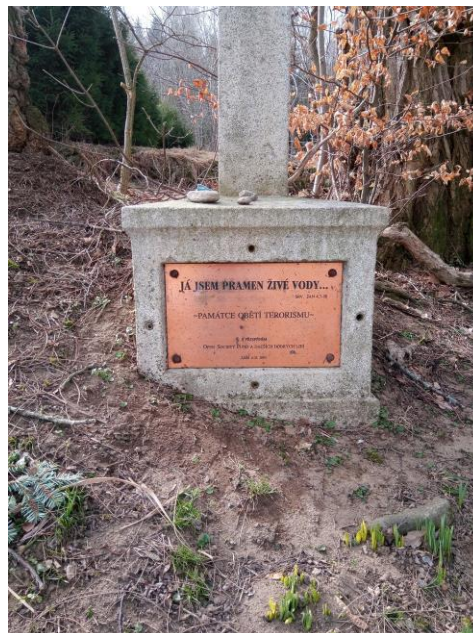
Kříž s korpusem (kalvárie) - pamětní deska