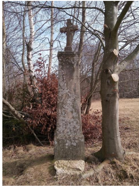
Tesaný kamenný kříž - detail