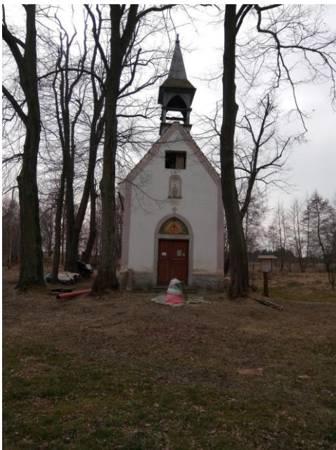
Návesní kaple Panny Marie Bolestné