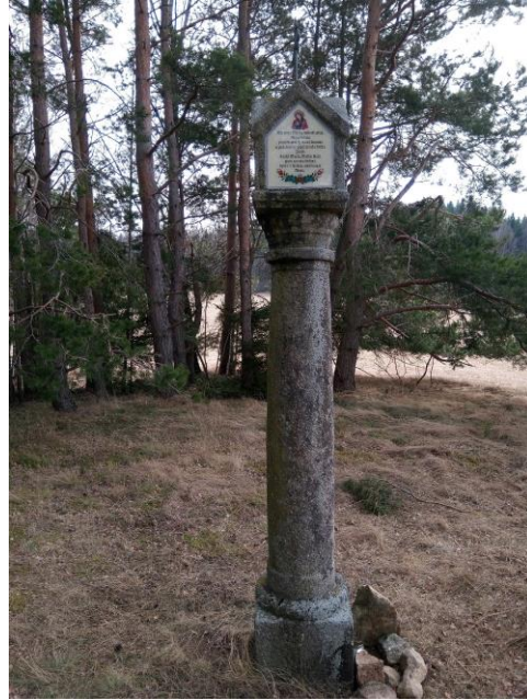
Kamenná sloupková boží muka - z boku