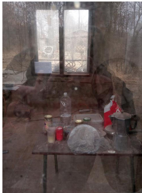
Návesní kaple Panny Marie Bolestné - vnitřek