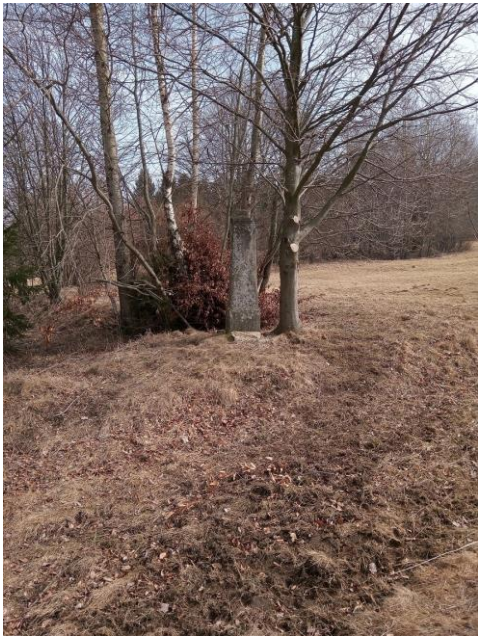
Tesaný kamenný kříž