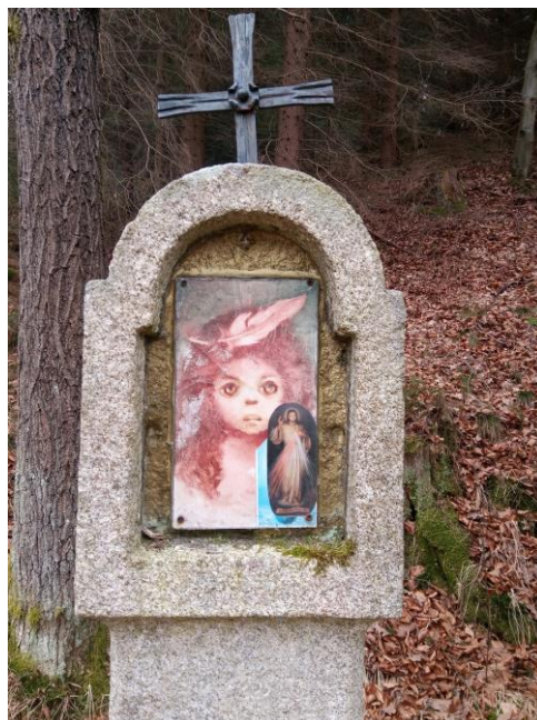
Kamenná pilířková boží muka - detail