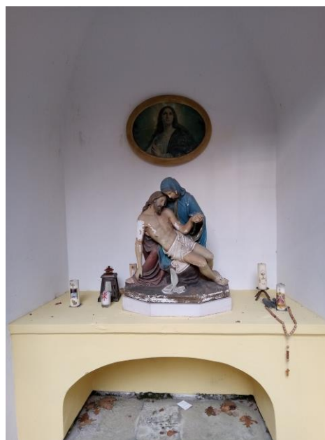
Poutní kaple Panny Marie – vnitřek