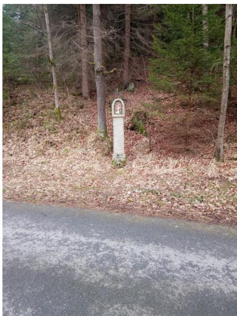
Kamenná pilířková boží muka