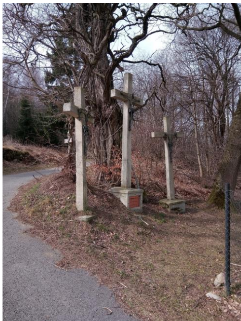
Kříž s korpusem (kalvárie)