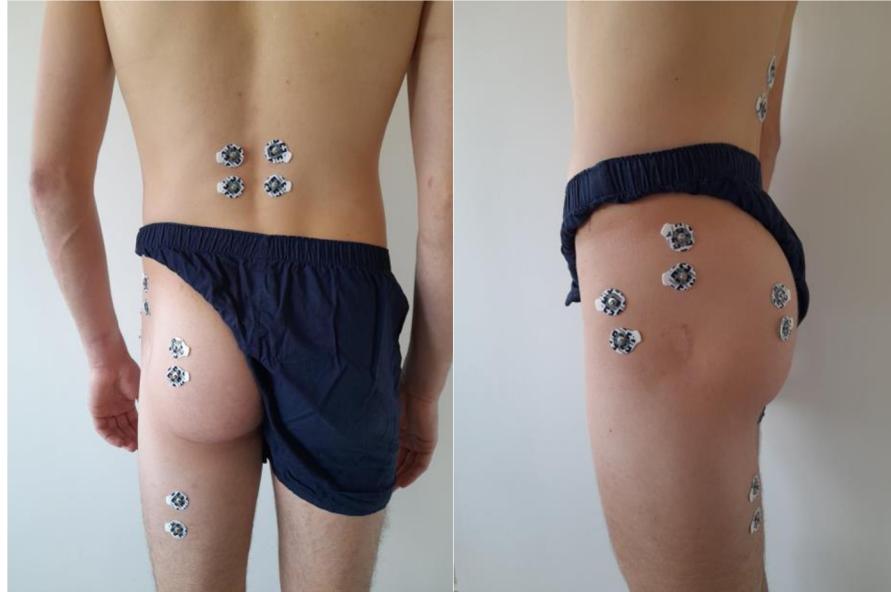
Obrázek 3 Umístění elektrod

a laterálním kondylem femuru; m. biceps femoris mezi tuber ischii a laterálním kondylem tibie; mm. erectores spinae na vzdálenost 2 prstů laterálně od processus spinosus L1; m. rectus abdominis 2 prsty laterálně od umbilicu (SENIAM, 1999). Referenční elektroda byla umístěna na SIPS a vzdálenost mezi elektrodami byla 1 cm.