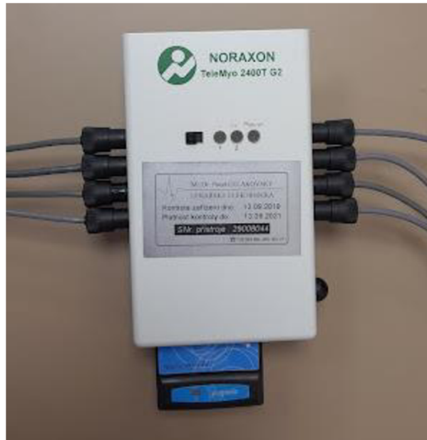
Obrázek 2: Přístroj EMG

Pro měření byl použit osmikanálový přístroj EMG NORAXON TeleMyo 2400T G2 (Obrázek 2) a elektromyogram byl zpracován v programu MyoResearch XP Master. Signál byl snímán jednorázovými lepícími elektrodami značky Kendall™, se senzorem Ag/AgCl a pevným hydrogelem s pěnovým nosičem o průměru 24 mm.