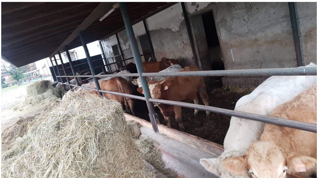
Obrázek 2: Oddělení s býky