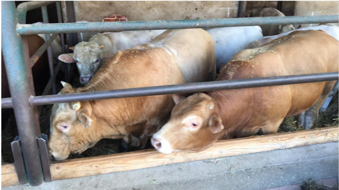
Obrázek 1: Skupina vykrmovaných kříženců