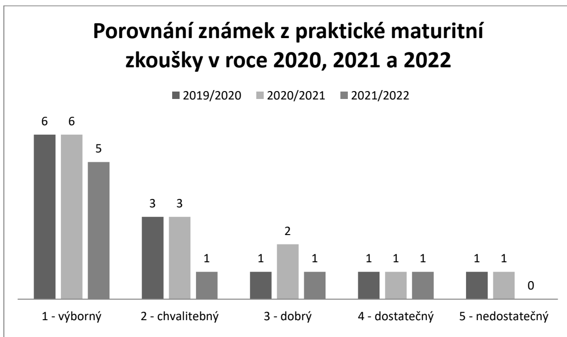
Graf 4: Porovnání jednotlivých klasifikačních stupňů u praktické maturitní zkoušky oboru veterinářství v roce 2020, 2021 a 2022.

Po srovnání výsledků v grafu 4 je patrné, že výsledky praktické maturitní zkoušky ve všech školních letech jsou velmi vyrovnané, na což nám poukazuje i tabulka 5, ve které jsou uvedené jednotlivé průměry známek maturujících ročníků v letech 2020, 2021 a 2022. V letech 2020 a 2021 byl počet maturujících studentů téměř totožný. V roce 2022 maturovalo o 5 žáků méně než v předchozích 2 letech.