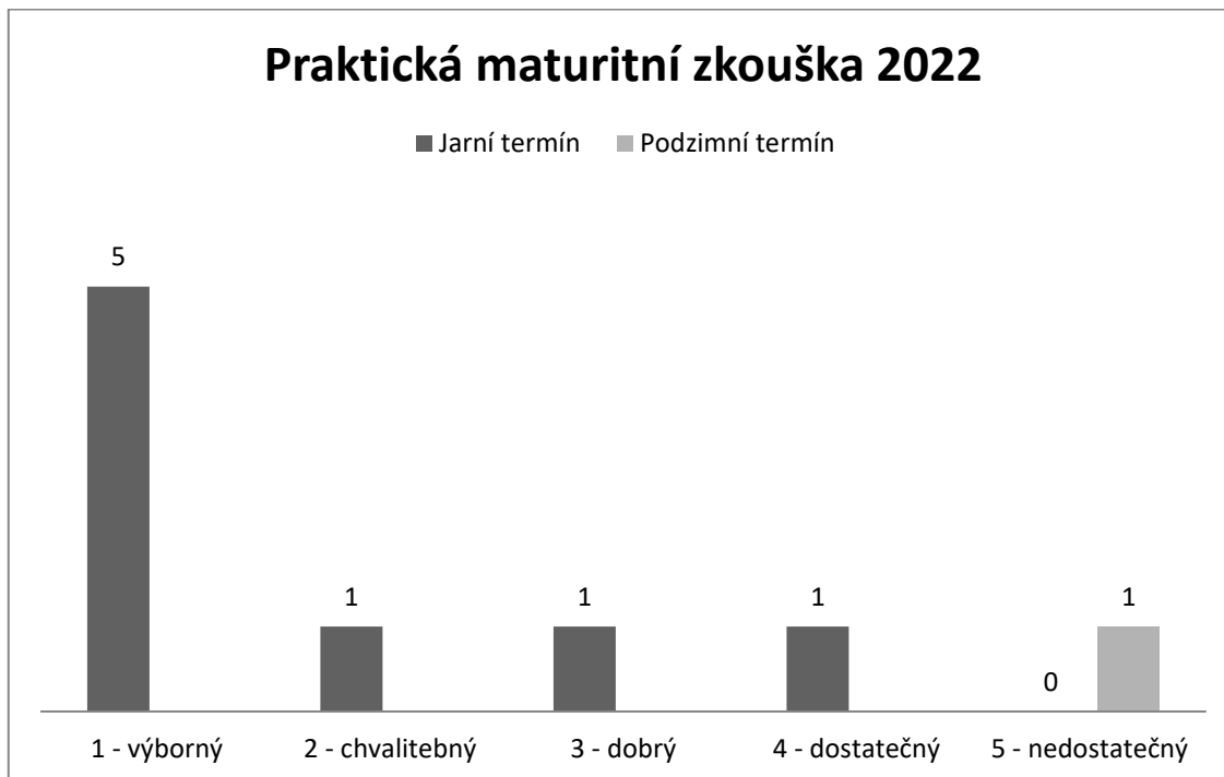
Graf 3: Jednotlivé klasifikační stupně z praktické maturitní zkoušky oboru vzdělání veterinářství v roce 2021/2022.

K maturitní zkoušce bylo v roce 2022 připuštěno 8 žáků a 1 žák připuštěn nebyl. Jak vyplývá z grafu 3, pět žáků u praktické maturitní zkoušky bylo ohodnoceno klasifikačním stupněm 1 - výborně. Klasifikačním stupněm 2 - chvalitebný byl ohodnocen jeden žák, stejně tak jako klasifikačním stupněm 3 – dobrý a 4 – dostatečný.