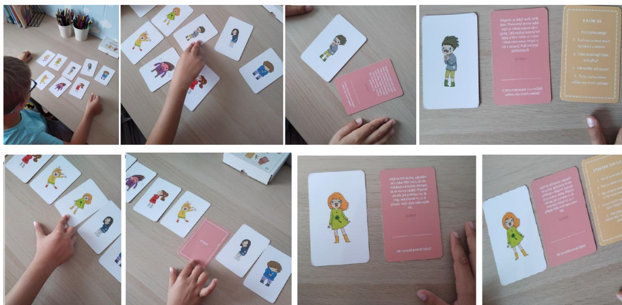
Obrázek 1 Aplikace techniky Karty pocitů