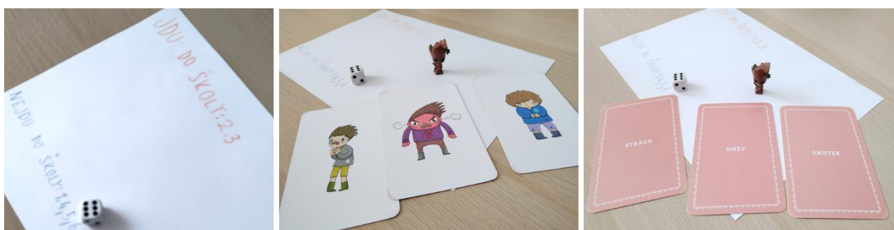
Obrázek 5 Aplikace techniky Kostka - hra s možnostmi 2