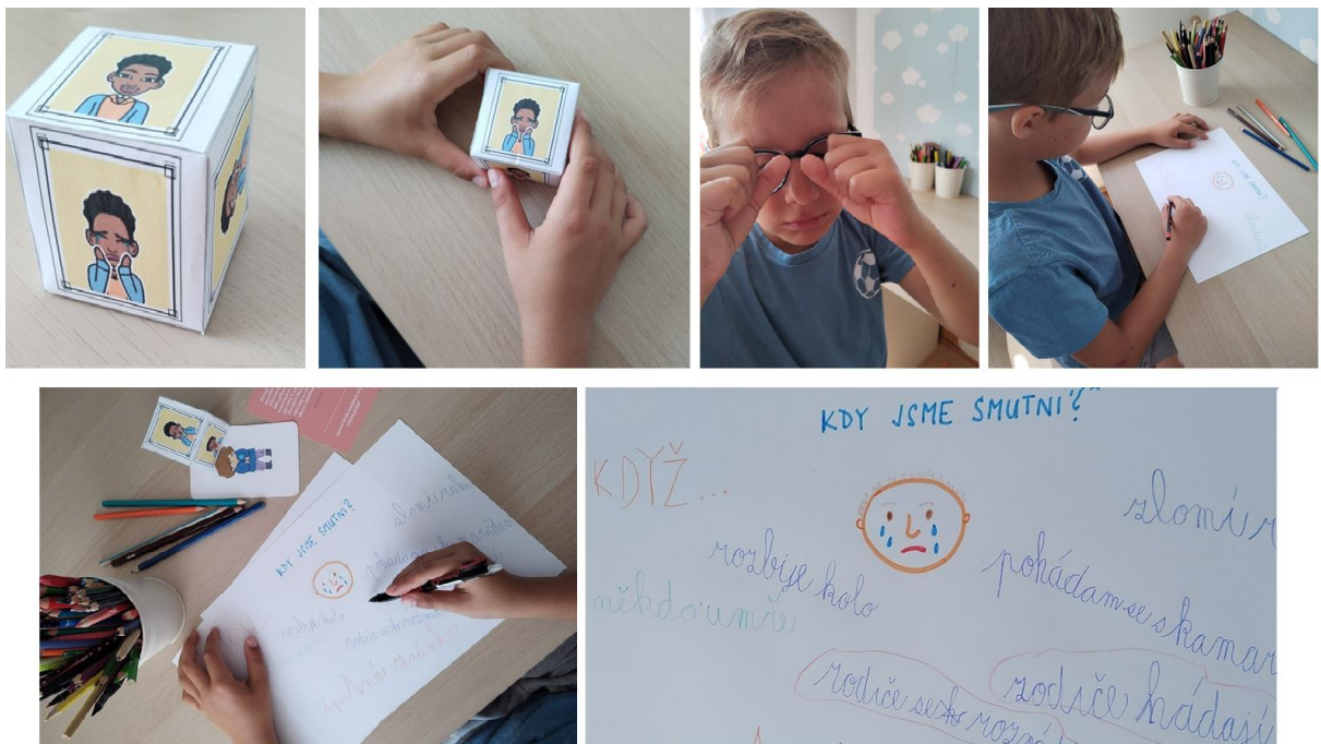
Obrázek 2 Aplikace techniky Kostka pocitů

Případně lze využít metodu Talismanu nebo Hrdiny, kdy talisman/hrdina podpoří Evu při zvládnání náročné emoce. Těmto technikám je věnována pozornost v podkapitole 4.8 Práce podporující sebevědomí dítěte.