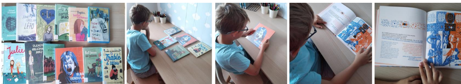
Obrázek 3 Aplikace techniky Terapeutický příběh