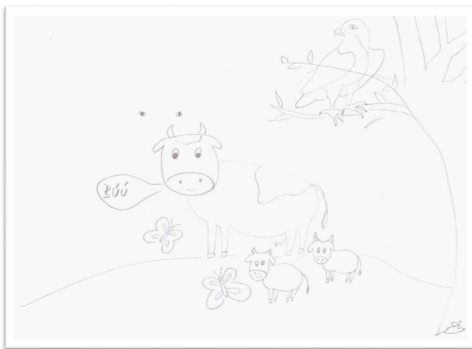
Obrázek 6 Aplikace techniky Začarovaná rodina