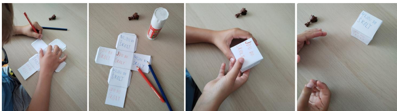
Obrázek 4 Aplikace techniky Kostka - hra s možnostmi