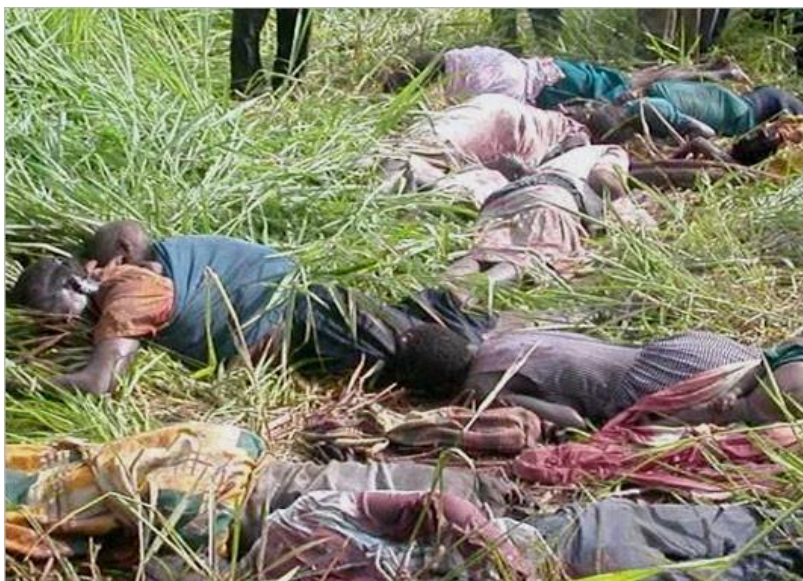
Obrázek 5: Oběti rwandské genocidy

http://www.valka.cz/clanek_14411.html?utm_source=valka_cz&utm_medium=article&utm_campaign=linkthru