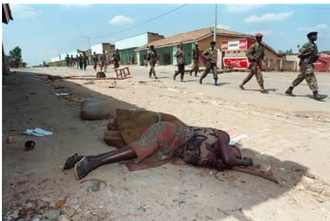
Obrázek 4: Rwandská armáda kráčí zdevastovanou vesnicí