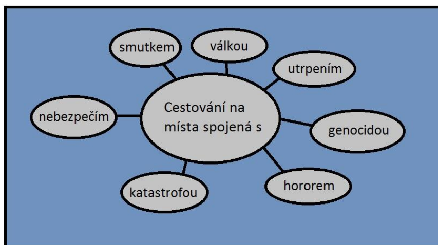
Obrázek 1: Kategorie temného cestovního ruchu podle Mináře (2014: on-line)