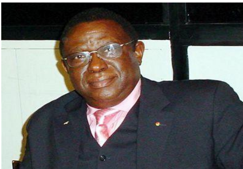
Obrázek 7: Velitel extremistických Hutuů Theoneste Bagosora

Zdroj: NOUSKOVÁ, Michaela. OSN a genocida ve Rwandě: Opatření OSN a jejich efektivita. Valka.cz [online]. 2011 [cit. 2017-08-11]. Dostupné z: http://www.valka.cz/clanek_14411.html?utm_source=valka_cz&utm_medium=article&utm_campaign=linkthru