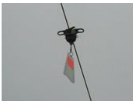
Obrázek 4 Reflexní destičky

Ornitologové ve spolupráci s magistrátem hl. m. Prahy a dopravním podnikem zvažovaly připevnění reflexních destiček FireFly, které chtěli ornitologové rozvěsit na sedmi pražských mostech. Tabulka se pomocí dvou čelistí přicvakne na trolej, na jeden most by jich bylo potřeba asi 20 ks. Na mostech přes Vltavu zemře kvůli srážce s trolejemi a dráty, které je přichycují, zhruba dvacet až třicet ptáků ročně (Berný, 2013).