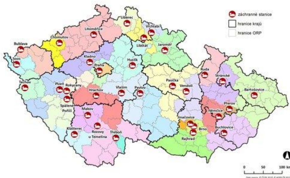
Obrázek 1 Národní síť záchranných stanic (Stýblo, 2019)

Část živočichů, jejichž návrat do přírody již není možný, slouží k ekologické výchově a osvětě veřejnosti.