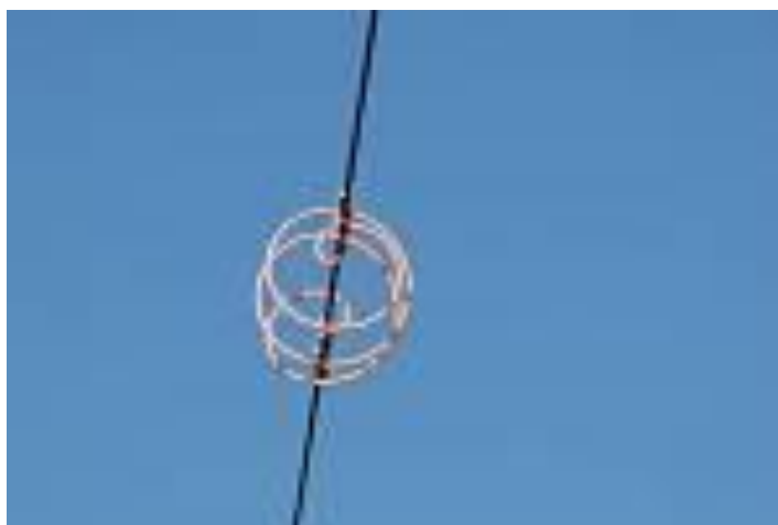
Obrázek 2 Ochranný prvek na vodiče na elektrické vedení „spirála“

Podle Strnada a Bílé (2015) se dá proti tomu bojovat např. vyznačovacemi koulemi, plastových spirál, závěsných polykarbonátových tabulek s UV stabilizací, závěsných perforovacích disků, které se otáčejí ve větru, závěsným světelným zviditelněním vodičů, závěsnými plastovými zviditelňovači vodičů nebo závěsnými rotačními prvky.