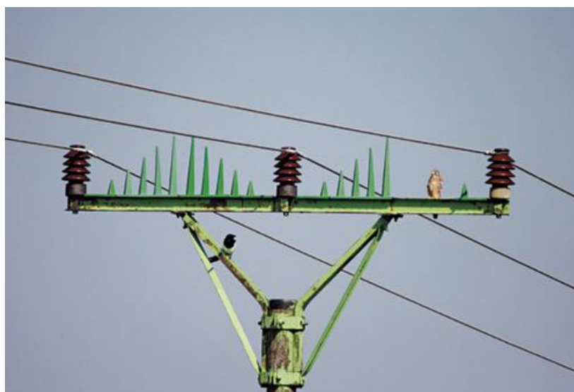
Obrázek 3 Ochrana elektrických sloupů proti dosednutí ptáků (Hlaváč a spol., 2012)

Hlaváč a spol. (2012) uvádějí, že díky tomu, že ve volné krajině ubývá stromů, usedají unavení volně žijící ptáci na neizolované konzoly sloupů elektrického vedení. Pro větší druhy, jako jsou např. dravci nebo sovy, to může mít fatální následky. Křídly se tak snadno mohou dotknout drátů, přičemž dojde k uzavření elektrického obvodu a pták se popálí. Pták tak není schopen se pohybovat a umírá v bolestech pod sloupem elektrického vedení. Mezi nejnebezpečnější typy sloupu patří sloup, který má izolátory připevněné vedle sebe na vodorovné konzoli a se sloupem tak vytváří písmeno T. V lepším případě dojde jen k lehkému zasažení a pták má sežehnuté opeření na křídlech a je v mírném šoku.