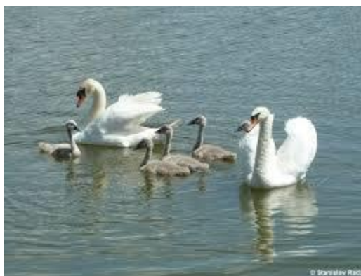
Obrázek 5 Labuť velká (naturabohemica.cz)

Mimo období rozmnožování, kdy žije labuť velká společně se svým partnerem, se labuť zdržují samostatně nebo v menších hejnech. Během roku se neprojevuje nijak hlasitě, díky tomu dostala i anglický název „Mute Swan“, tedy nemá labuť. Jeden z mála hlasových projevů, kterým labuť upozorní na svou přítomnost je mechanická rezonance letků v letu či tlučení křídel o vodní hladinu při vzletu. Pokud brání své teritorium, hlasitě syčí, prohýbají krk a mávají při tom křídly. kdy ještě prohýbá krk a mává přitom křídly. (Machač, 2008)