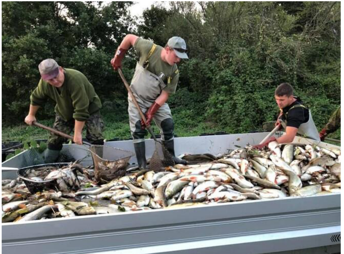
Obrázek 11 Nakládání mrtvých ryb po havárii