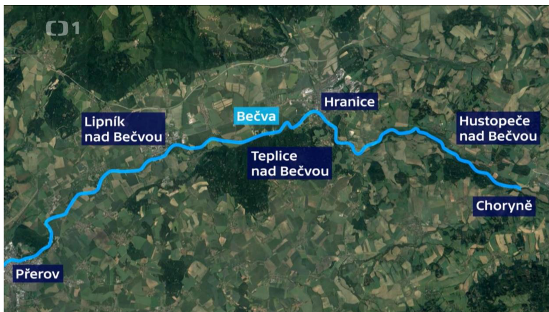
Obrázek 3 Mapa znečištěného úseku (Reportéři ČT)