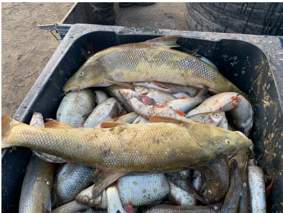
Obrázek 6 Mrtvé ryby po havárii připravené na odvoz do kaflérie