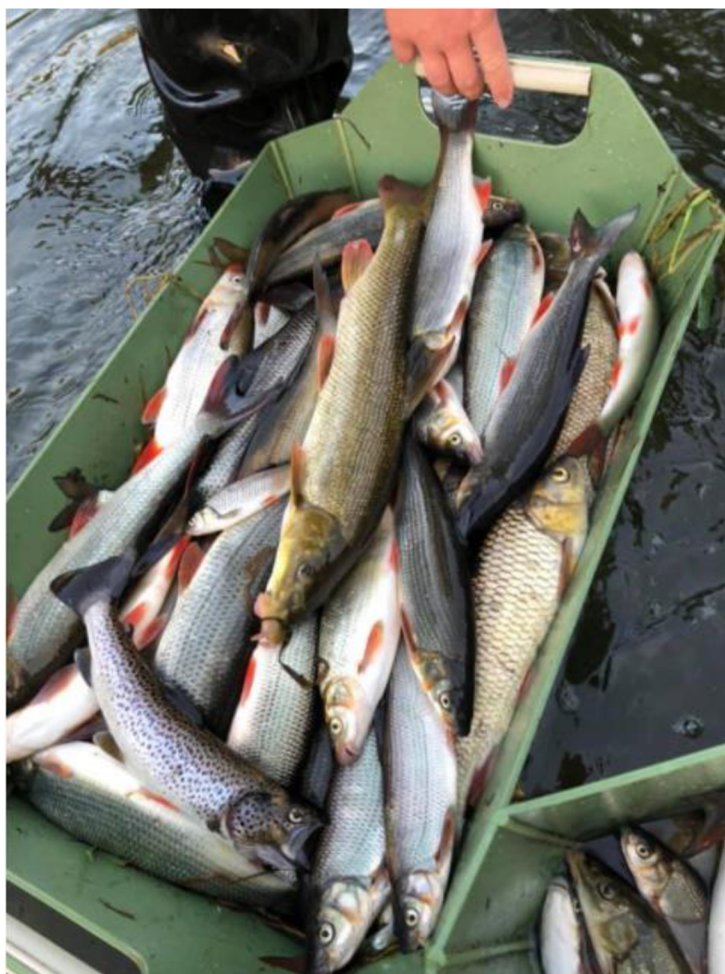
Obrázek 8 Mrtvé ryby po havárii