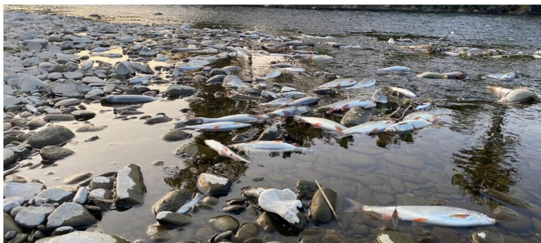
Obrázek 7 Mrtvé ryby v řece po havárii