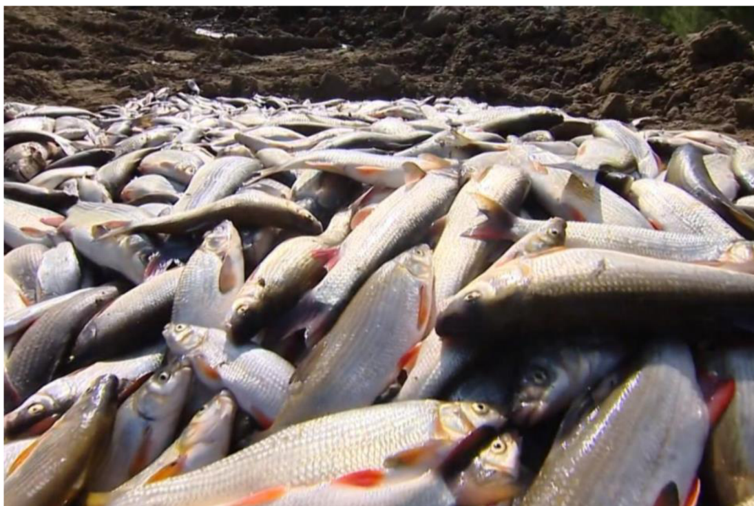
Obrázek 2 Vytažené mrtvé ryby po havárii