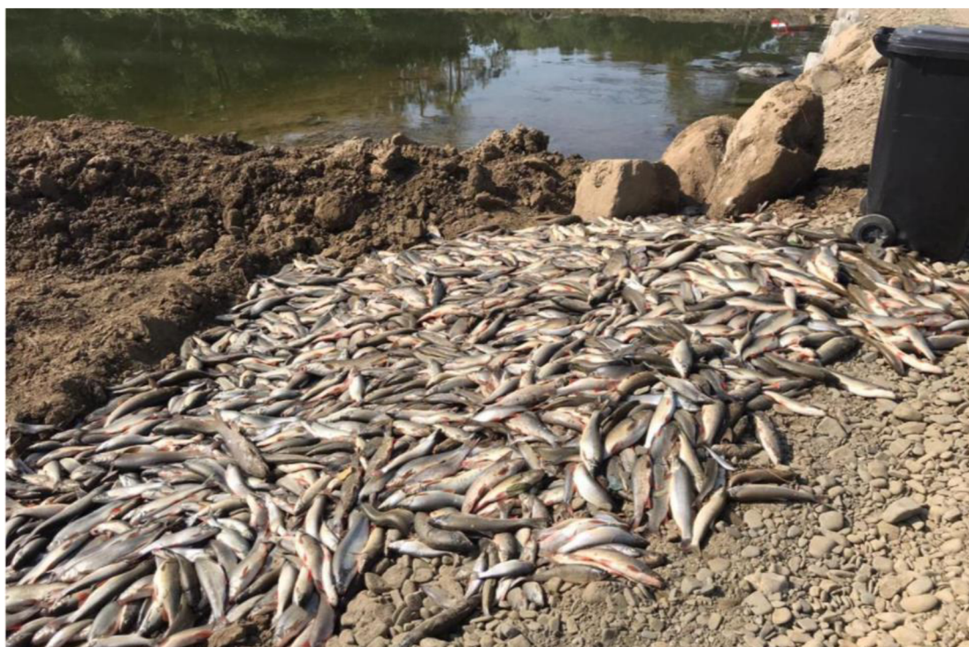
Obrázek 3 Vytažené mrtvé ryby po havárii