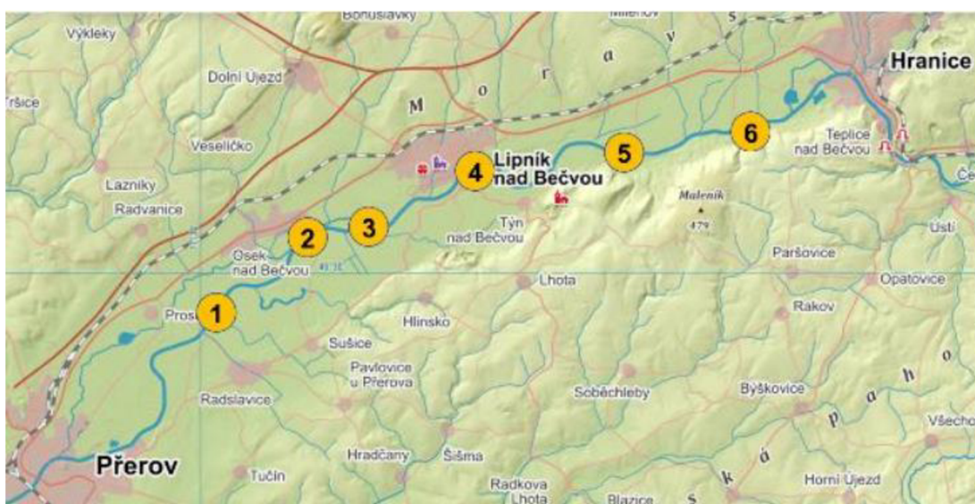
Obrázek 1 Mapa monitoringu rybního společenstva

probíhal a to konkrétně: Grymov (1), Oldřichov (2), Strhanec (3), Lipník (4), Zadní Familie (5) a rybáře (6). Odchyt ryb byl proveden pomocí elektrického agregátu a po odlovu byli zaneseny druhé příslušnosti a velikosti vylovených ryb. Výsledky ukázali výskyt celkem čtrnácti druhů ryb a to: štika obecná, plotice obecná, jelec proudník, jelec tloušť, ostroretka stěhovavá, hrouzek dunajský, střevlička východní, parma obecná, ouklej obecná, ouklejka pruhovaná, podoustev říční, hořavka duhová, mřenka mramorová, okoun říční. Z toho dominantní druhy v dané lokalitě tvořili jelec tloušť, ouklejka pruhovaná a ostroretka stěhovavá ( Halačka, Vetešník, 2020 ).