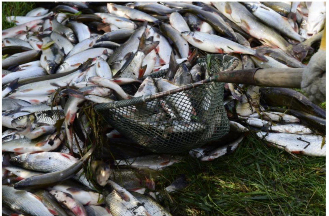
Obrázek 5 Vytažené mrtvé ryby po havárii