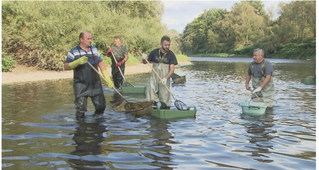
Obrázek 10 Rybáři, kteří loví mrtvé ryby (Reportéři ČT)