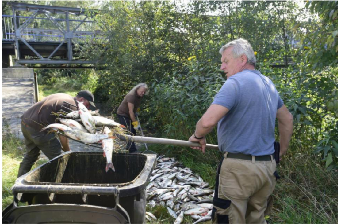
Obrázek 4 Nakládání mrtvých ryb po havárii