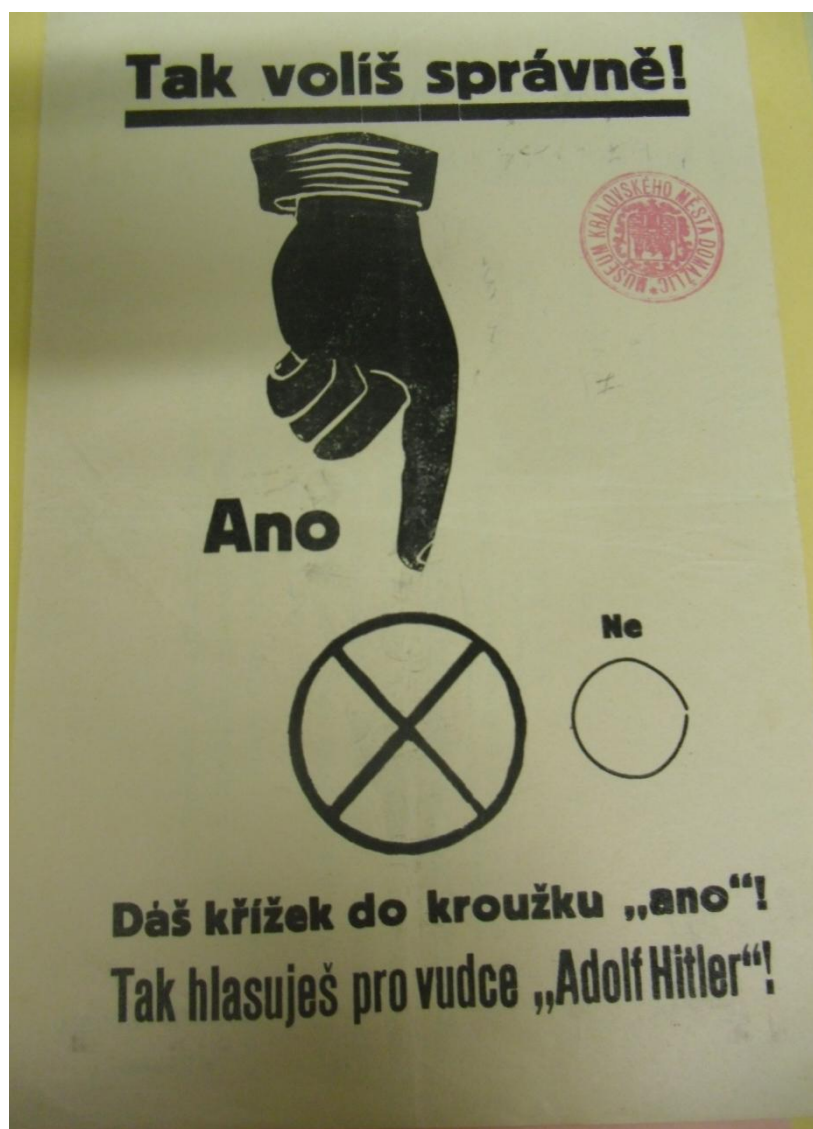
Archiv Muzea Chodska v Domažlicích, D2/1b – 2. světová válka, rok 1938 zábor Chodska