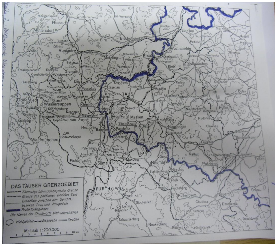
Archiv Muzea Chodska v Domažlicích D2/5d – 2. světová válka, americká armáda