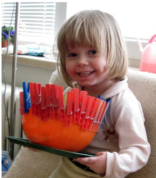
Fotografie č. 1