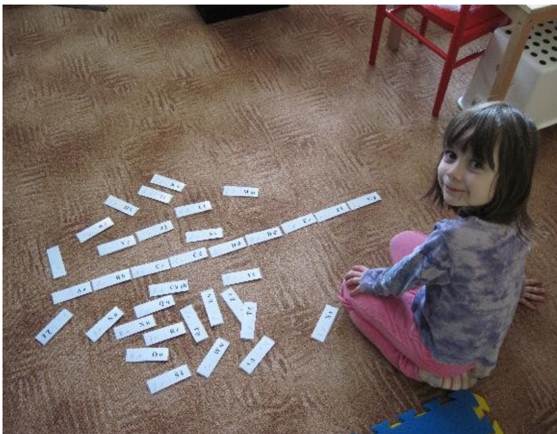
Fotografie č. 3

Na fotografii č. 3 je vyobrazena pomůcka Domino, kdy dítě přiřazuje psací písmeno k tiskacímu. Zároveň domino postupně spojuje abecedu, aniž ji musí dítě umět.