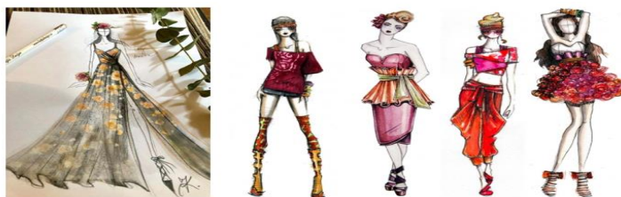
Obrázek č. 5: Návrh svatebních šatů – zadání projektu