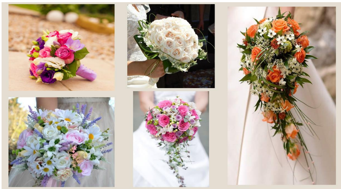
Obrázek č. 4: Presentace svatební floristiky – svatební kytice