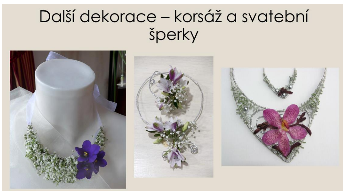
Obrázek č. 2: Prezentace svatební floristiky – svatební šperky