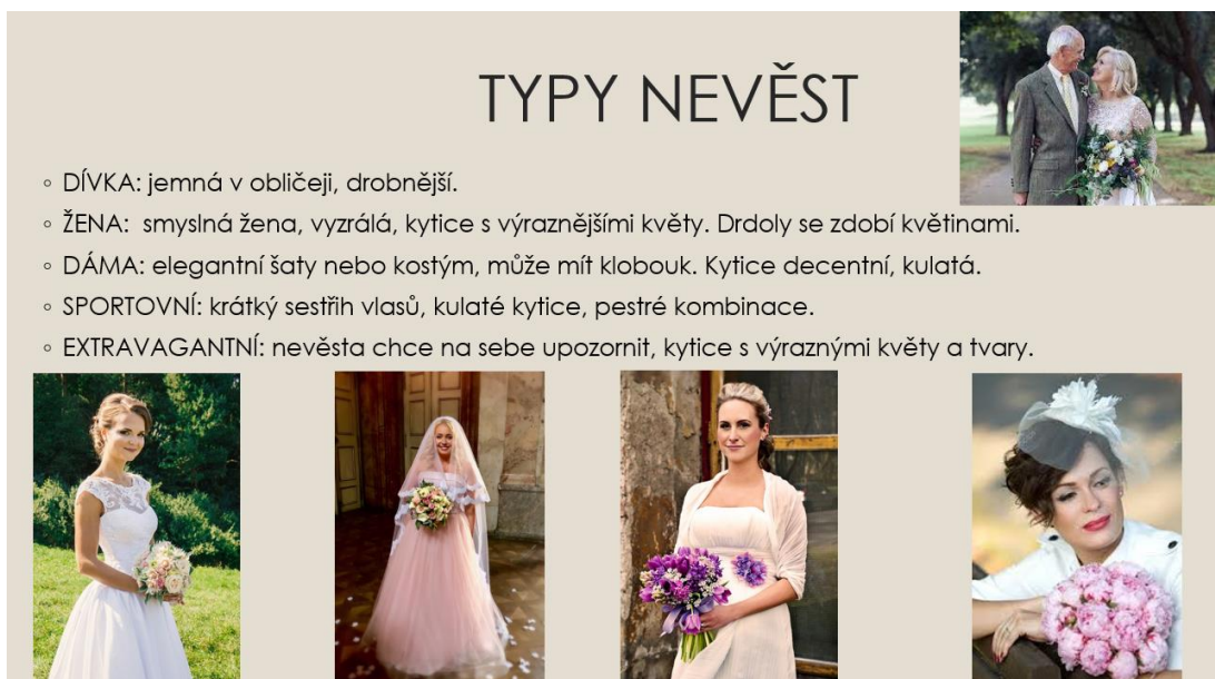
Obrázek č. 1: Prezentace svatební floristiky