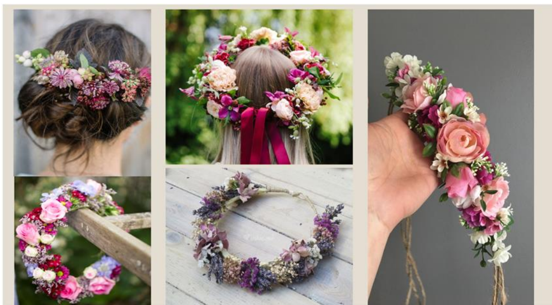
Obrázek č. 3: Presentace svatební floristiky – svatební čelenka