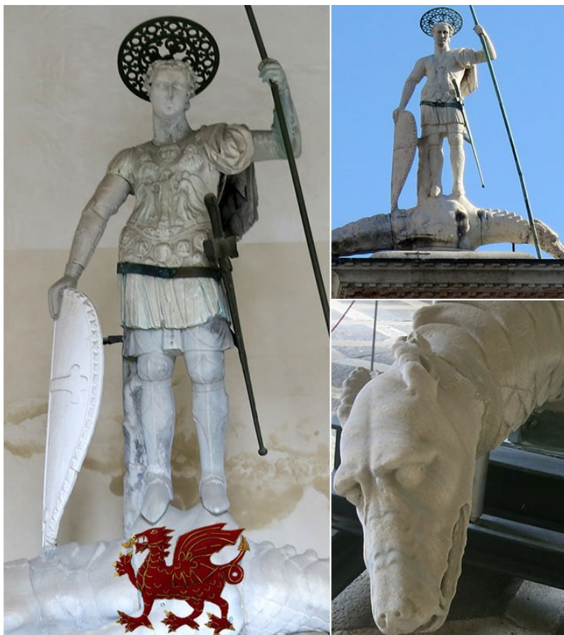
Obrázek č. 4, Benátky