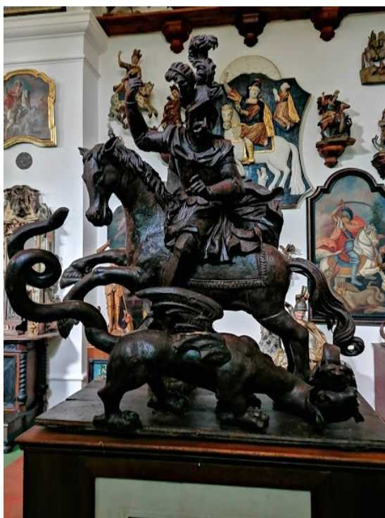
Obrázek č. 14, Konopiště