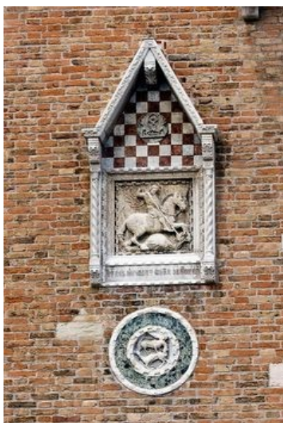
Obrázek č. 5, Benátky