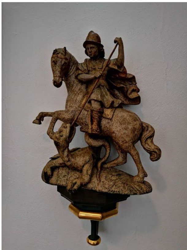
Obrázek č. 15, Konopiště