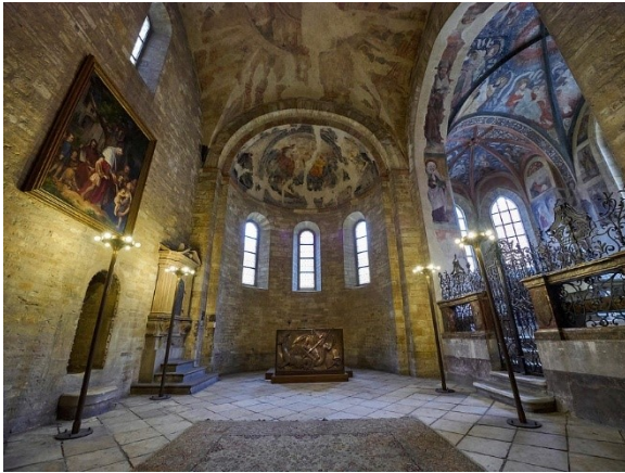
Obrázek č. 6, Bazilika svatého Jiří