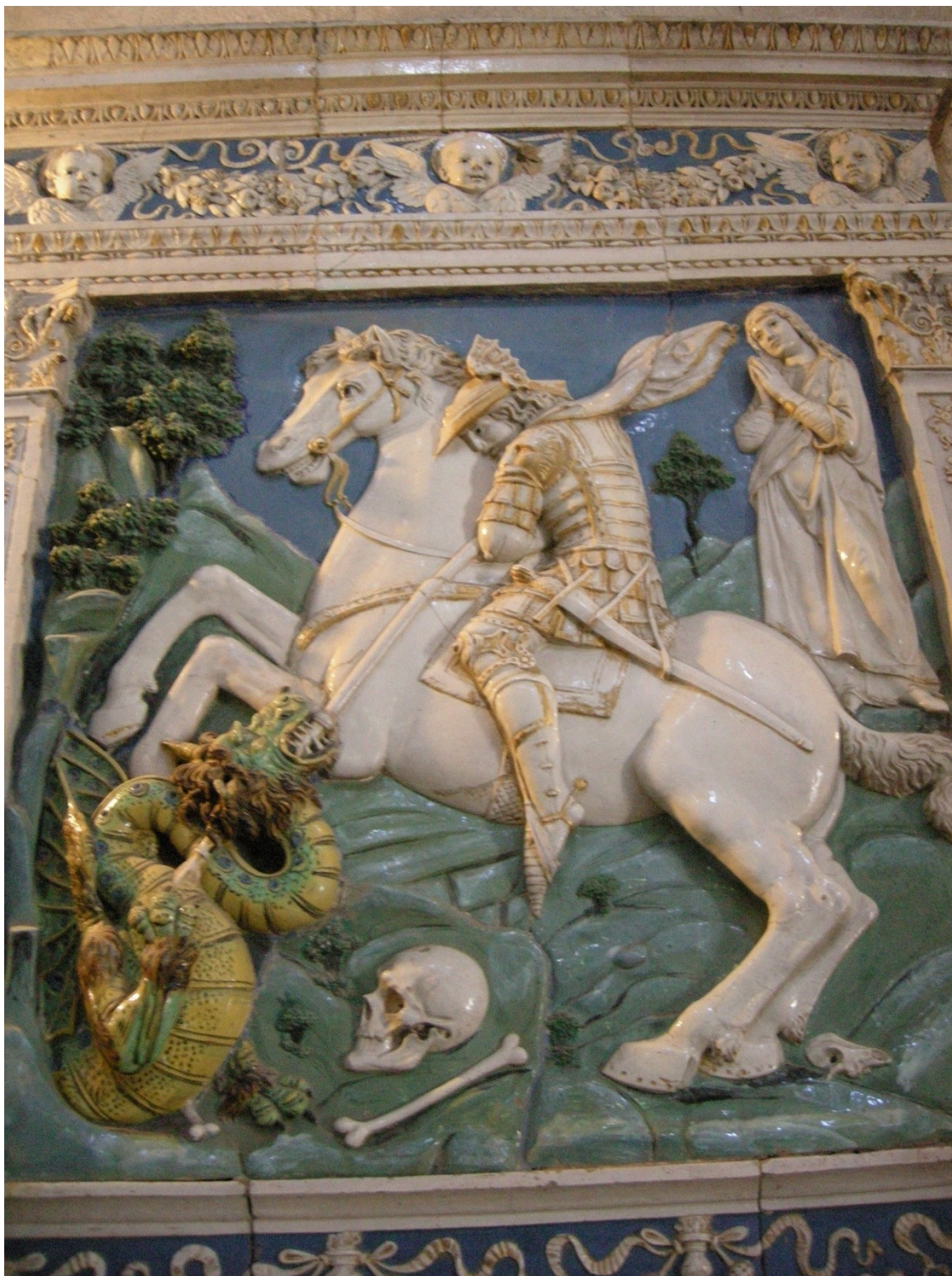
Obrázek č. 3, Andrea della Robbia (1495-1500)