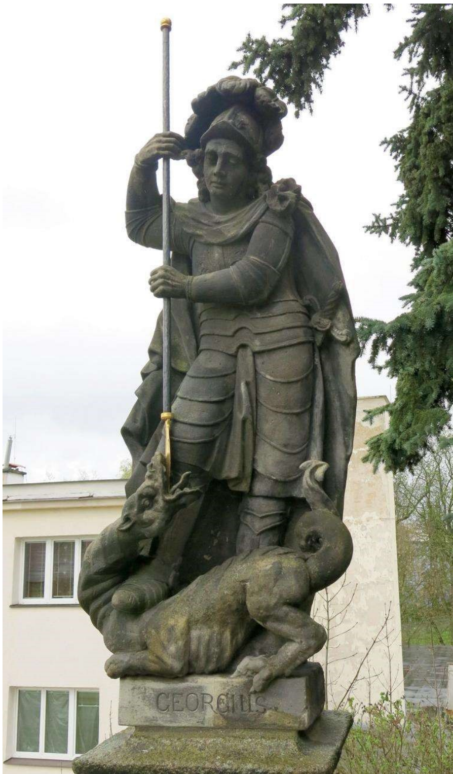
Obrázek č. 10, Cheb