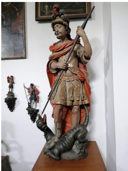
Obrázek č. 12, Konopiště