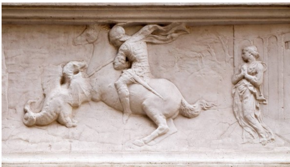
Obrázek č. 2, Donatello – Reliéf na podstavci svatého Jiří v Orsanmichele (1414-1416)