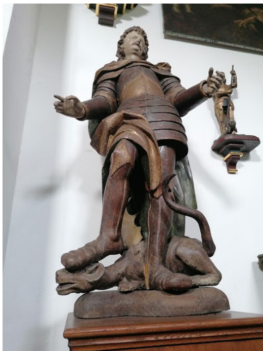
Obrázek č. 11, Konopiště