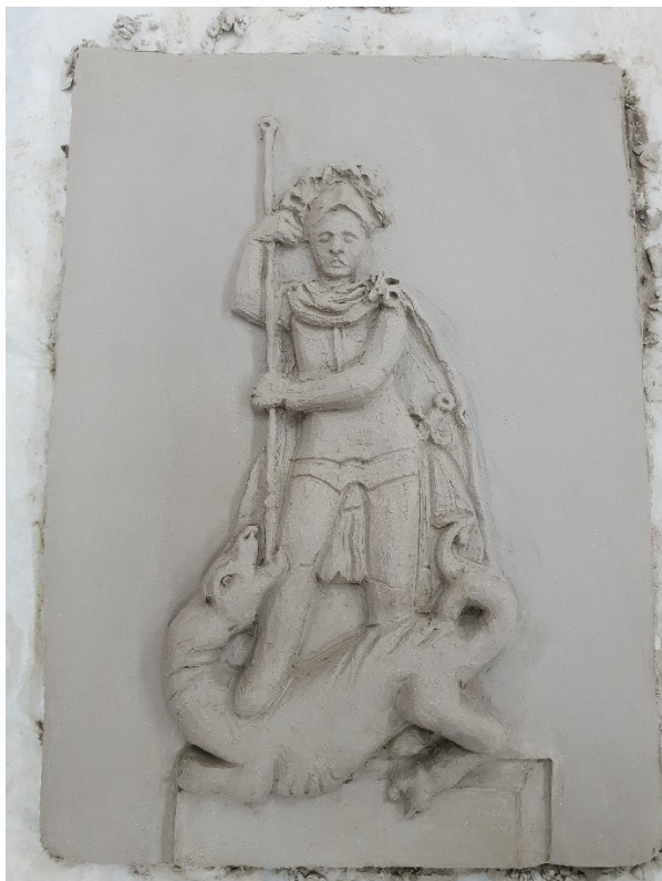
Obrázek č. 18