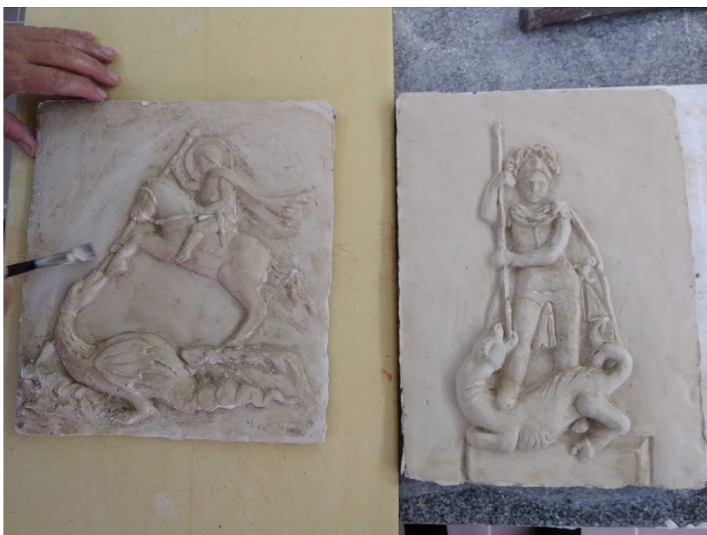
Obrázek č. 23