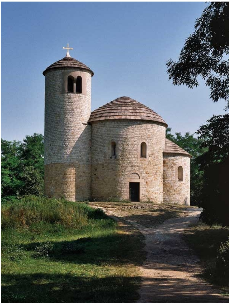
Obrázek č. 7, Rotunda svatého Jiří