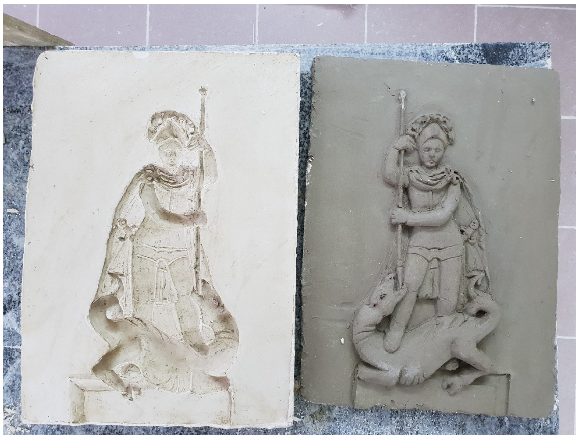
Obrázek č. 20