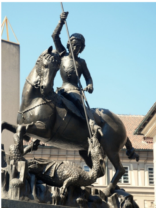
Obrázek č. 9, kašna na Pražském hradě