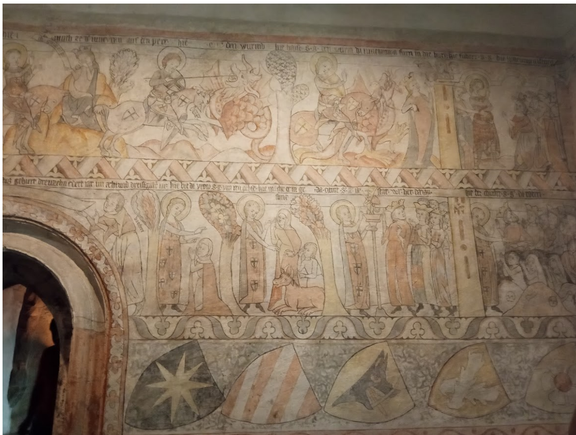
Obrázek č. 8, svatojiřská legenda Jindřichův Hradec