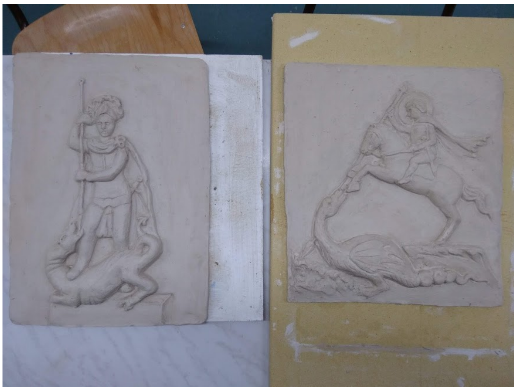
Obrázek č. 22