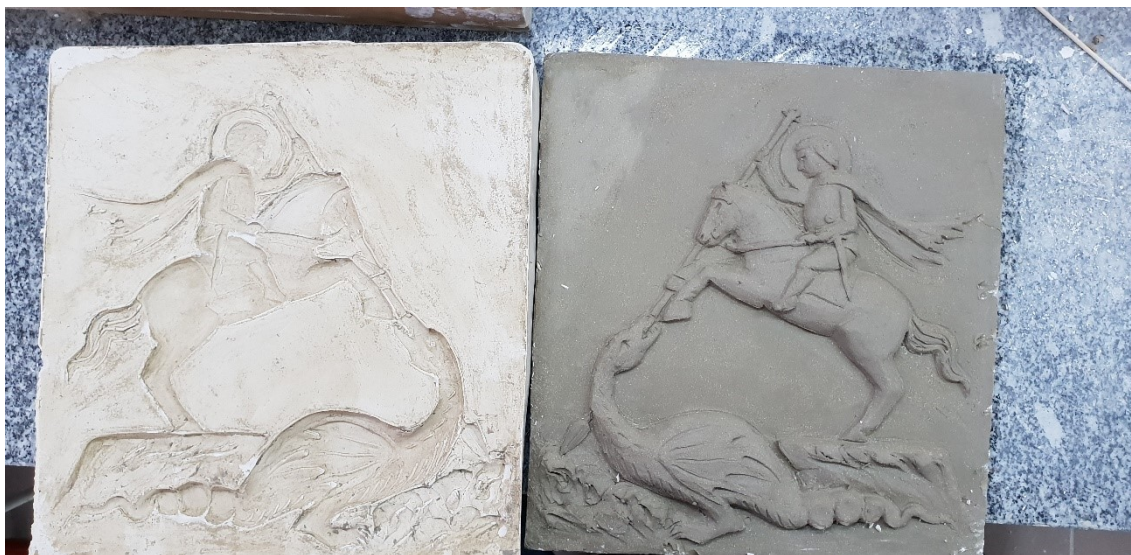
Obrázek č. 21