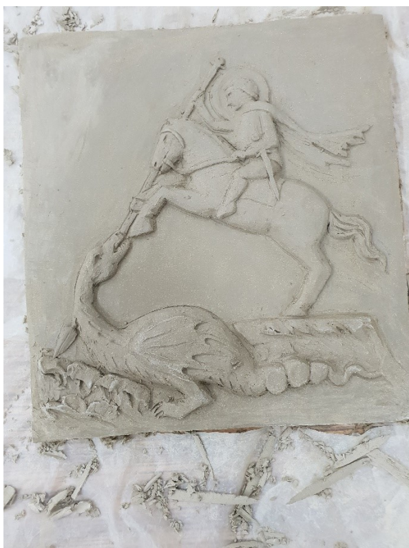
Obrázek č. 19