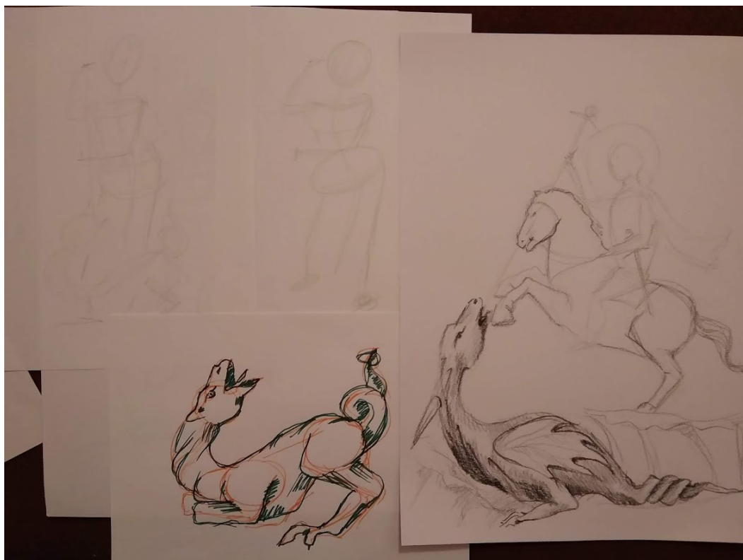
Obrázek č. 17