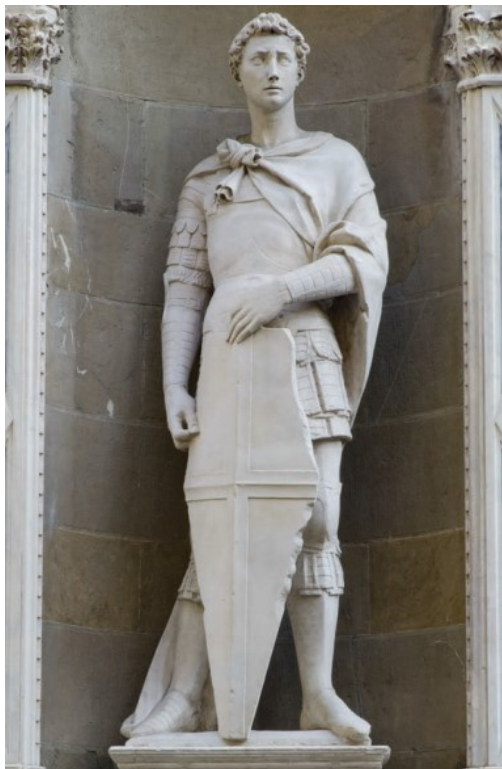
Obrázek č. 1, Donatello – Stojící socha svatého Jiří (1416)