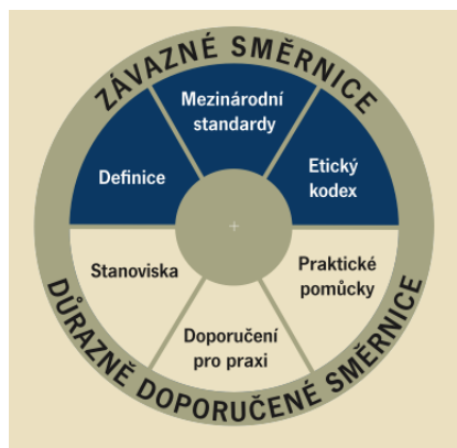
Obrázek 1 Mezinárodní rámec profesní praxe interního auditu