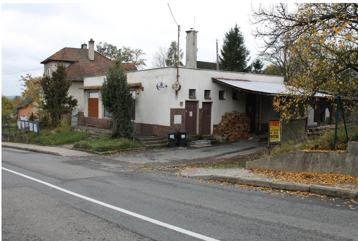
Obrázek 4 Budova místní hospody