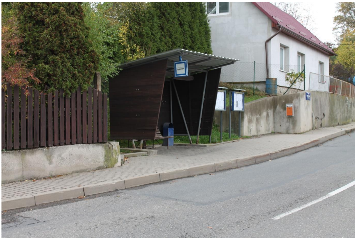
Obrázek 8 Zastávka veřejné hromadné dopravy