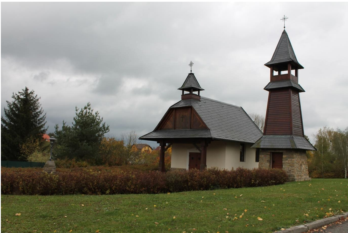
Obrázek 2 Kaplička sv. Cyrila a Metoděje