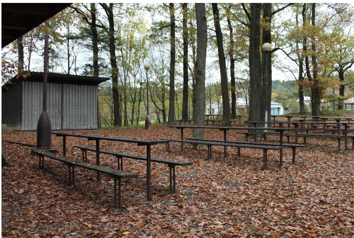
Obrázek 6 Místní Výletišťe, místo konání zábav a jiných akcí