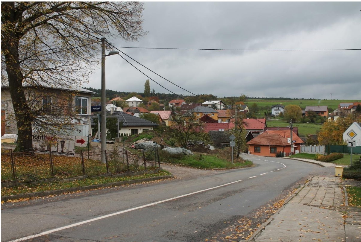
Obrázek 1 Místní část Velíková