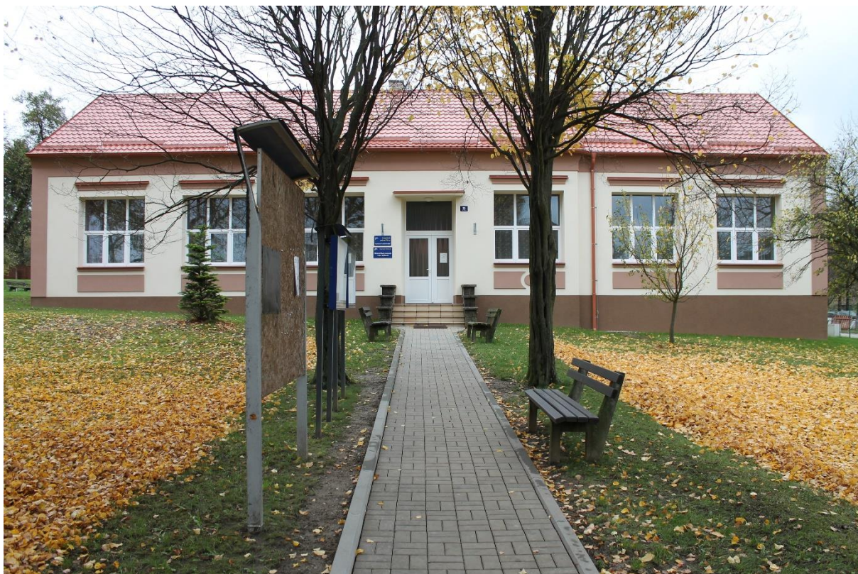
Obrázek 5 Budova bývalé základní školy