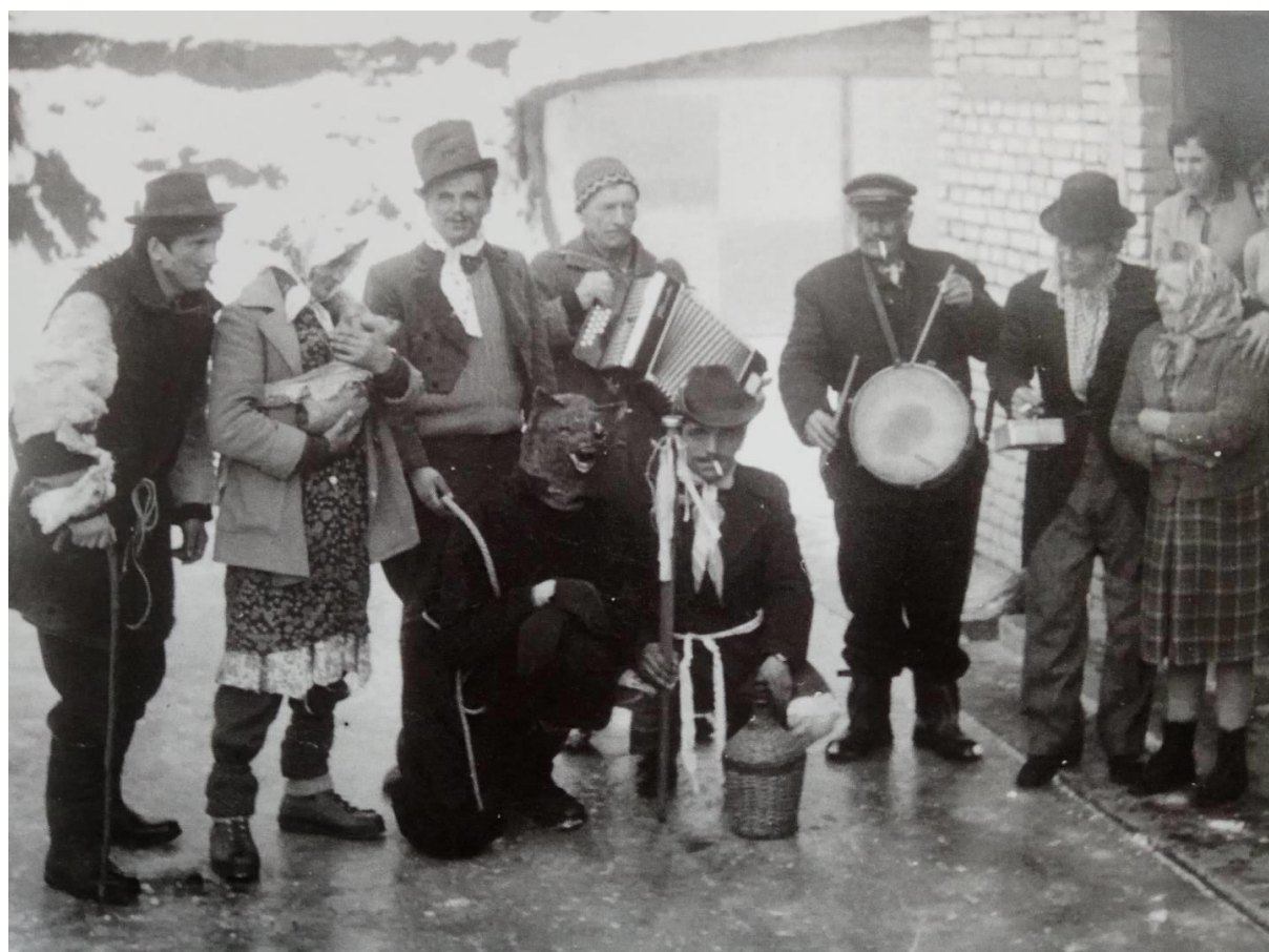
Obrázek 9 Fotografie z masopustu v roce 1975