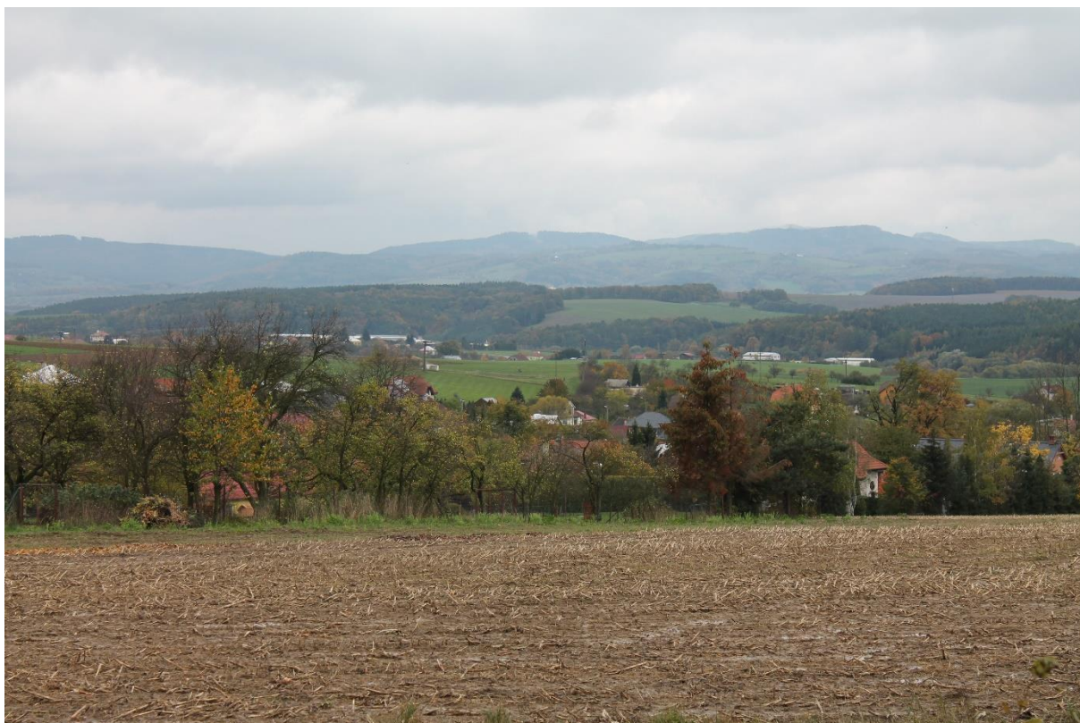
Obrázek 7 Pohled na místní část Velíková