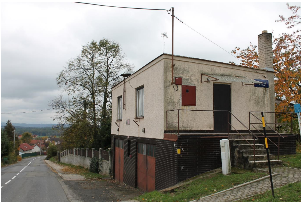
Obrázek 3 Budova hasičské zbrojnice