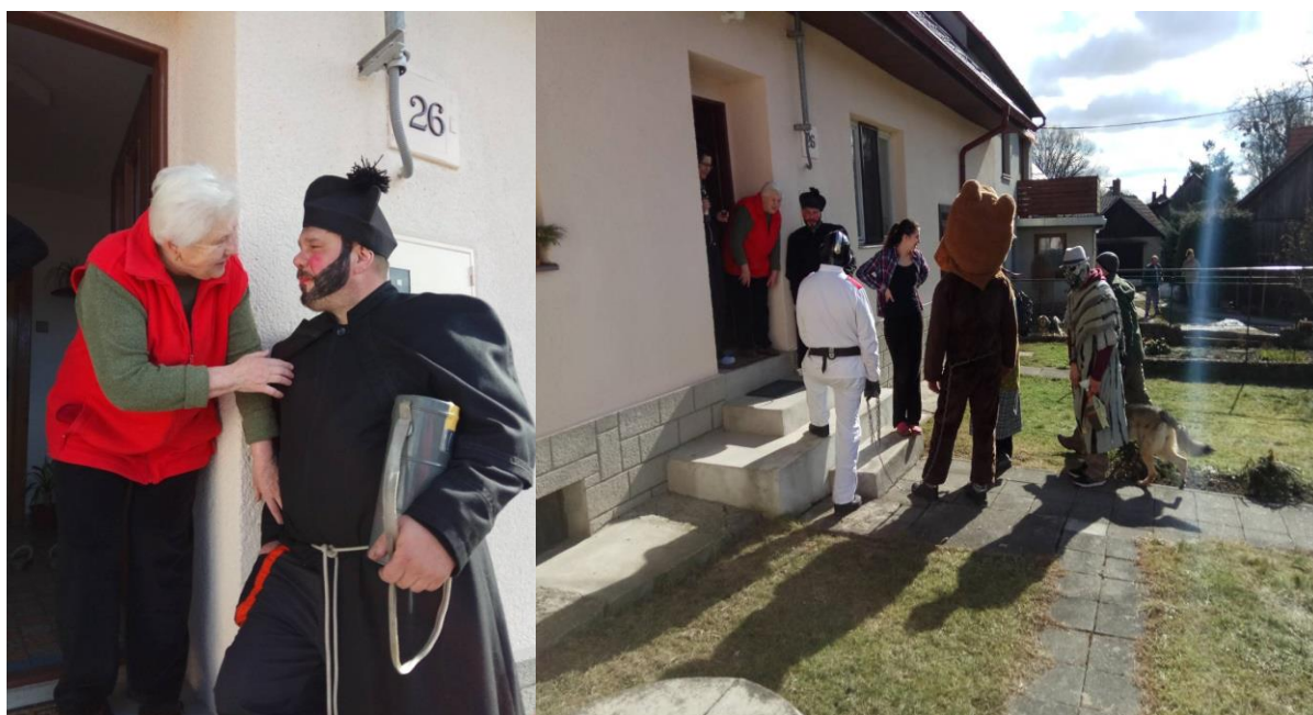
Obrázek 8 Masopust v roce 2017