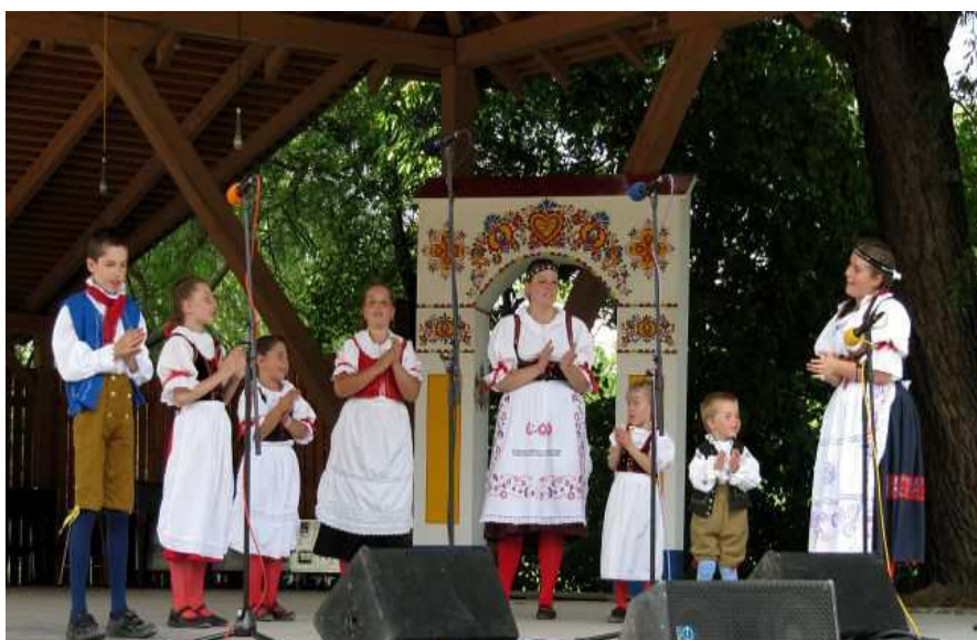
Obrázek 8 - pódium na festivalu v Tvrdonicích