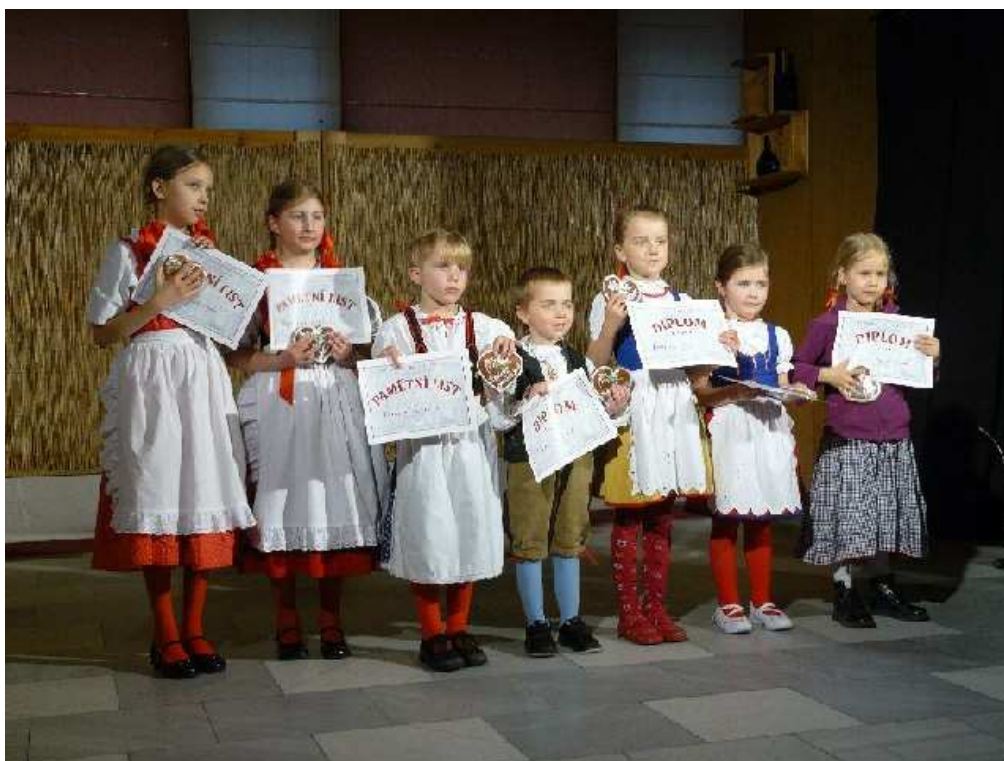
Obrázek 10 – nejšíkovnější jihočeští zpěváci