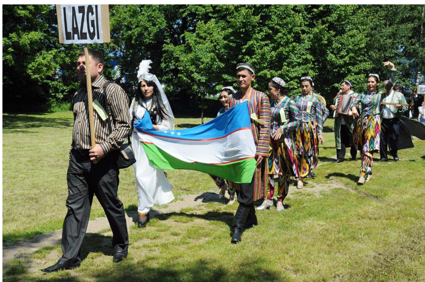
Obrázek 7 - zahraniční soubor na festivalu v Tvrdonicích