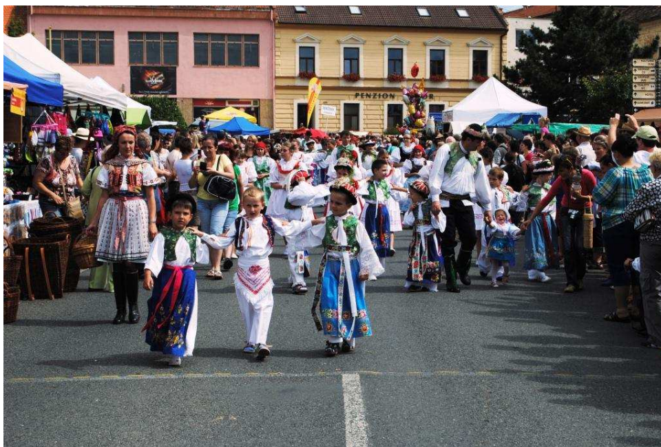
Obrázek 4 - průvod ve Strážnici