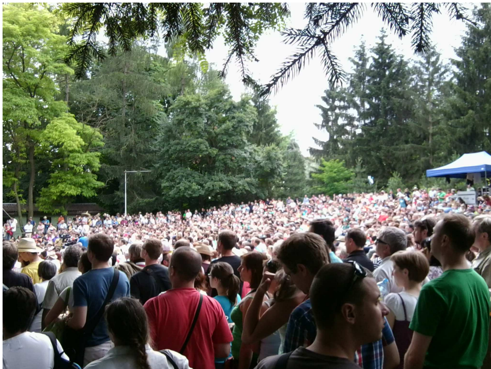
Obrázek 1 - návštěvnost při soutěži Verbuňk

Fotografie pořízené na MFF Strážnice, Podluží v písni a tanci Tvrdonice