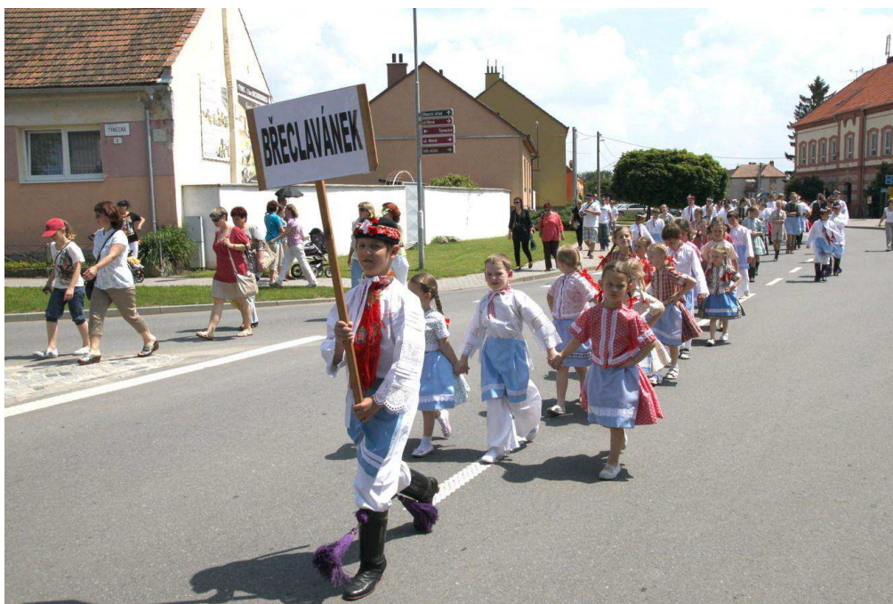
Obrázek 6 - průvod v Tvrdonicích