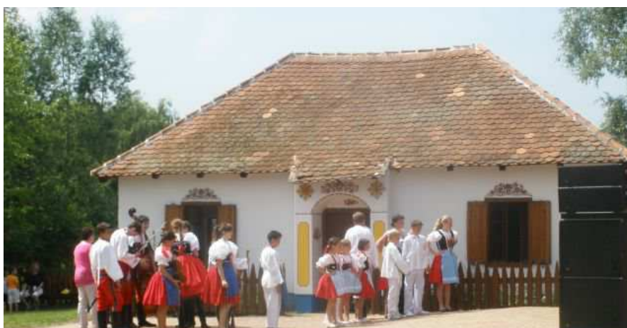
Obrázek 9 - příprava dětského souboru na vystoupení