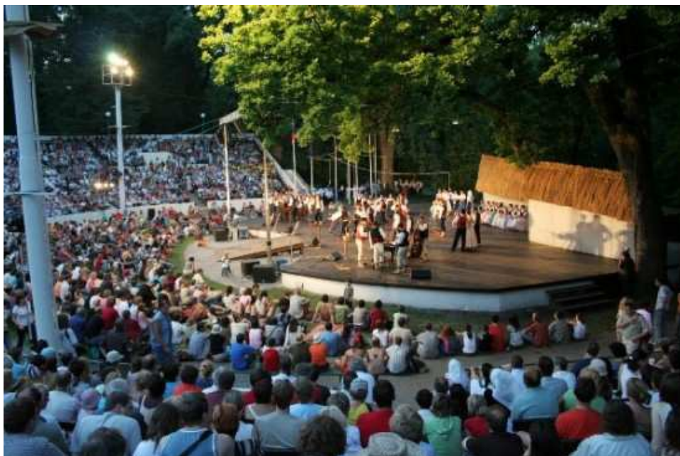
Obrázek 3 - areál Bludník, Strážnice