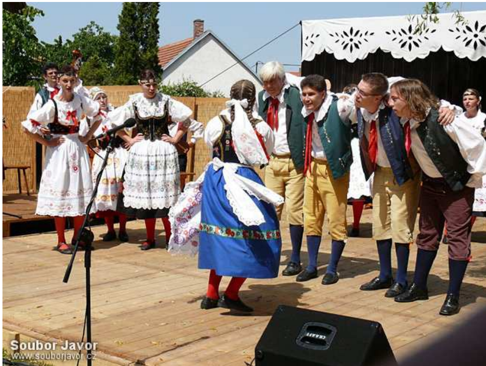
Obrázek 10 – z Jihočeského folklorního festivalu Kovářov