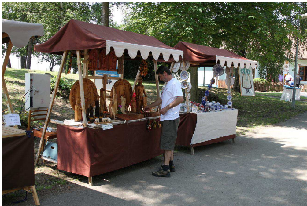
Obrázek 5 - Tvrdonický jarmark při festivalu Podluží v písni a tanci 40