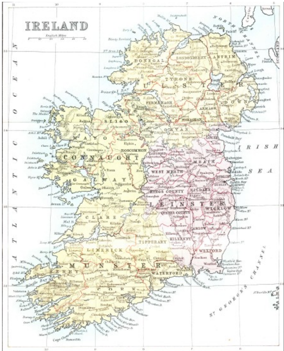
Mapa Irska 1909 110