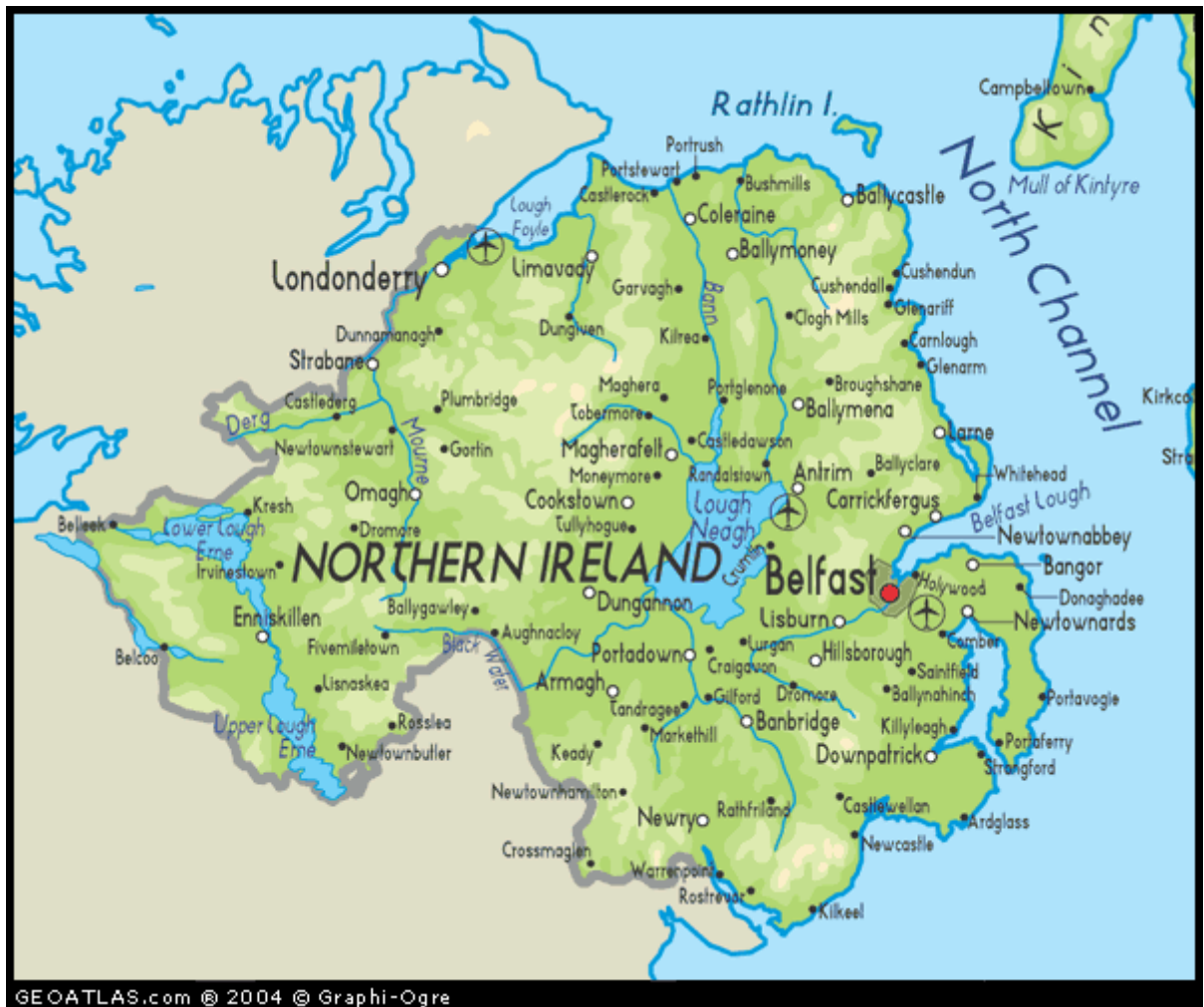
Mapa Severního Irska 2004 111