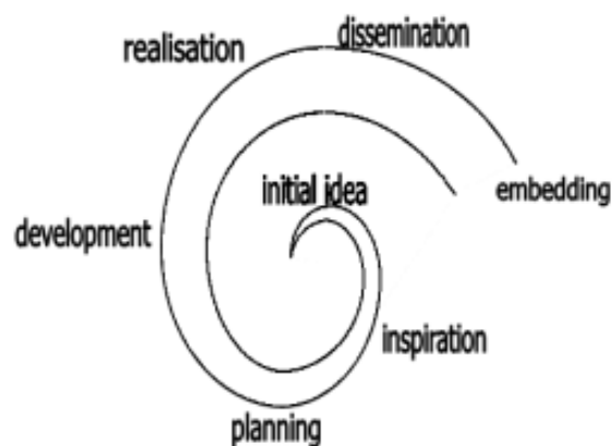
Figure 1. The different stages of the Spiral of Innovations

To properly outline the results of the selected case study and to explore the development of a local sustainable food system, I used an analysis scheme to assist the reception of the results. The innovation spiral identifies seven stages in an innovation process, from the initial idea to the innovation embedding phase (Wielinga et al., 2008). The principle is based on the observation that each stage of the innovation spiral includes different activities, actors and pitfalls to avoid.