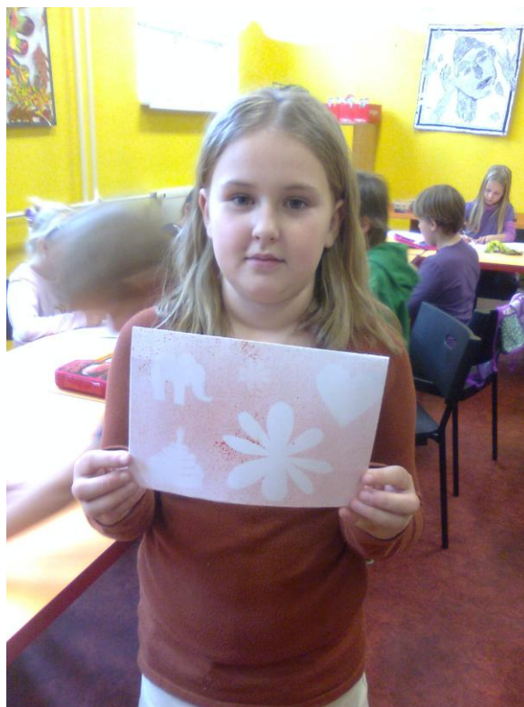
Fotografie č. 17