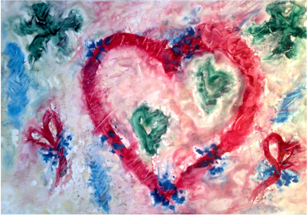
Fotografie č. 8