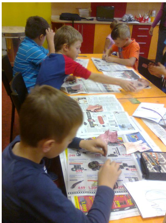
Fotografie č. 20