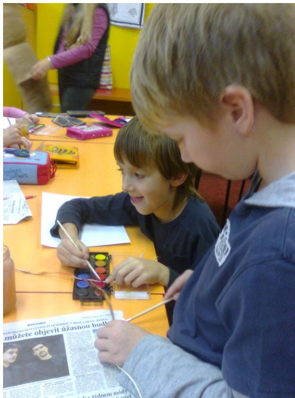
Fotografie č. 3