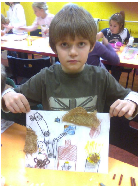
Fotografie č. 10