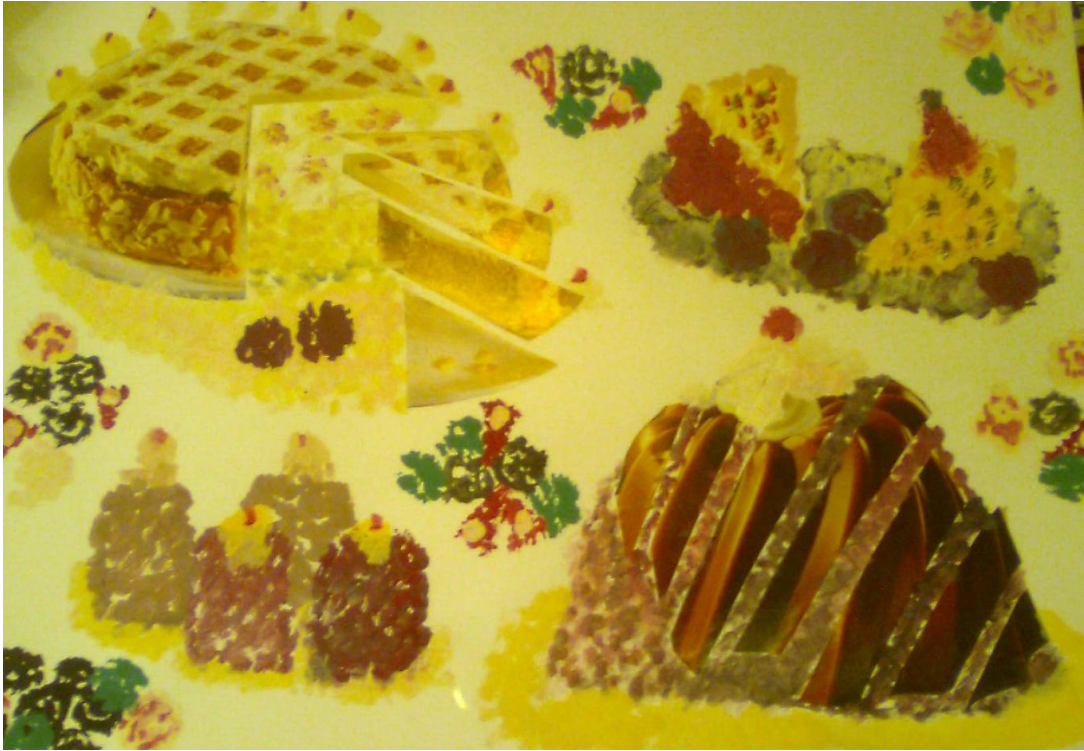
Fotografie č. 7