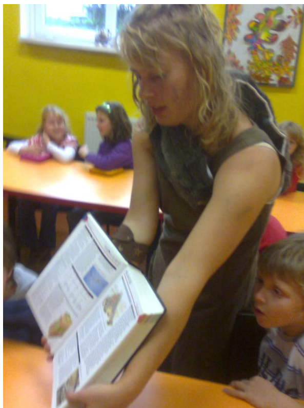
Fotografie č. 19