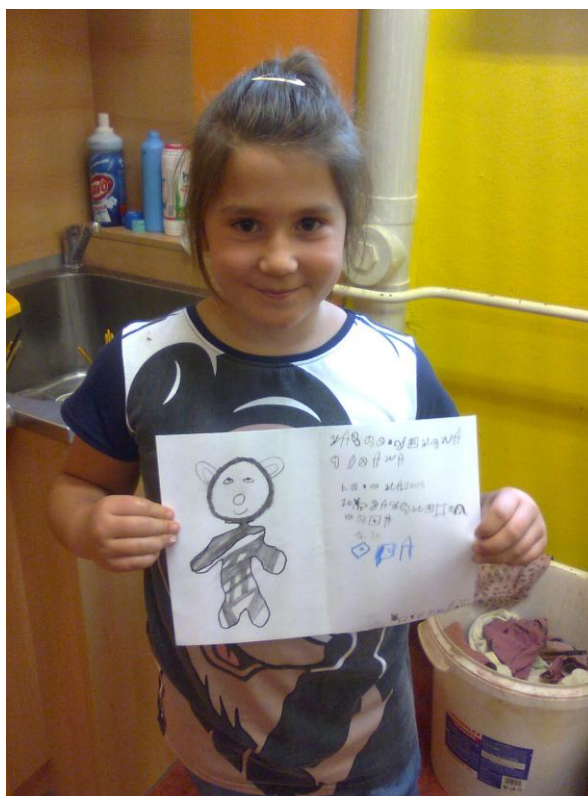
Fotografie č. 18