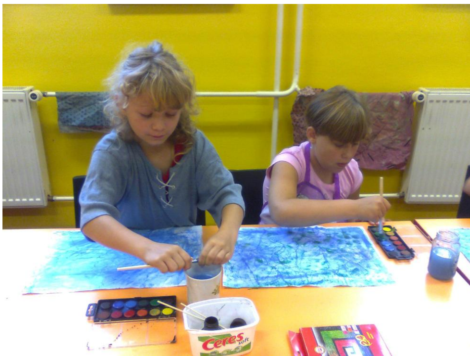
Fotografie č. 8