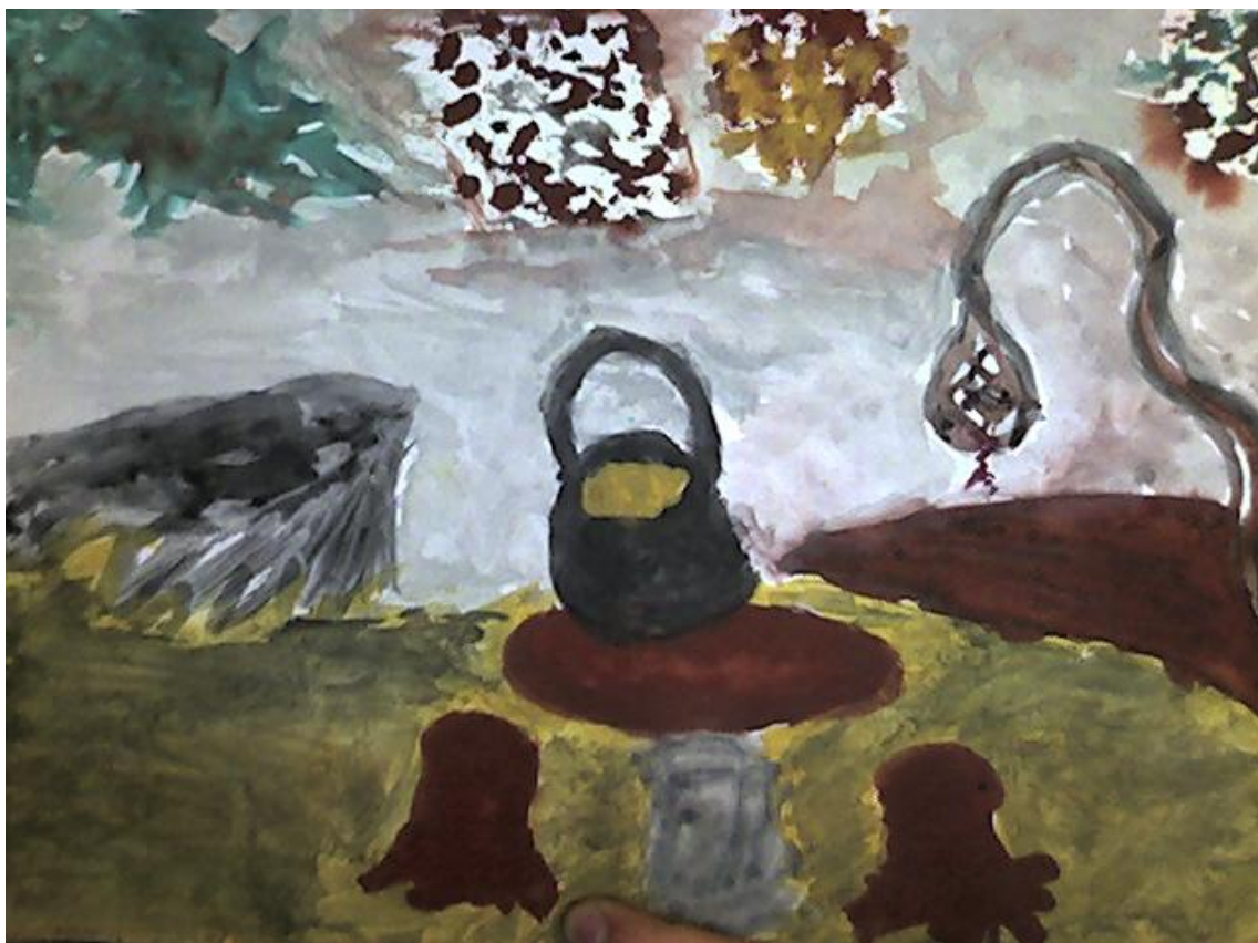
Fotografie č. 3