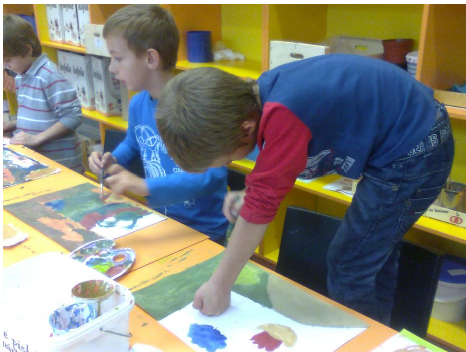
Fotografie č. 5