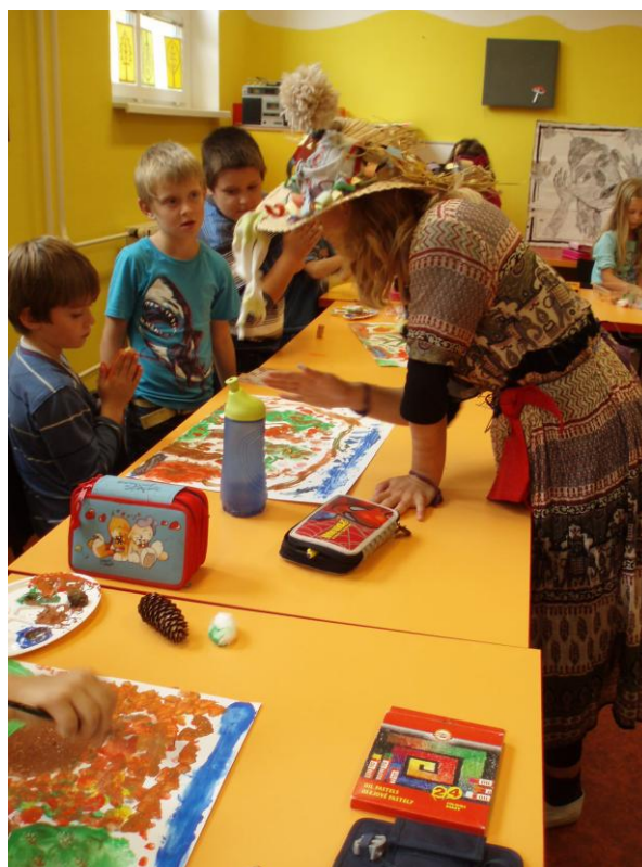
Fotografie č. 2