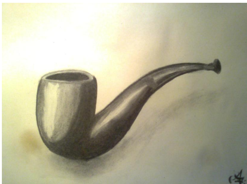
Fotografie č. 6