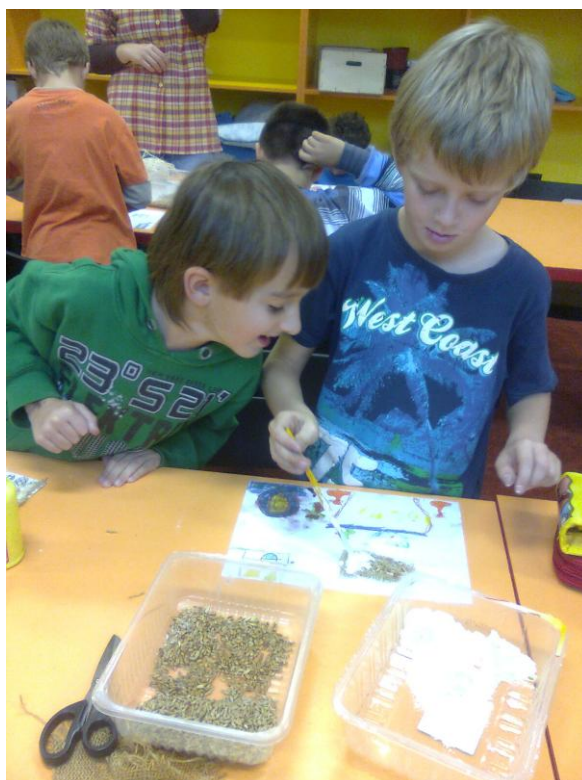
Fotografie č. 11