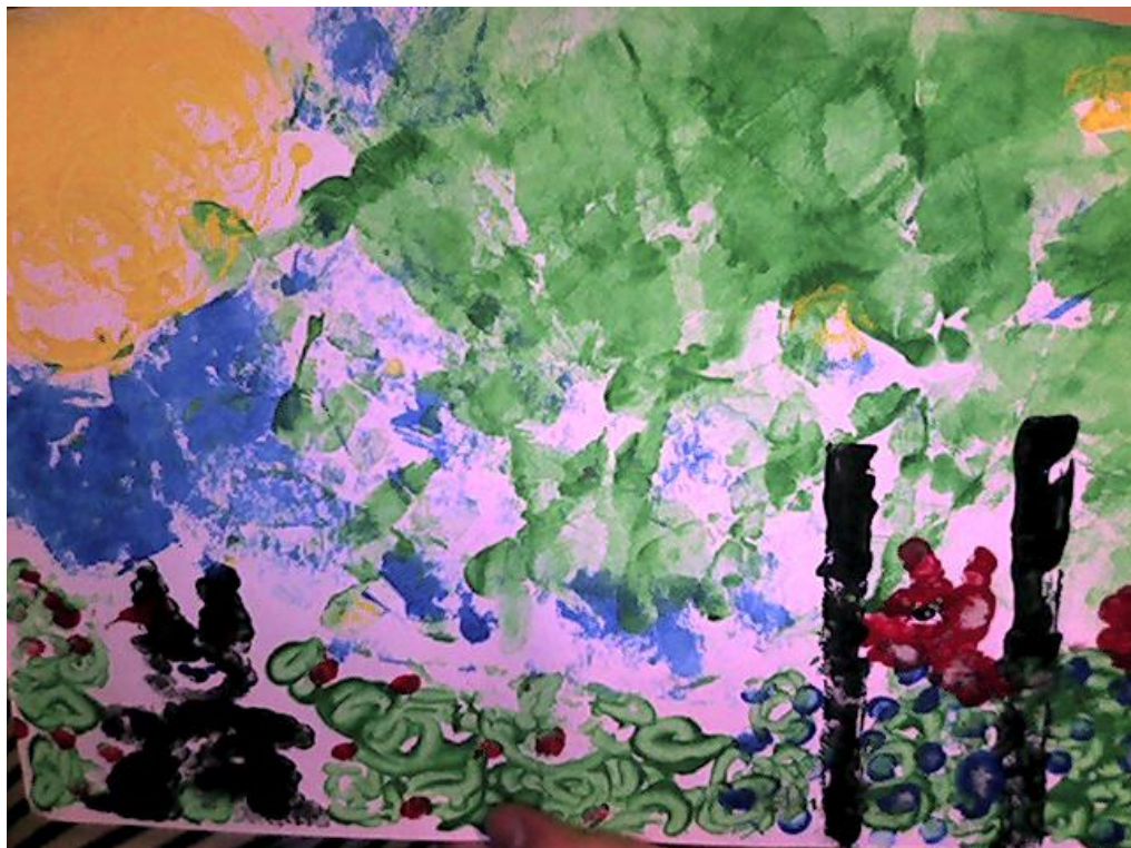
Fotografie č. 1