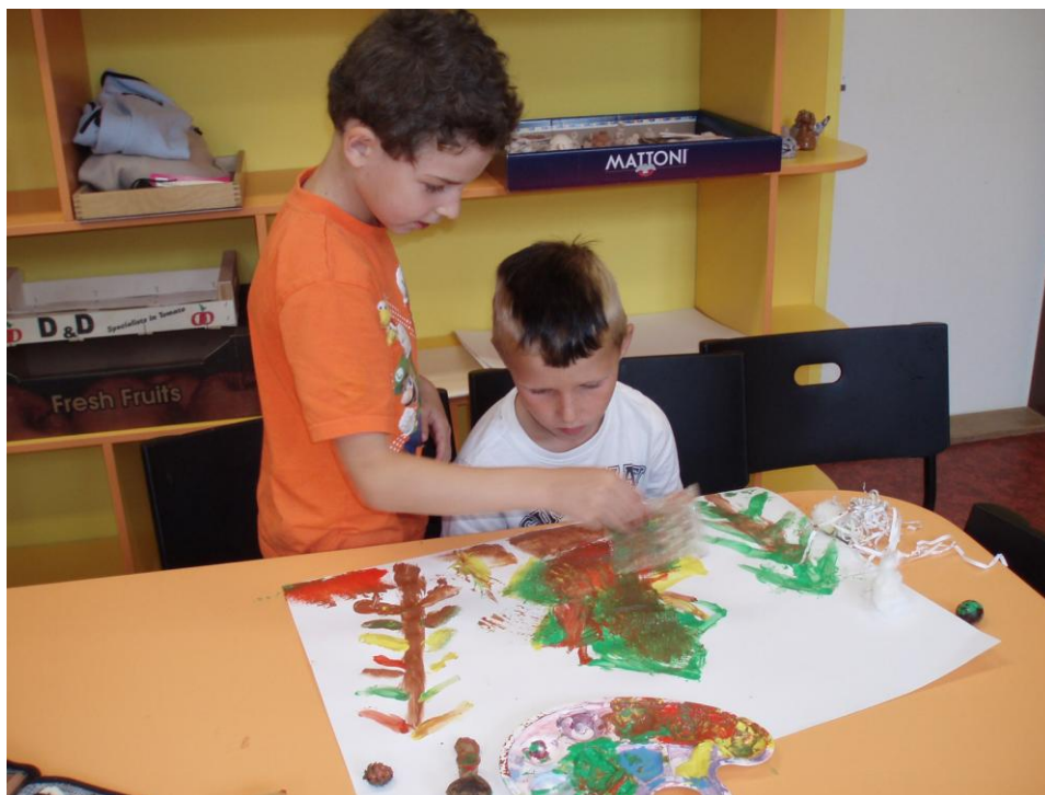
Fotografie č. 1