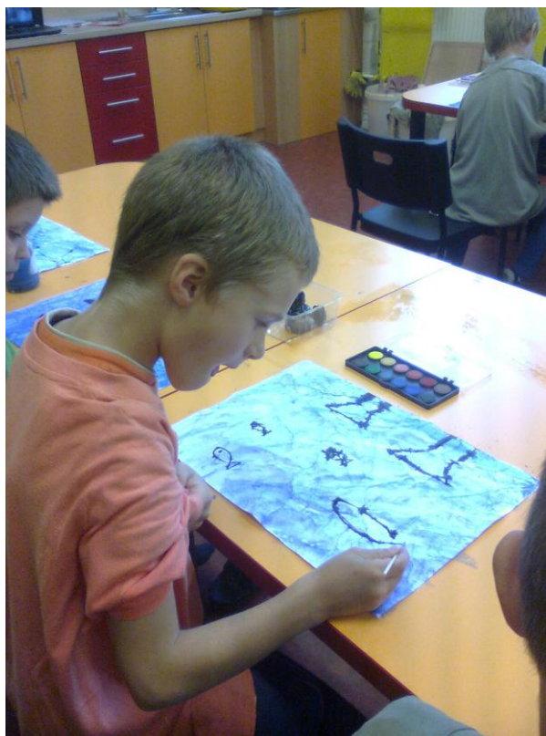
Fotografie č. 9