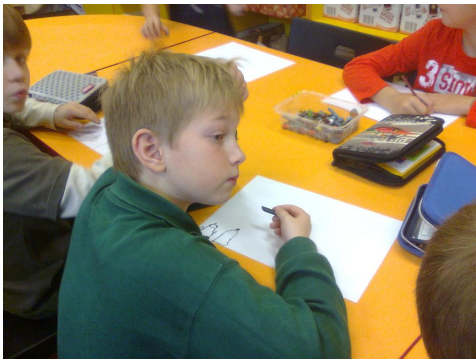
Fotografie č. 13