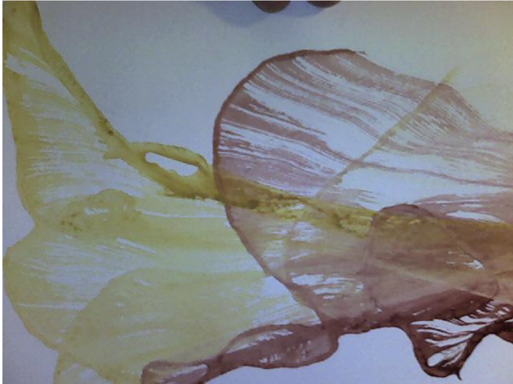
Fotografie č. 2