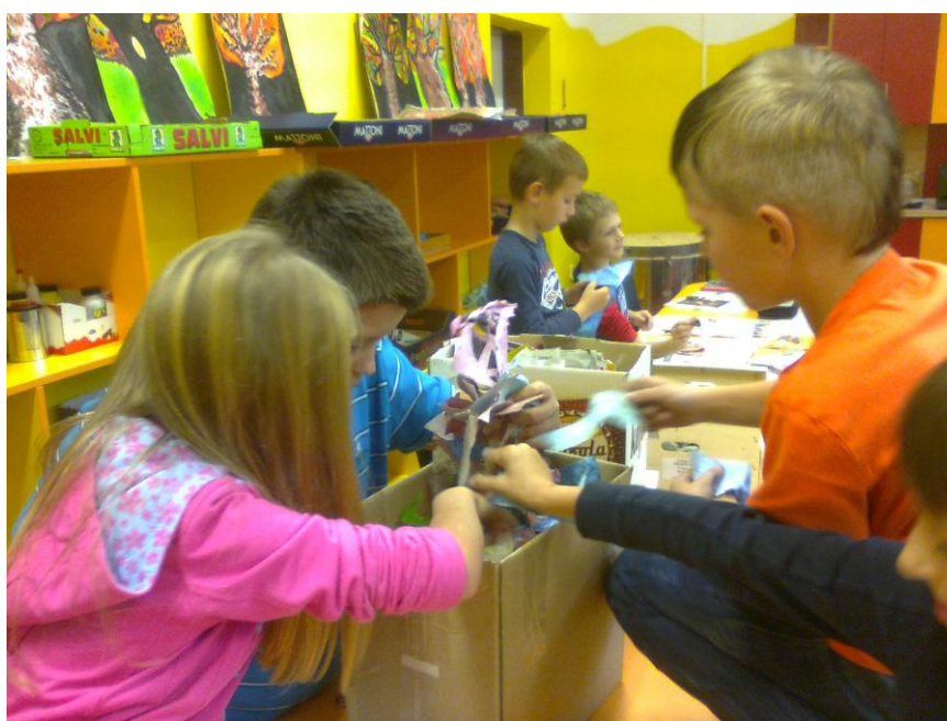
Fotografie č. 15