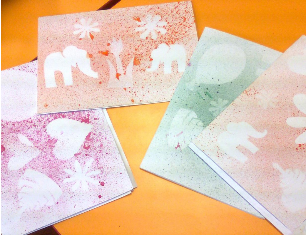
Fotografie č. 9