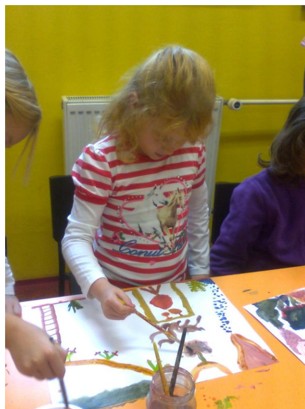
Fotografie č. 7