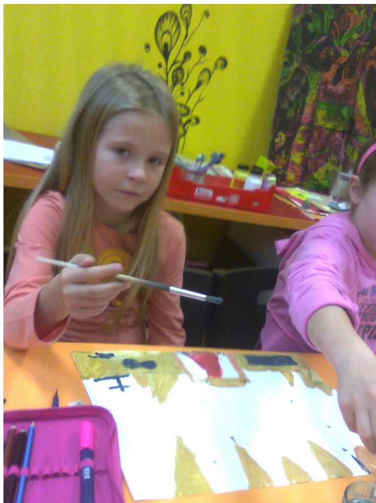
Fotografie č. 16