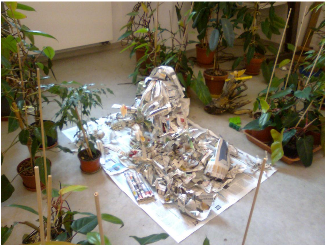
Fotografie č. 10

dostali pozvání k narozeninám a nakonec jsme se na pohádku podívali při úplňku.