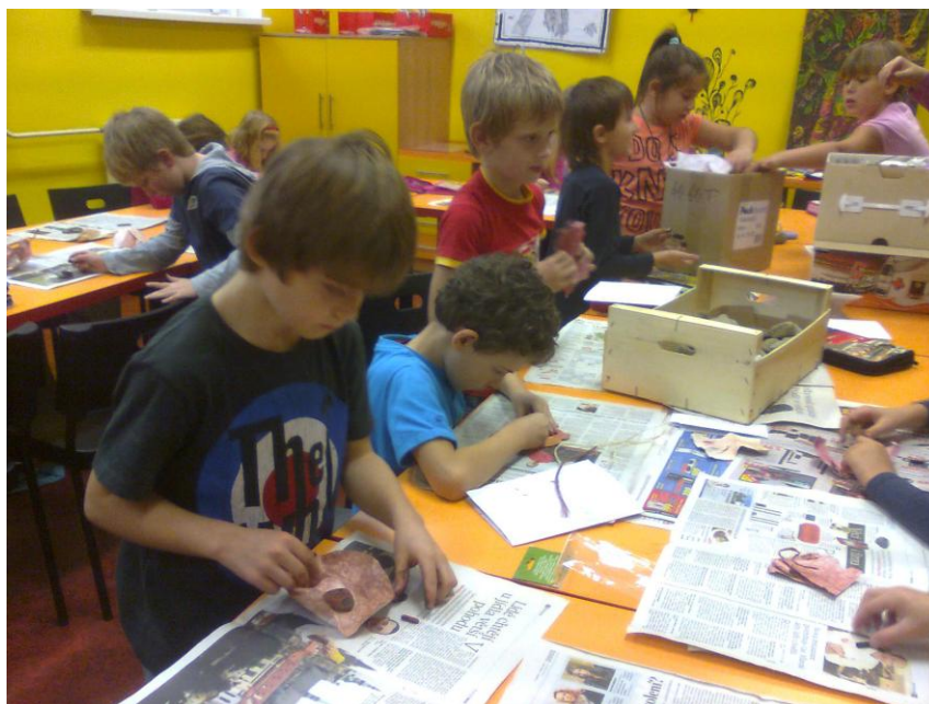
Fotografie č. 14