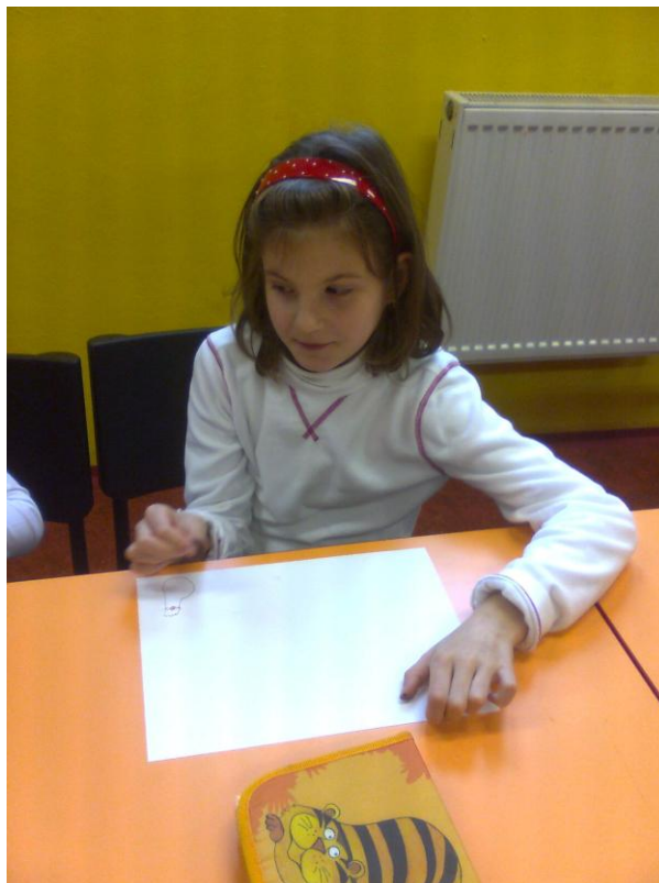
Fotografie č. 12