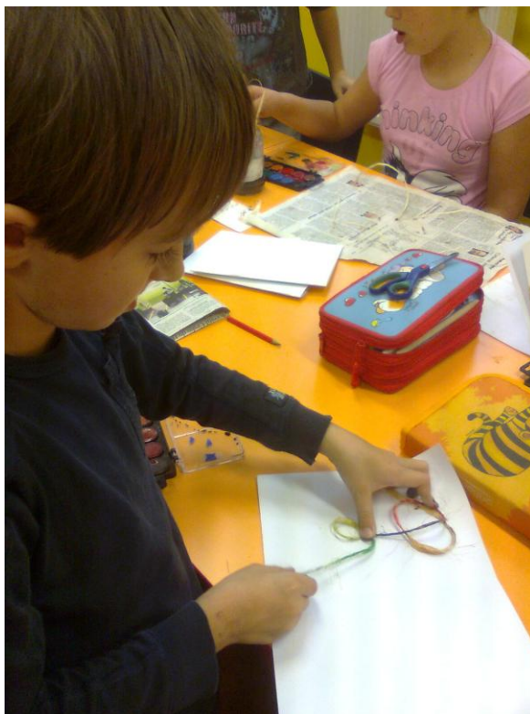
Fotografie č. 4