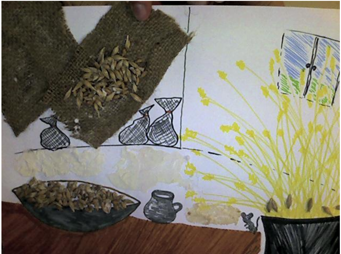
Fotografie č. 5

šikovně vystihli vnitřek mlýna. Dodělali detaily, přilepili mouku, zrní. Žákům se hodina výtvarné výchovy líbila. Byli velmi tvořiví a samostatní. Nová výtvarná technika pro ně měla zvláštní kouzlo. Na konci hodiny jsme si udělali relaxaci a zhodnotili naše výtvary.