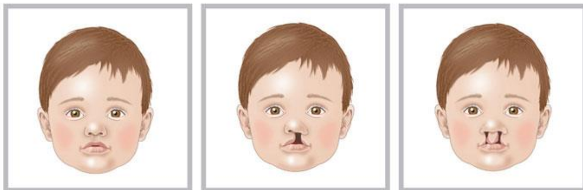
1. Normal lip

Rozštěp rtu (1. Obrázek zdravé rty, 2. Obrázek levostranný rozštěp rtu, 3. Obrázek oboustranný rozštěp rtu)