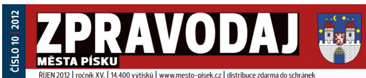
Obrázek č. 3: Současné logo Zpravodaje města Písku

Zpravodaj města Písku se od roku 2012 tiskne barevně. Tím dostává zcela jinou podobu. V horní části opět nalezneme logo Zpravodaje, které se tentokrát nachází na červeném pozadí s nápisem „Zpravodaj města Písku.“ V pravé části od nadpisu loga se nachází znak města Písku. Levá část loga obsahuje číslo a rok vydání. Ve spodní části loga nechybí měsíc vydání, rok, ročník, měsíční náklad, webové stránky města Písku a informace o distribuci zdarma do schráněk.