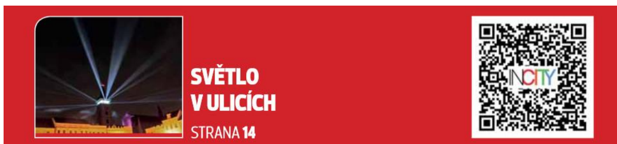
Obrázek č. 4: Doprovodné okénko k dalšímu článku ve Zpravodaji města Písku, zdroj: Město Písek. [online]. [cit. 2014-04-25]. Dostupné z: http://www.mesto-pisek.cz/soubory/dokument19550.pdf

Úvodní stránce dominuje obrázek nebo fotografie přítomné dané události. U obrázku stránky nesmí chybět popis události. Na obrázku nebo pod obrázkem se můžeme setkat s logy partnerů. Ve spodní části úvodní stránky se navíc nachází okénko, případně více okének s fotografií nebo obrázkem k dalšímu článku ve Zpravodaji. K okénku je vždy připojený nadpis a stránka ve Zpravodaji, na které daný článek najdeme.