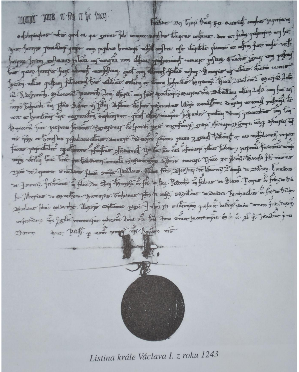
Listina krále Václava I. z roku 1243

Zdroj: PRÁŠEK Jiří. Písek 2. tisíciletí. 1.vyd., Písek, Nakladatelství J&M Písek, edice REGION, 2000, 221s., str. 16