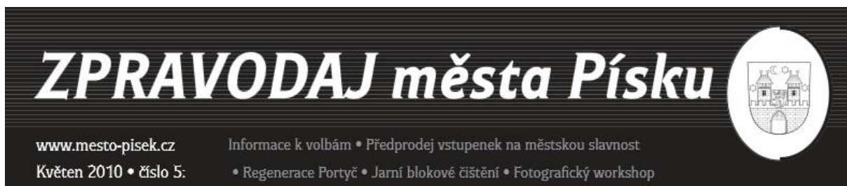
Obrázek č. 2: Logo Zpravodaje města Písku z roku 2010

Pod úvodním logem se nacházely články, které jsme si mohli přečíst v rychlém obsahu. Články byly psány velkými tiskacími písmeny a pod sebou zahrnovaly ještě tmavě šedé pozadí. Později byly psány černě, bez ohraničení a pozadí. Často jsme se pod úvodním logem mohli setkat s jedním až dvěma černobílými obrázky, které reprezentovaly daný článek. Pod obrázkem se nacházela stručná doplňující informace. Použití obrázků pod logo Zpravodaje nebylo vždy pravidlem. Celkový počet obrázků na celý Zpravodaj nebyl více jak tři kusy. Navíc jsme ve Zpravodaji nacházeli menší obrázky k danému článku, jako například pod článkem „ Ještě jednou k návrhu vyhlášky o pravidlech pro pohyb psů na veřejném prostranství “ ve Zpravodaji města Písku z února 2007 najdeme menší obrázek tří psů.