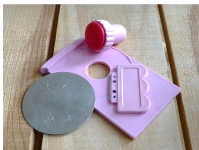
Obr. 2: Potřeby pro razítkování

Motiv je znázorněn na kovové destičce, přetře se lakem, stěrkou se setře přebytečný lak z okolí (lak zůstane jen v drážkách motivu) a pomocí gumového polštářku se motiv přenesou na nehet. Touto formou je možné provádět také francouzskou manikúru s ozdobným efektem.