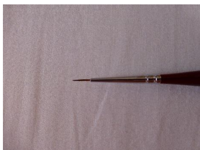
Obr. 6: Štětec pro silnější linky