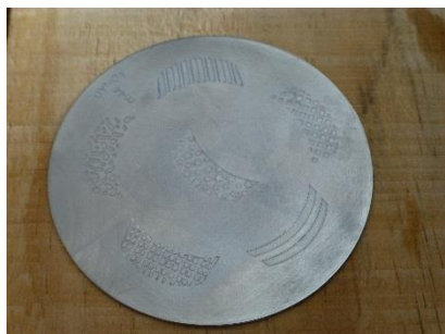
Obr. 4: Motivy „francie“