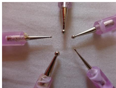
Obr. 5: Kuličky pro zdobení, různé typy