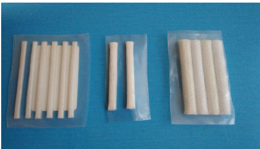
Obr. 1: Natáčky pro trvalou na řasy - různé velikosti

Pro trvalou na řasy sestavují výrobci kompletní sady, které obsahují: natáčky různých velikostí, lepidlo, trvalou ve formě gelu, ustalovač, případně odstraňovač natáček. Jednotlivé komponenty se většinou dají dokupovat i zvlášť. Dále potřebujeme pomerančové dřívko, tampony, odličovač očního okolí, vatové tyčinky, kartáček na řasy, u některých variant tenký proužek igelitu.