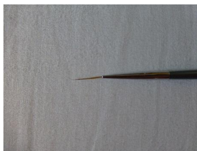
Obr. 7: „Jednochlupový“ štětec pro tenké linie