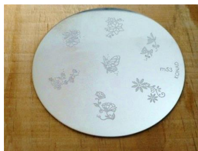
Obr. 3: Obrázkové motivy