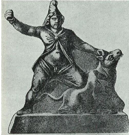
Fig. 2 – Mon. 11