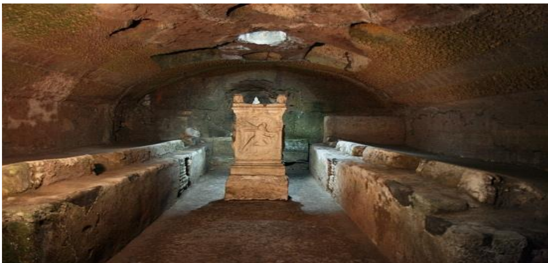
Obrázek 15+16, 17+18, 19