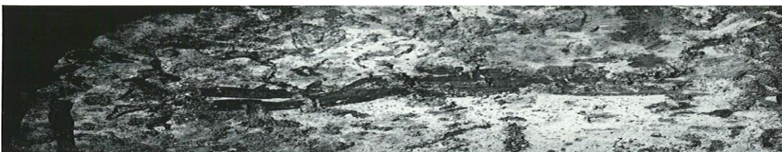
Fig. 60 - Mon. 193