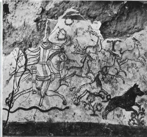
THE HUNTING SCENE FROM THE SIDE WALL OF THE MITHRÆUM