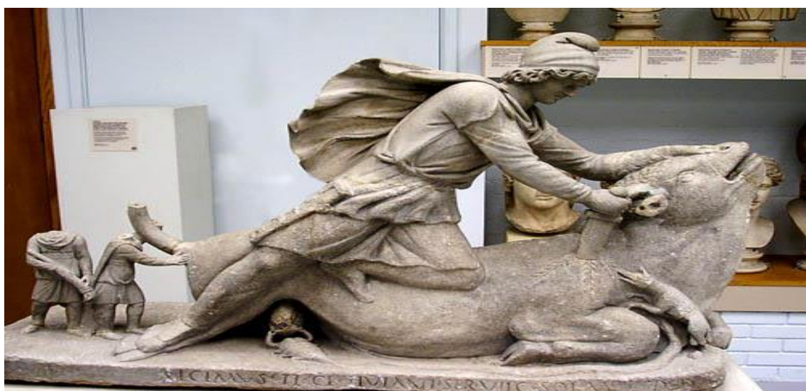
Obrázek 1, 2, 3