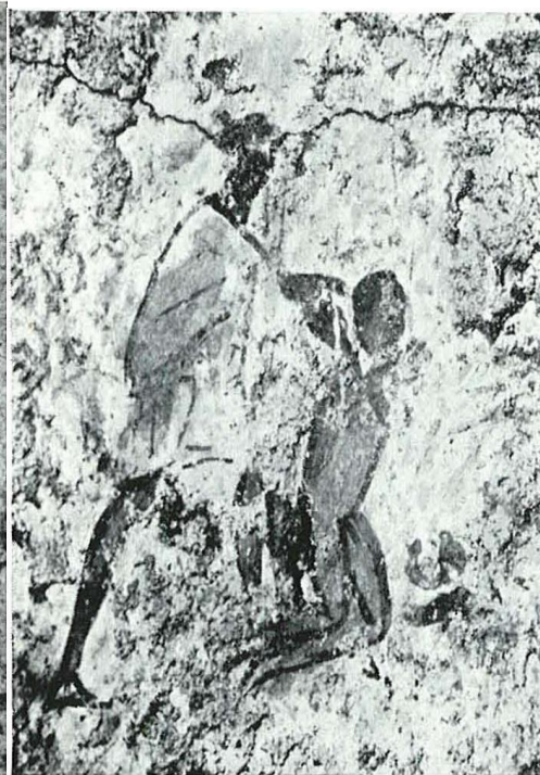
Fig. 61 - Mon. 194