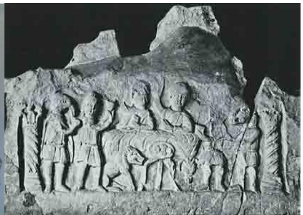
Obrázek 20 (2x), 21+22