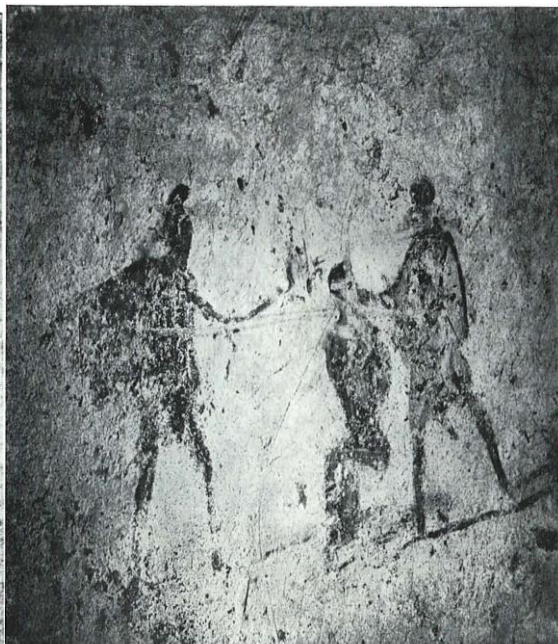
Fig. 58 - Mon. 188