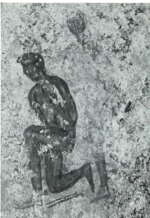
Fig. 59 - Mon. 191