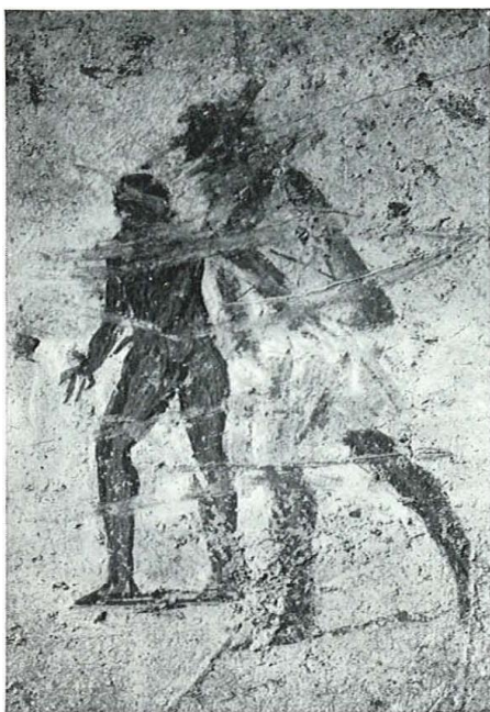
Fig. 57 - Mon. 187