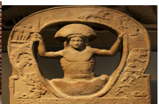
Obr.4+5, 6+7, 8+9