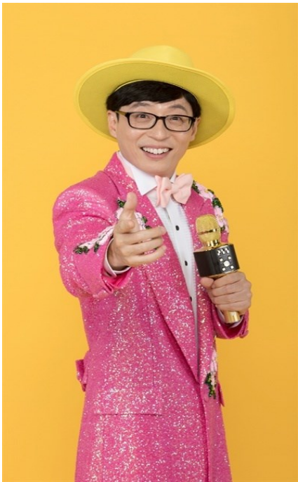
Obr. 6 – Komik a začínající trot zpěvák Yoo Jae Suk