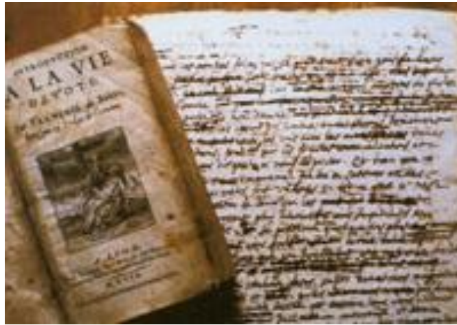
Príloha 6: Rukopis Návodu na nábožný život