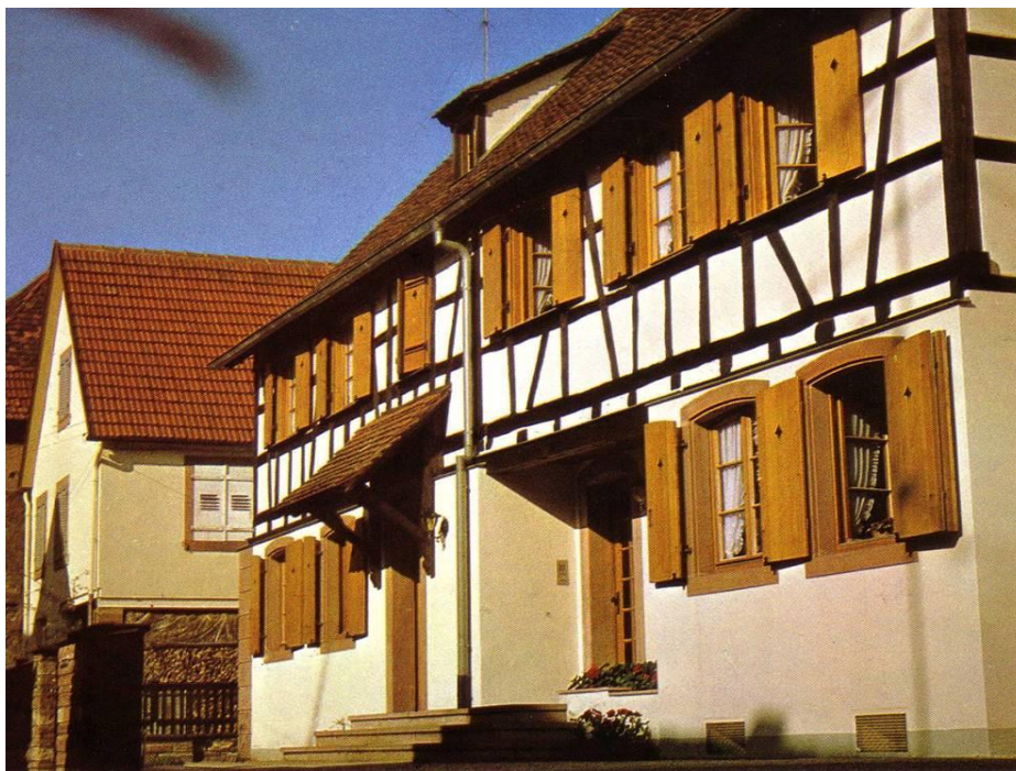
Príloha 9: Prvý kláštor, nazývaný „kláštorík“, kde sa Matka zakladateľka nasťahovala spolu s prvými sestrami