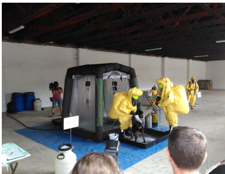
Obrázek č. 3 – Návčik dekontaminace

Zdroj: Cvičení Nákaza 2017. SSHR [online]. [cit. 2022-01-31]. Dostupné z: https://www.sshr.cz/aktuality/cviceni-nakaza-2017/ .