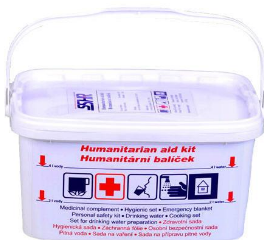
Obrázek č. 2 – Humanitární balíček

Zdroj: Humanitární balíček. Allbiz [online]. [cit. 2022-01-29]. Dostupné z: https://cz.all.biz/humanitarni-balicek-g46757 .