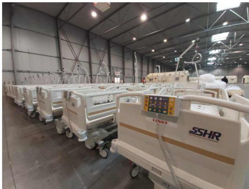
Obrázek č. 5 – Zdravotnická lůžka v polní nemocnici