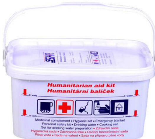
Obrázek č. 2 – Humanitární balíček