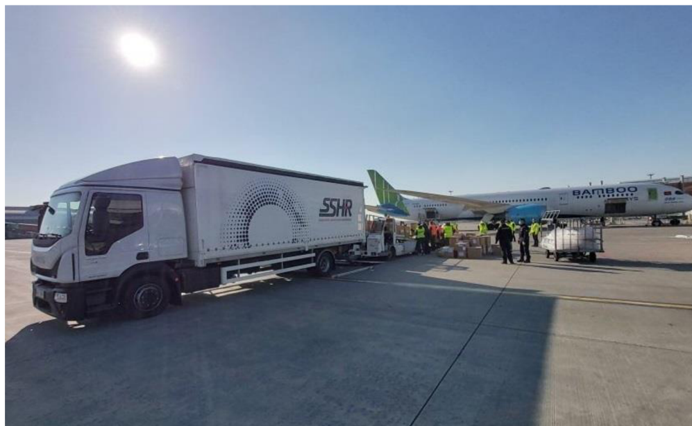
Obrázek č. 4 – Nákladní auto Správy státních hmotných rezerv