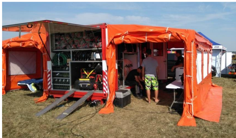
Obrázek č. 6 – Kontejner nouzového přežití