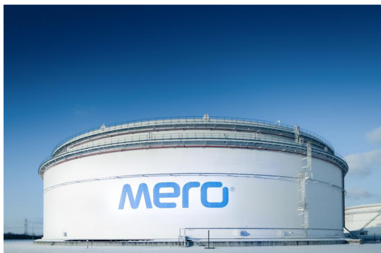
Obrázek č. 1 – Centrální tankoviště ropy