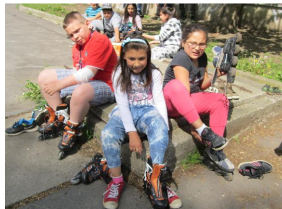
Obrázek č. 10