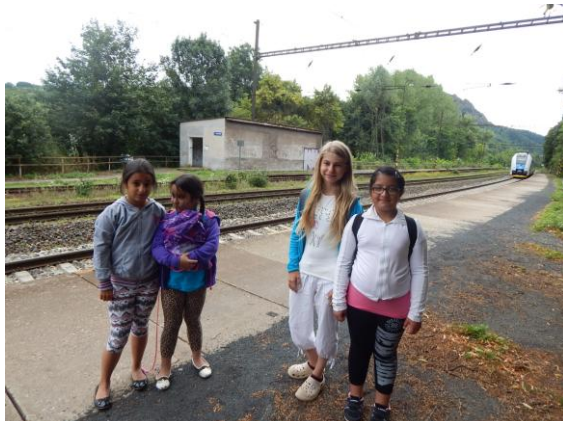
Obrázek č. 9