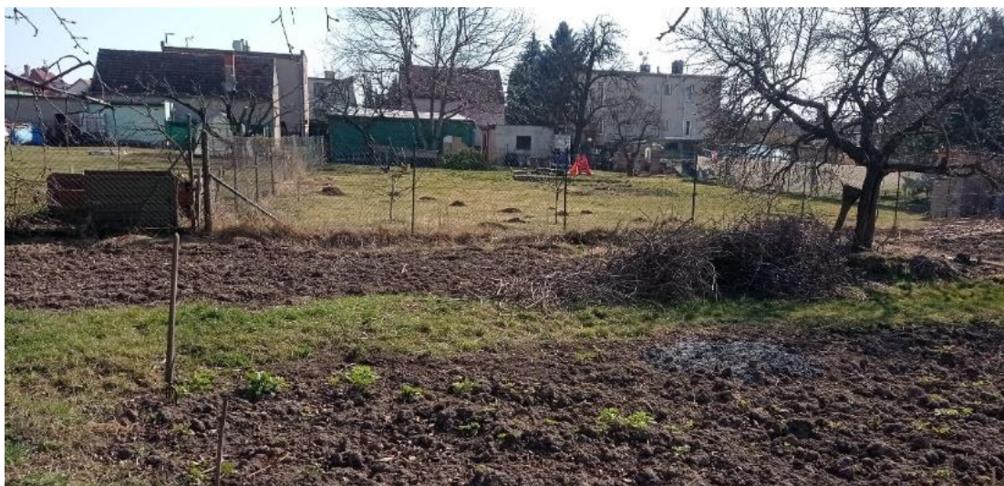
Obr. 3: Zahrádkářská osada Medlešice

První kategorií je kategorie osad venkovského charakteru. Do této kategorie byly zařazeny dvě osady. Osada v Medlešicích a osada v Markovicích. Osady jsou charakteristické tím, že se v nich nachází mnoho rodinných domů, u kterých jsou vidět komposty, nádrže na zachytávání dešťové vody, ale i studny. Obytný charakter je u těchto osad výraznější než u jiných. Lidé v těchto osadách trvale bydlí, chaty se zde vyskytují pouze výjimečně. Na obě osady z jedné strany navazuje zástavba, z druhé orná půda. Téměř na každé zahradě lze najít skleníky. Obyvatelé těchto osad tu chovají i drobnější hospodářská zvířata, v osadě v Markovicích i koně. Před domy mají lidé v mnoha případech okrasné zahrady, a jak je patrné i z Obr. 3, za domy se nachází zahrady, na kterých jsou jak záhony, tak i mnoho ovocných stromů. Ale i v těchto osadách jsou záhony mnohdy zmenšeny a zahrady pouze zatravněny. Rovněž se v některých zahradách společně se záhony, nacházejí i bazény nebo trampolíny.