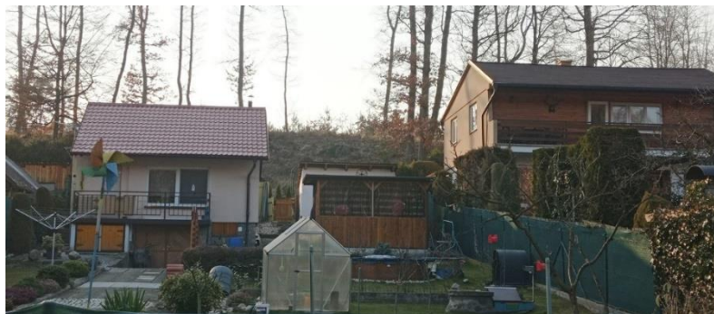
Obr. 6: Chaty v osadě Podhůra

Podhůra se nachází u Městských lesů Chrudim, které jsou využívány pro rekreaci. Na první pohled v zahradách zaujme velký počet kompostů, nádrží a sudů na zachytávání dešťové vody. Jak je patrné z Obr. 6, téměř na každé zahradě je postavena chata nebo jiný objekt, který svým vzhledem může připomínat rodinný dům, ale lidé v nich, přestože by mohly tyto stavby sloužit k trvalému bydlení, ve většině případech nebydlí. Zahrady zde mají někteří uživatelé zahrad i ve vlastnictví. Důkazem toho, že sousedské vztahy nejsou takové jako v minulosti, a že vztahy mezi lidmi nejsou v této osadě velmi dobré, nasvědčují i ploty některých zahrad, zakryté sítěmi, plachtami nebo jsou kolem nich vysázené keře, aby do zahrad nebylo vidět. Osada se řadí se mezi jednu z největších, nacházejících se v Chrudimi.