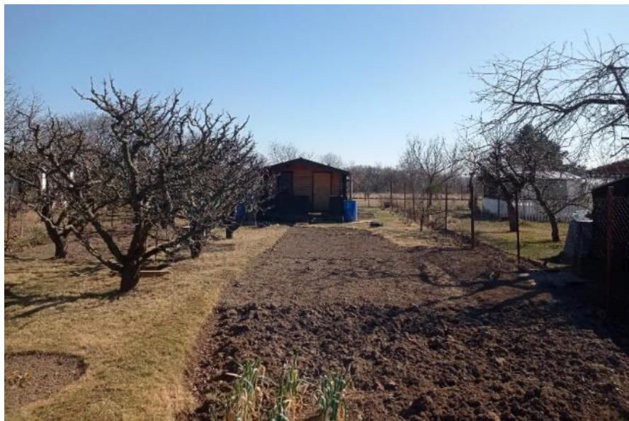
Obr. 10: Zahrádkářská osada Škroupova

Do poslední kategorie spadá kategorie osad s převažujícím produkčním charakterem. Do ní byly zařazeny osady Topol a Škroupova. Za společné znaky těchto dvou osad lze považovat převažující produkční charakter a velikost, protože se jedná o nejmenší osady. Jednu ze zahrad v osadě Škroupova lze vidět na Obr. 10. V osadách se nevyskytují žádné rodinné domy a lidé v těchto osadách ani nebydlí. U obou osad je důvodem jejich lokalizace. Osada Topol navazuje na zástavbu a je umístěna podél silnice a orné půdy. Nachází se v jedné z místních částí Chrudimi a lidé vlastníci zahrady je mají v těsné blízkosti svých domů. Osada Škroupova je umístěna v bezprostřední blízkosti hřbitova a závodu na výrobu střešních krytin. Zahrady tu mají zejména starší lidé, protože pro mladé lidi a zejména pro rodiny s dětmi nemusí být tato osada, z důvodu jejího umístění, příliš atraktivní.