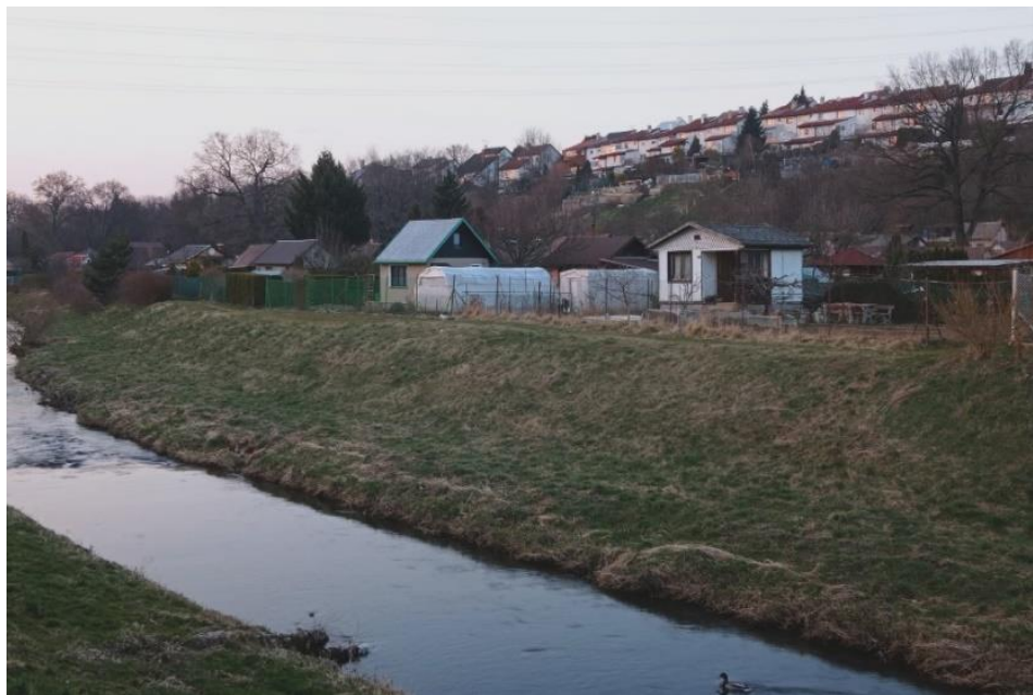
Obr. 9: Pohled na zahrádkářskou osadu Bělidlo