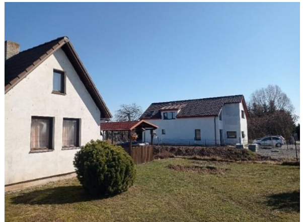
Obr. 8: Rodinné domy v osadě Jordánek