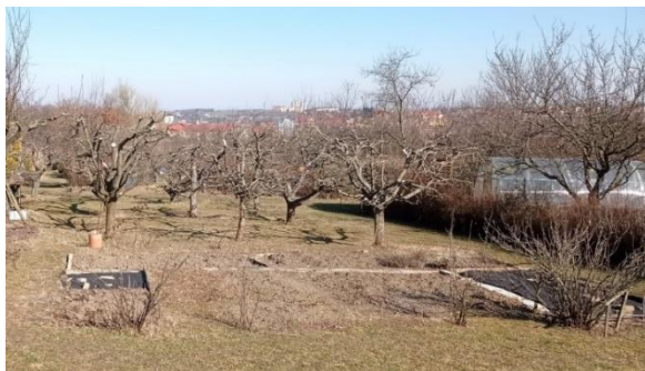
Obr. 4: Zahrada v zahrádkářské osadě Na Vyhliídce s produkčním charakterem

Osada, zvaná Na Vyhliídce, se oproti okolí nachází na vyvýšeném místě, dál od ruchu města. Je z ní rozhled na město. Je vklíněna mezi lesní porost a ornou plochu a je oplocená, takže se nedělí na menší pozemky. Zahrady mají uživatelé v pronájmu od městského úřadu. Osadu lze pomyslně rozdělit na dvě části. První část, zobrazena na Obr. 4, plní produkční funkci. Zahrady v této část mají v pronájmu spíše starší lidé. V druhé části, zachycené na Obr. 5, jsou nájemci povětšinou mladší lidé nebo rodiny s dětmi, kteří využívají zahrady hlavně k rekreaci. V této osadě dochází k minimální výstavbě rodinných domů, uživatelé zahrad si zde staví spíše chaty.