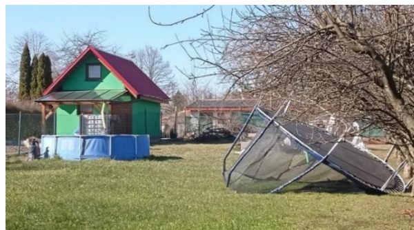
Obr. 5: Zahrada v zahrádkářské osadě Na Vyhliídce s rekreačním charakterem

Podhůra se nachází u Městských lesů Chrudim, které jsou využívány pro rekreaci. Na první pohled v zahradách zaujme velký počet kompostů, nádrží a sudů na zachytávání dešťové vody. Jak je patrné z Obr. 6, téměř na každé zahradě je postavena chata nebo jiný objekt, který svým vzhledem může připomínat rodinný dům, ale lidé v nich, přestože by mohly tyto stavby sloužit k trvalému bydlení, ve většině případech nebydlí. Zahrady zde mají někteří uživatelé zahrad i ve vlastnictví. Důkazem toho, že sousedské vztahy nejsou takové jako v minulosti, a že vztahy mezi lidmi nejsou v této osadě velmi dobré, nasvědčují i ploty některých zahrad, zakryté sítěmi, plachtami nebo jsou kolem nich vysázené keře, aby do zahrad nebylo vidět. Osada se řadí se mezi jednu z největších, nacházejících se v Chrudimi.