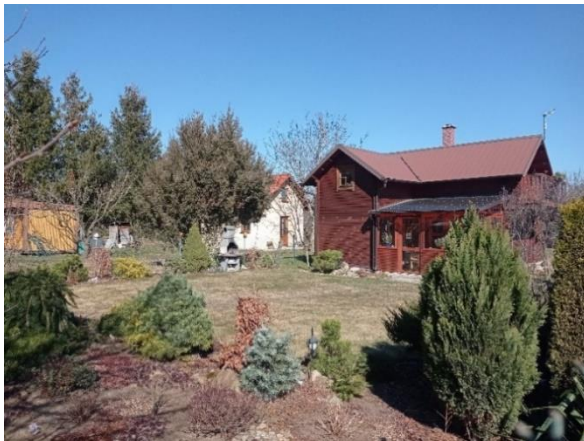
Obr. 7: Zahrádkářská osada Jordánek

Do kategorie osad s prolínajícím se charakterem produkčním, rekreačním i obytným, byly zařazeny tři osady, a to osada Bělidlo, Jordánek a Píšťovy. Jak lze vidět na Obr. 7 a Obr. 8, tyto osady plní funkci jak produkční, rekreační, tak i obytnou. Vyskytují se v nich hlavně chaty, ale rovněž i rodinné domy. Každá osada má ale v rámci města jiné postavení. Osada Jordánek je situována v blízkosti chrudimského letiště a je z velké části obklopena ornou půdou a Píšťovy jsou umístěny na samém okraji katastrálního území Chrudimi. Rovněž jsou obklopeny ornou půdou. Osada Bělidlo, zobrazená na Obr. 9, je izolovaná od ruchu města řekou Chrudimkou, která teče podél ní. Osada je vhodně včleněna do městského prostoru. V minulosti patřila pod Územní sdružení Českého zahrádkářského svazu Chrudim.