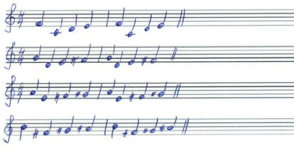
Obrázek 6: Notový záznam k hlasovému cvičení „cupy, dupy“