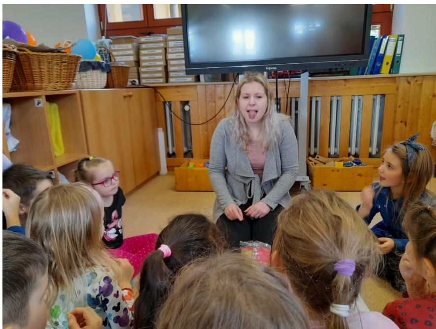
Obrázek 10: Hra s burizony