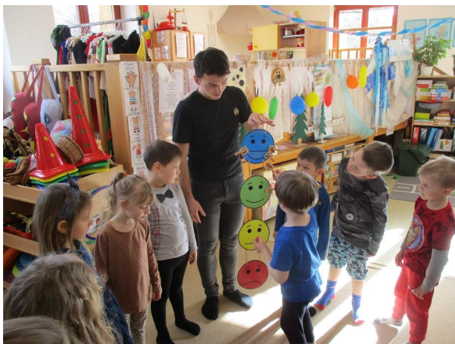
Obrázek 11: Hodnocení aktivit