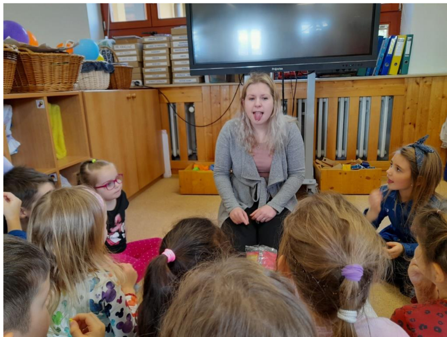
Obrázek 10: Hra s burizony