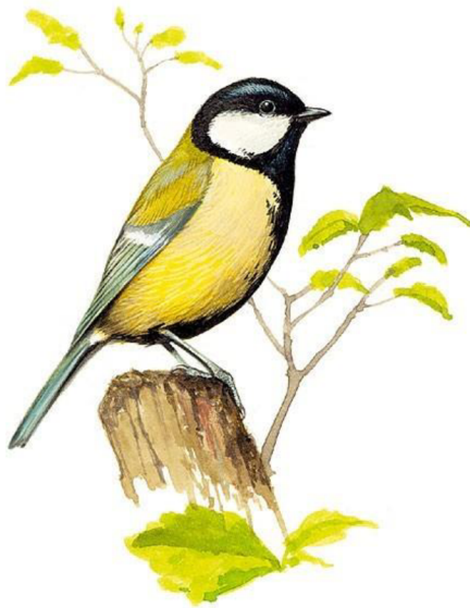
Obrázek 3: Sýkora koňadra