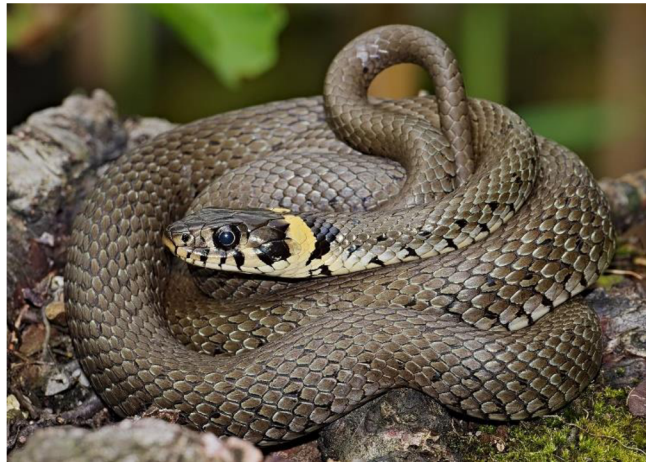
Obrázek 4: Užovka obojková