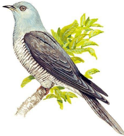
Obrázek 1: Kukačka obecná