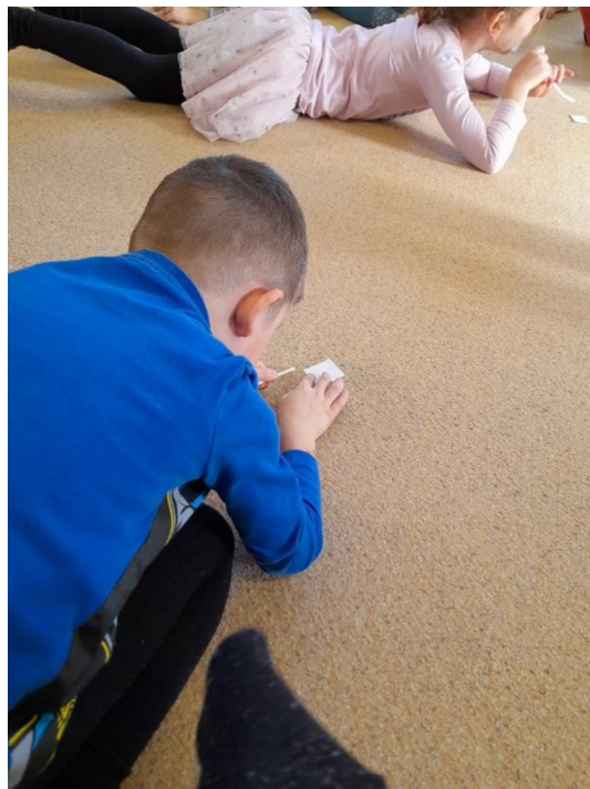
Obrázek 8: Foukej brčkem do vločky