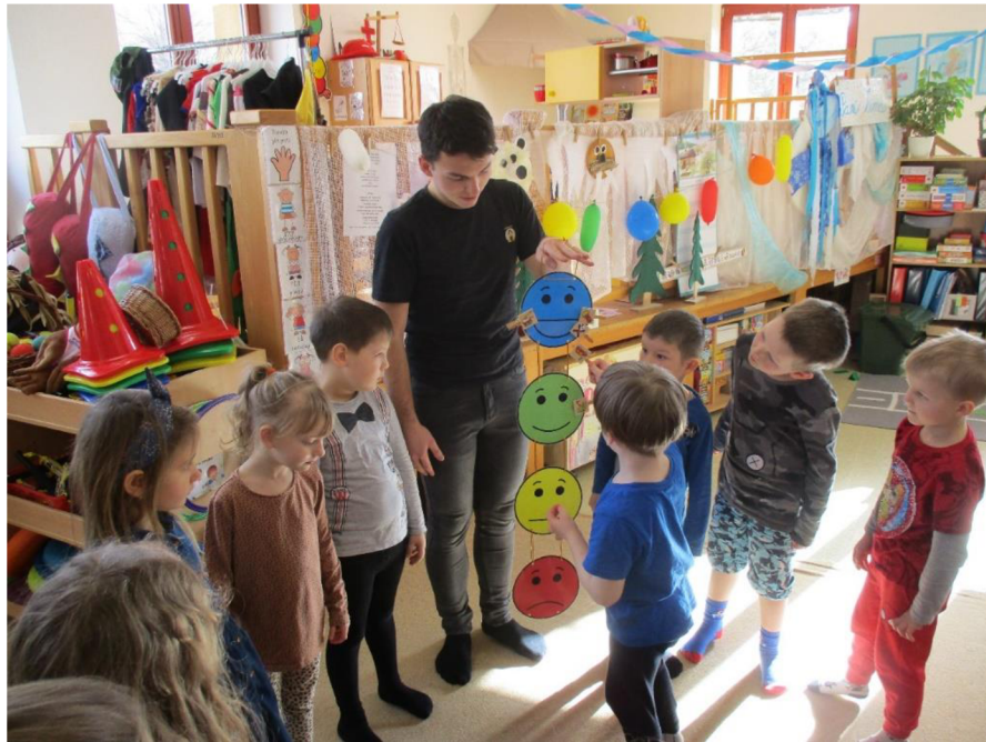
Obrázek 11: Hodnocení aktivit