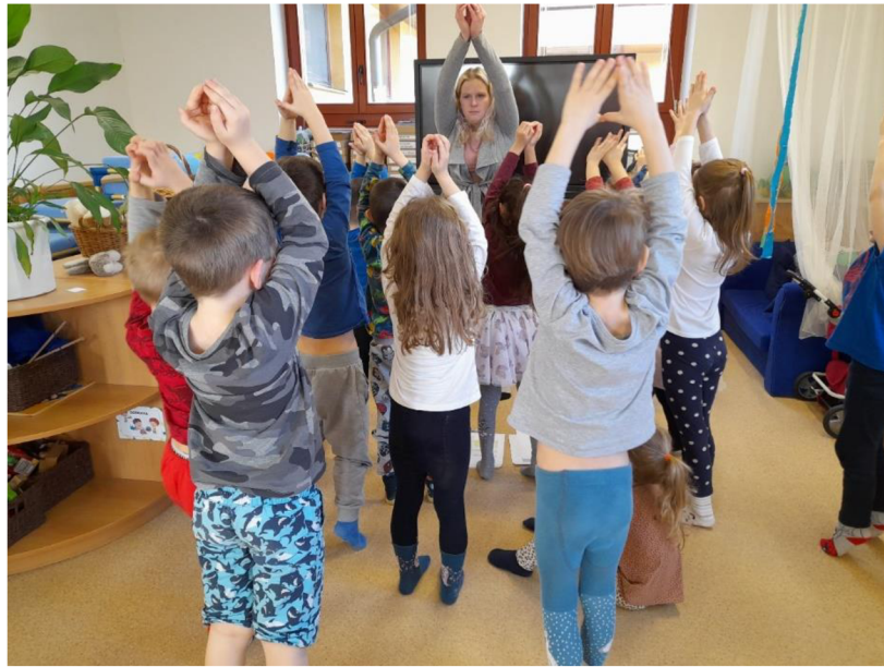
Obrázek 9: Sluníčka na obloze