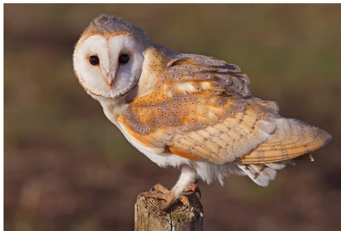
Obrázek 2: Sova pálená