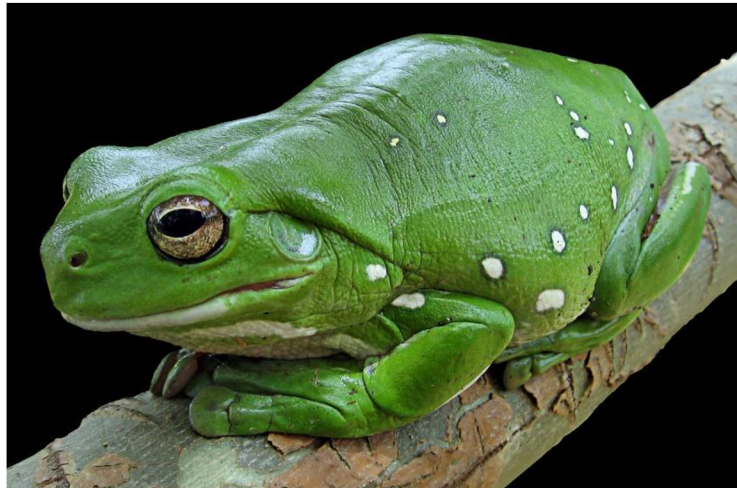
Obrázek 5: Rosnice silná