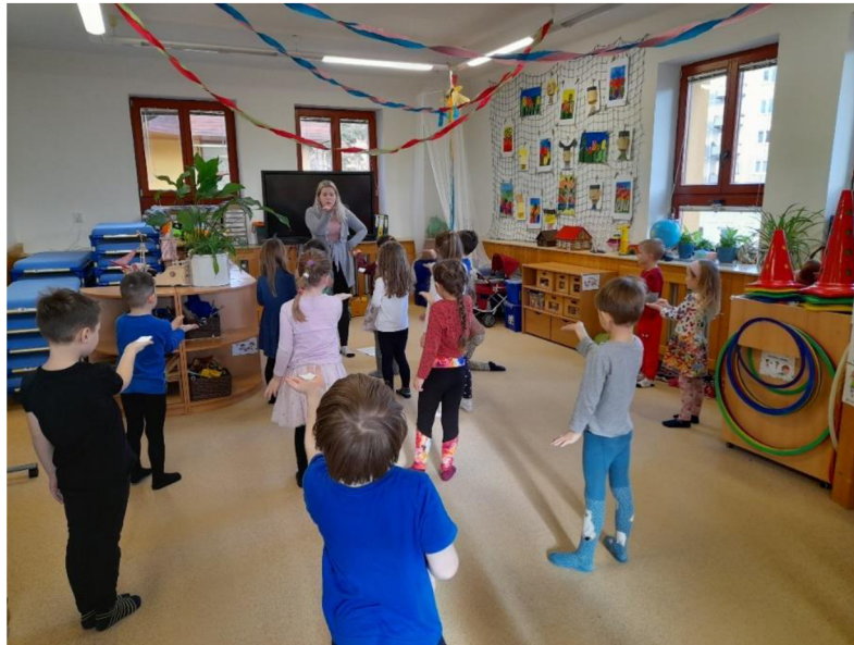
Obrázek 7: Sfoukni vločku