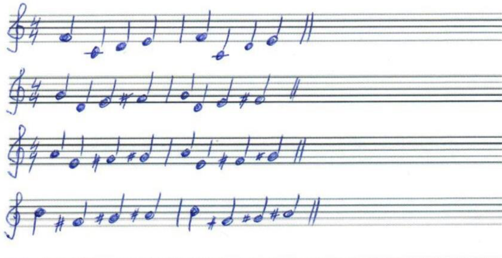
Obrázek 6: Notový záznam k hlasovému cvičení „cupy, dupy“