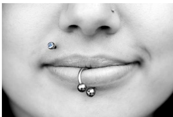
Obrázek č. 8 13

Fiksa (2005) definuje piercing jako: „Činnost, při které je zaváděn předmět, většinou šperk z různých materiálů do tkáně.“