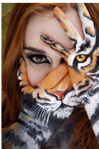
Obrázek č. 5 10