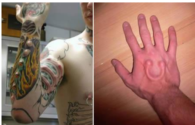
Obrázek č. 4 8