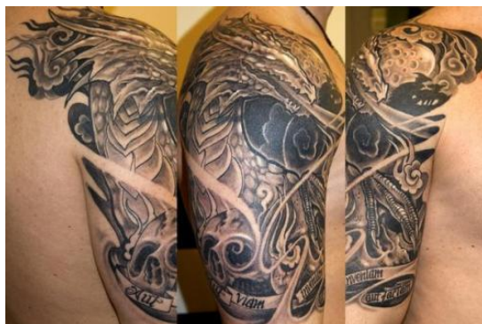
Obrázek č. 9 15