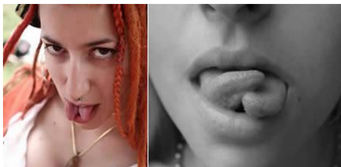
Obrázek č. 7 12