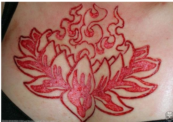
Obrázek č. 2 5