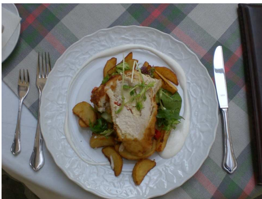
Obrázok č. 18 Ludvika