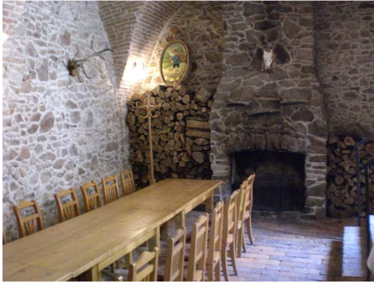
Obrázok č. 4 Hotel Sebastian