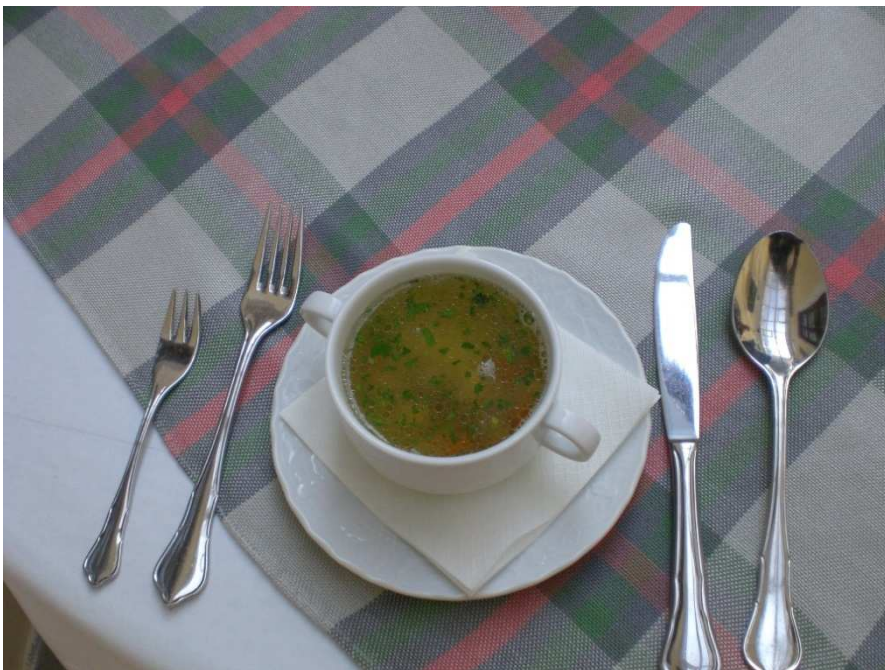
Obrázok č. 15 U Ludvika