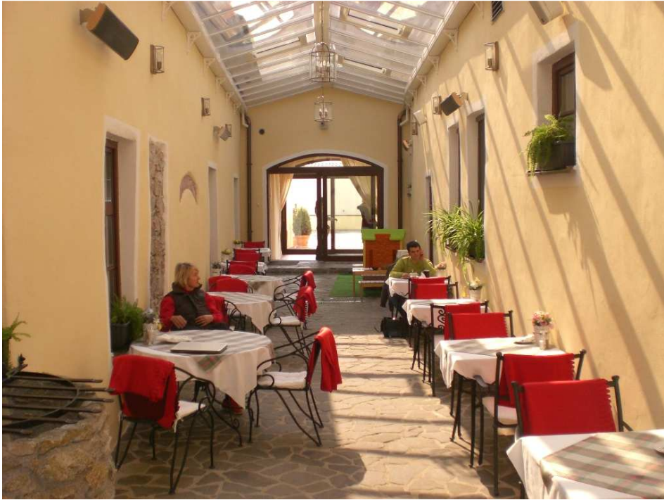
Obrázok č. 14 U Ludvika