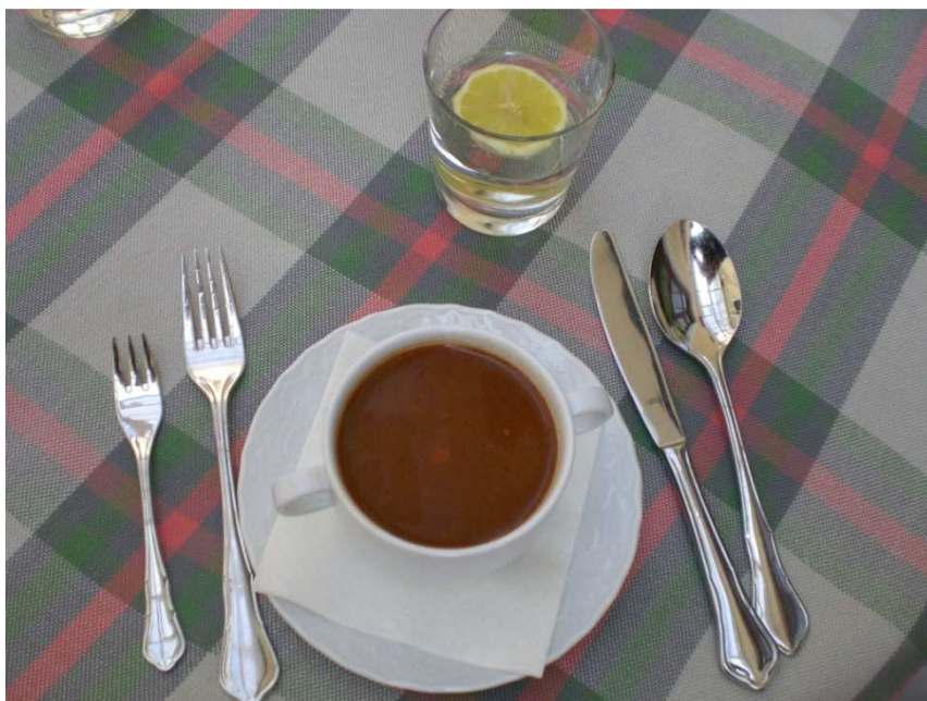
Obrázok č. 17 U Ludvika