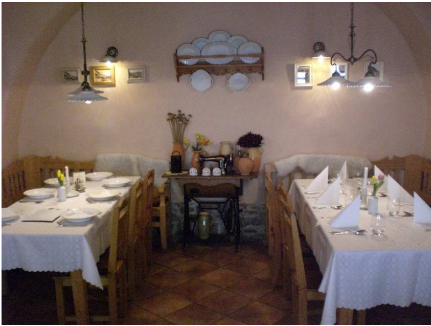
Obrázok č. 11 U Ludvika