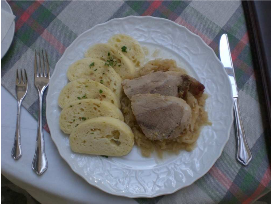
Obrázok č. 19 U Ludvika