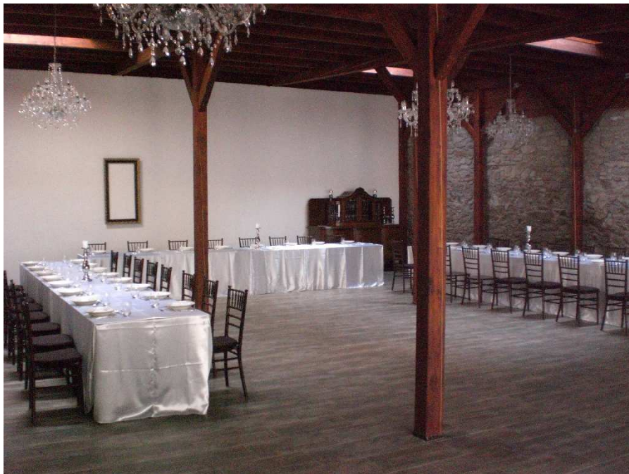
Obrázok č 5. Hotel Sebastian