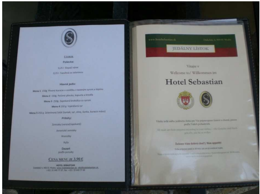
Obrázok č. 10