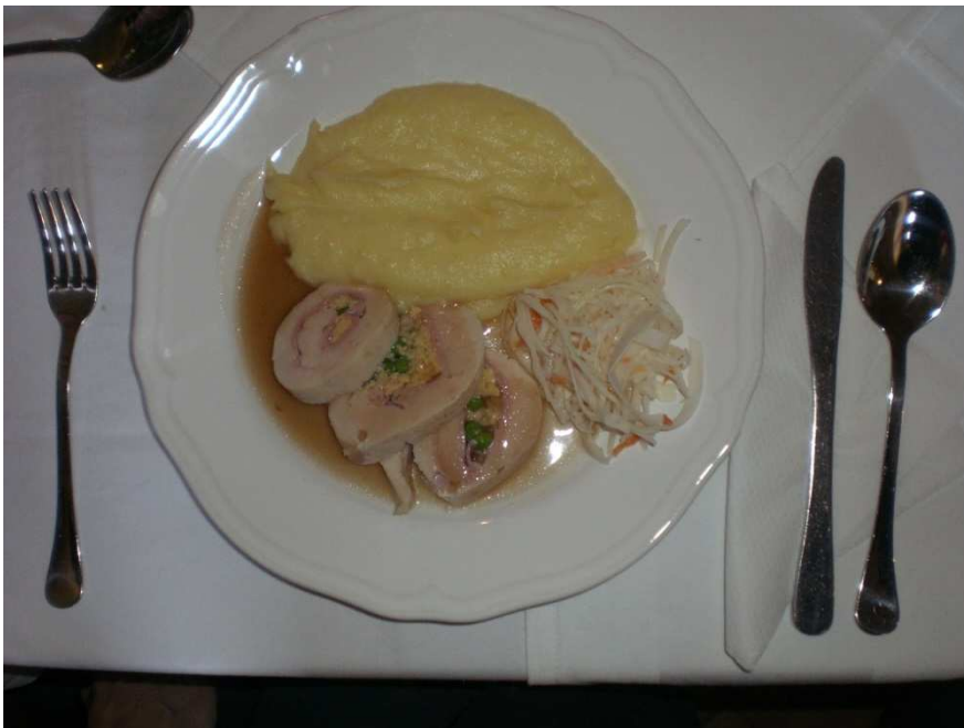
Obrázok č. 9 Hotel Sebastian