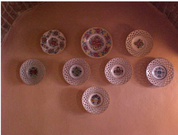
Obrázok č.2 Hotel Sebastian