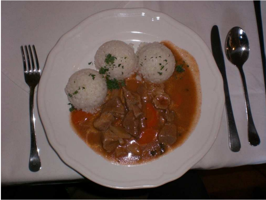
Obrázok č 8. Hotel Sebastain