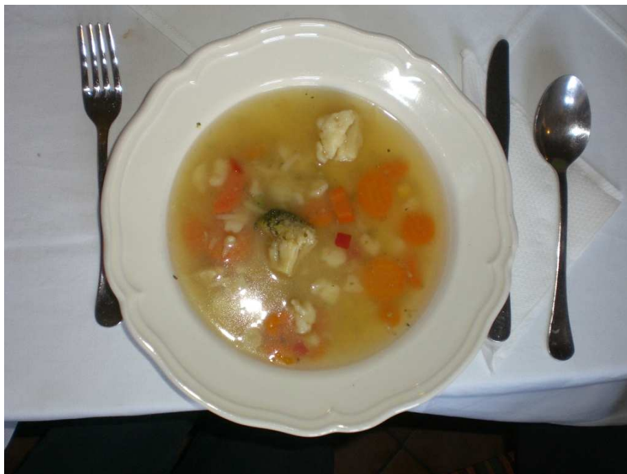
Obrázok č 7. Hotel