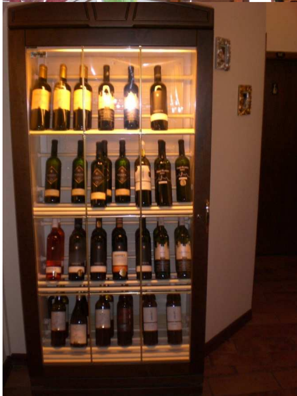
Obrázok č. 13 U Ludvika