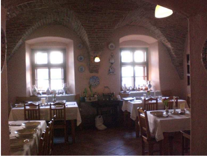
Obrázok č. 1 Hotel Sebastian

Všetky obrázky okrem organizačnej štruktúry, ktoré boli použité v práci sú produkované mojou osobou v reštauráciach a v gastronomických zaradeniach v meste Modra.