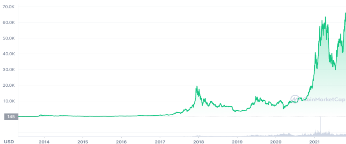
Obrázek 1- Vývoj ceny Bitcoinu v USD 11 .

stoupáním, ale i navzdory fluktuaci bylo dosaženo nové nejvyšší hodnoty 66 974,77 USD 20.10.2021.