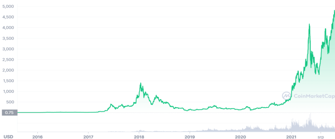
Obrázek 2 - Vývoj ceny Etheru v USD 12 .

Pro ověření transakce využívá Ethereum stejně jako Bitcoin PoW model. Na rozdíl od Bitcoinu dostává aktualizace které se implementují přechodem většiny na nový software (hard fork). Díky přechodu je možné také odvrátit odcizení Etheru, pokud se na tom shodné většina uzlů. Jestli k jednoznačné shodě nedojde, může dojít k trvalému rozdělení blockchainu. V roce 2016 došlo ke krádeži 50 000 000 USD 13 od decentralizované autonomní organizace (DAO), kvůli které se rozdělil blockchain na Ethereum a Ethereum Classic, kde prostředky nebyly vráceny původnímu majiteli.