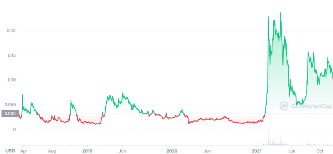
Obrázek 3 - Vývoj ceny Ravencoin v USD 15 .

Jelikož byla zjištěna přítomnost ASIC minerů v síti, Ravencoin 6.5.2020 přešel na vylepšený algoritmus KawPoW 17 . Vývojářský tým počítá s dalšími úpravami algoritmu, když dojde k opakovanému prolomení.