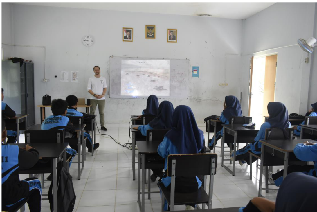
Obrázek 4: Výuka o ohrožení želv na ostrově Maratua, Indonésie, 2024

Při další přípravě projektu bych měl zvolit při zadávání projektu větší autonomii, tak aby žáci mohli více ovlivnit téma a rozsah projektu. Tento projekt byl velmi řízený. Sám jsem projekt detailně připravoval bez účasti žáků, pak se snažil žáky motivovat, ale tímto jsem z něho udělal vlastní projekt, což je obvyklý přístup pedagogů k projektu (Pouchová, 2010). Z výzkumu na 180 základních školách, kde realizovali celkem 642 projektů, vymýšleli jen 9 % z nich sami žáci (Pouchová, 2010). Myslím si, že právě tyto projekty mohou být pro žáky nejcennější. Při příští aplikaci tohoto projektu do výuky bych rád začal brainstormingem. Zapisoval bych nápady žáků na tabuli. Poté bych rád přistoupil ke společné diskuzi nad tvorbou formuláře na fytoocenologický snímek, aby si ho žáci připravili samostatně. Pomocí různých zdrojů bychom mohli vyhledat informace, které jsou vhodné u fytoocenologického snímku zaznamenat. V dnešním světě, kde jsou žáci vystaveni mnoha informacím i zkušenostem, může být právě cenné naučit je odpovědnému rozhodování, jednání, spolupráci a správnému postoji ke své osobnosti (Pouchová, 2010), na což právě tyto projekty mohou být vhodným nástrojem.