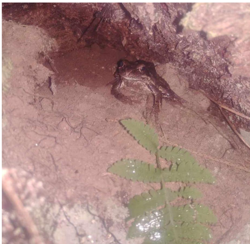
Obrázek 3: Stromové mikrostanoviště

U starých stromů se vlivem stáří vytvoří různá mikrostanoviště, která mají významný vliv na podporu lokální biodiverzity. Čím je strom starší, je větší pravděpodobnost, že se u stromu mikrostanoviště, na které jsou vázané další druhy, vyvine. V dutině stromů mohou hnízdit netopýři, svůj vývoj zde mohou uskutečnit zákonem chránění brouci, jako je například tesařík alpský nebo roháč obecný. V patě stromů se mohou vytvořit dutiny, ve kterých žijí obojživelníci. V korunách stromů si mohou vytvořit hnízdo ptáci. Tyto stromy jsou následně cenné pro přírodu a má smysl je v krajině zachovat. Pomocí aplikace lesobiodiverzita ( www.lesodiverzita.cz ), kterou vyvinula Katedra ekologie lesa na České zemědělské univerzitě, je možné právě tyto cenné stromy zaznamenávat. Metodika zaznamenávání je lehká, avšak pedagog by si měl prostudovat základní metodiku určování mikrostanovišť, podle které vznikla tato česká verze (Larrieu, 2018).