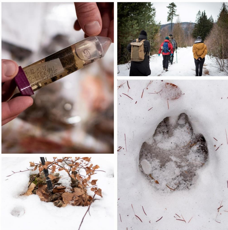
Obrázek 2: Vlčí hlídka, monitoring pobytových známek

Velmi oblíbené mezi občanskou společností jsou také vlčí hlídky, pořádané dobrovolníky z neziskové organizace Hnutí Duha. Většinou se jedná o víkendové akce v zimních měsících, kde se sbírá trus velkých šelem (vlk obecný, medvěd hnědý a rys obecný), který se zasílá na genetické rozbory. Po domluvě by mohla být realizována i exkurze v laboratoři, kde analyzují trus a chlupy pomocí genetických metod. Výsledky genetického výzkumu by mohly být odborníky prezentovány právě v období, kdy se v biologii probírají základy genetiky. Při samotné vlčí hlídce by bylo vhodné zařadit přednášku na téma významu vlka obecného pro přírodu, ale také jeho konflikt s člověkem (především chovateli ovcí a skotu). Vlčí hlídku jsme společně uspořádali s organizací SOVA (Studentská Organizace Vědeckých Aktivit) a již zmíněného spolku NaŽivo v CHKO Broumovsko, kde jsme sbírali pobytové známky velkých šelem.