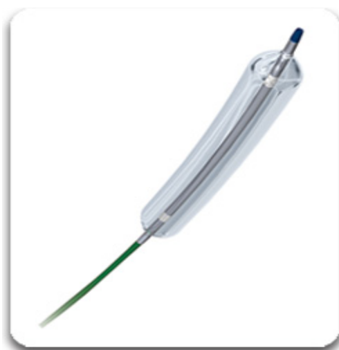
Obrázek 2. Balónkový dilatační katétr

Perkutánní transluminální angioplastika dále jen PTA je intervenční metoda, která se využívá při rekanalizaci stenotické nebo úplně uzavřené tepny v důsledku aterosklerózy. PTA se provádí pomocí speciálního balónkového katétru. Speciální balónkový katétr je vyobrazen na Obrázku 2. Výsledkem je navrácení lumenu cévy do fyziologického průměru. Roztažením katérového balónku dochází k trhlinám v intimě a mikrotrhlinám na medii. Hlavním principem PTA je tedy „předilatování“ medie a částečně i adventicie (zevní vrstva). (Krajina & Peregrin, 2005)