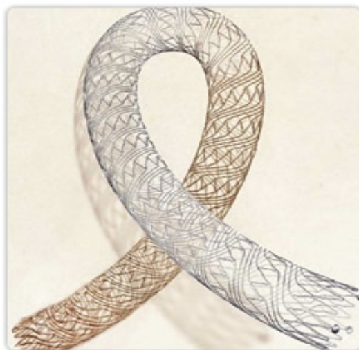
Obrázek 3. SMART® Flex stent

Zdroj: (Self-expandibilní stenty: SMART® Flex stent, 2013)