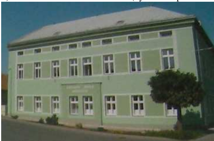
Zdroj: NOVOTNÝ, Pavel: Skuteč: známá - neznámá . Skuteč 2006. s. 35.