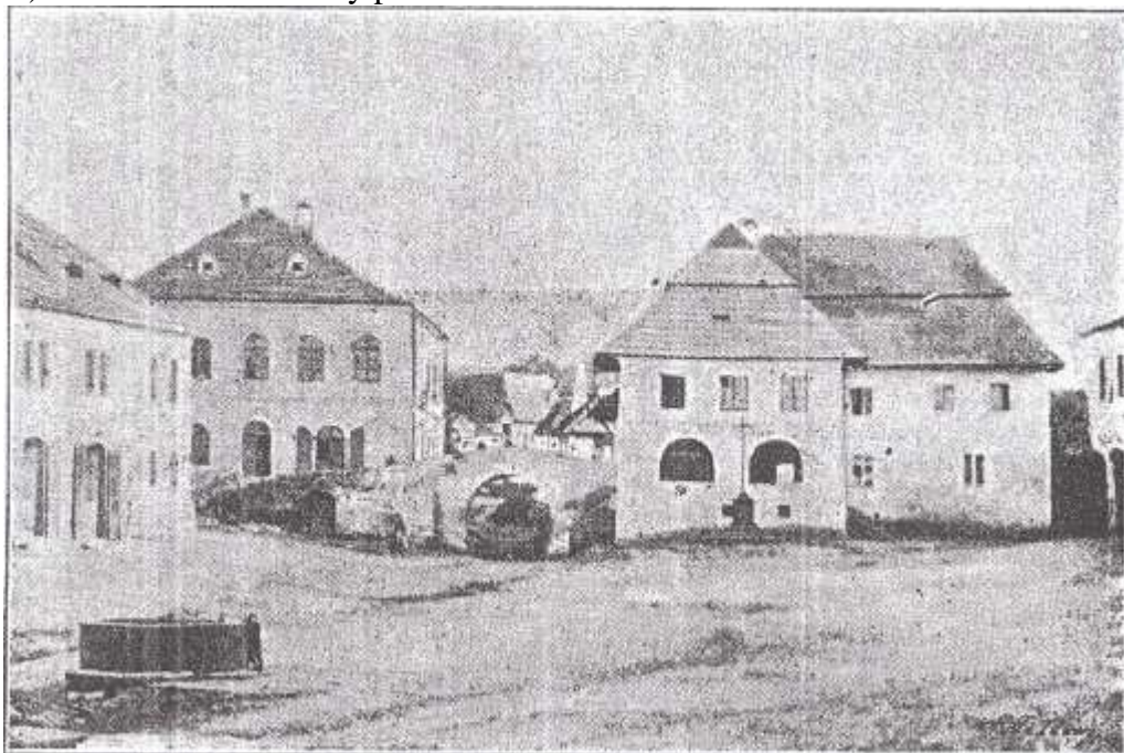
A) Původní budova školy před r. 1878.