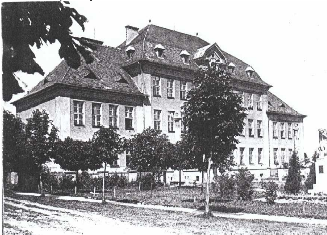
Zdroj: AMMS, fond Školství, ŠK obecné školy chlapecké, 1930 – 1936, kniha č. 45, s. 2.