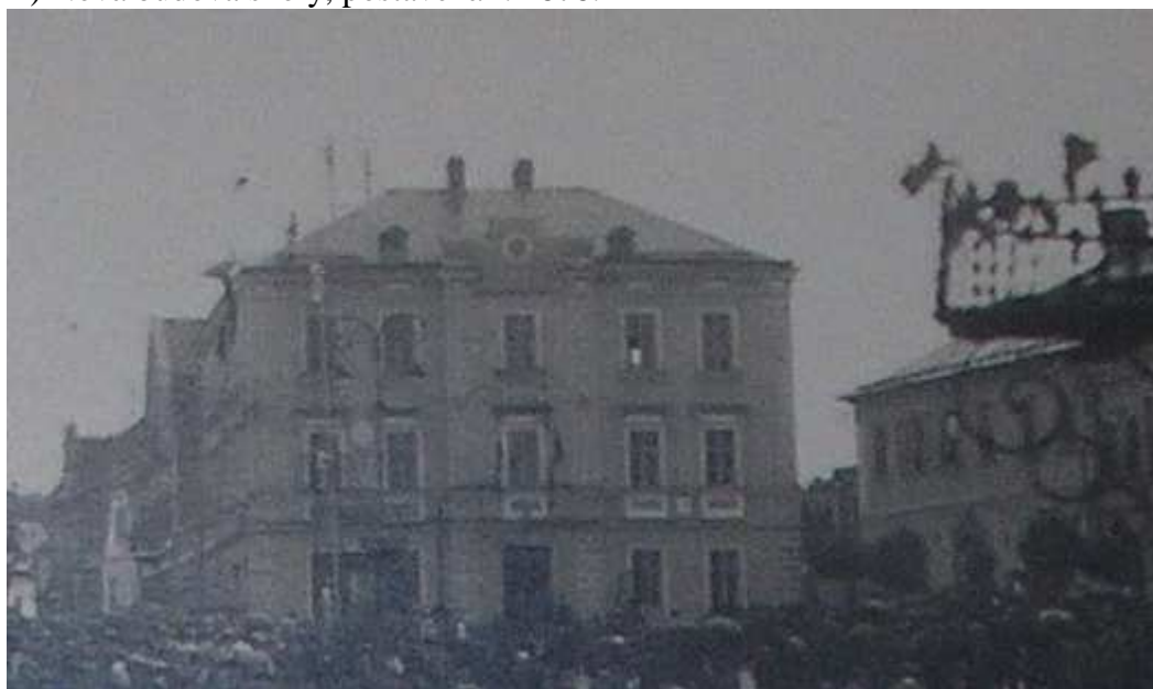
B) Nová budova školy, postavená r. 1878.

Zdroj: AMMS, fond Školství, Školní kronika obecné školy chlapecké, 1930-1936, kniha č. 45. s. 17.