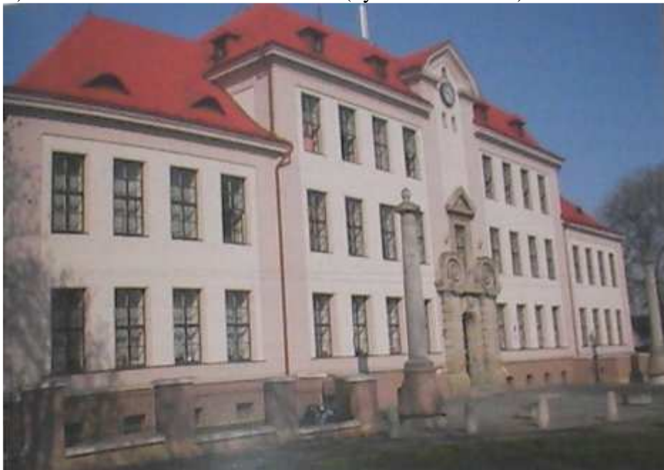
Zdroj: NOVOTNÝ, Pavel: Skuteč: známá - neznámá . Skuteč 2006. s. 35.