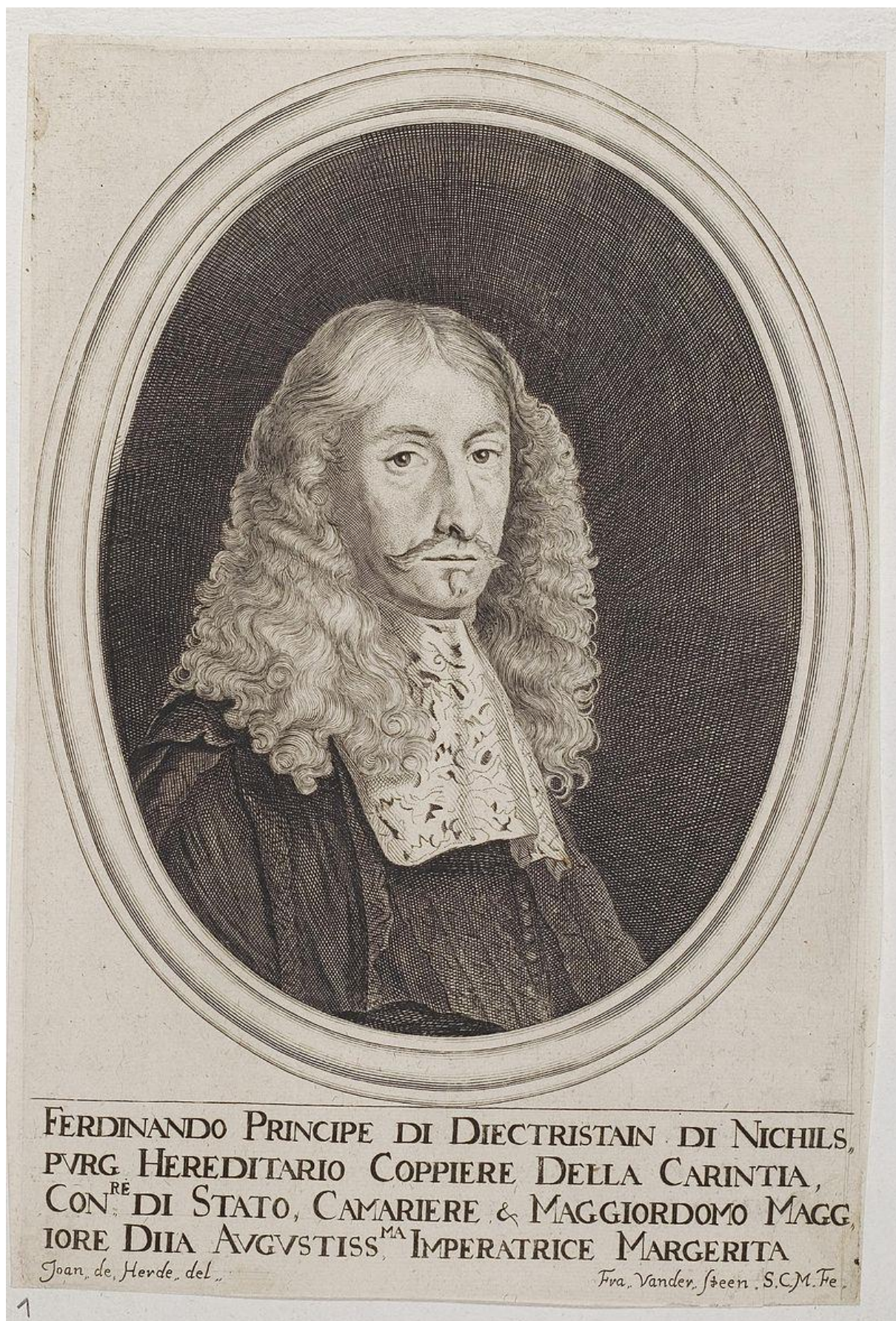
Obr. 1 Vyobrazení Ferdinanda z Ditrichštejna

FERDINANDO PRINCIPE DI DIETRISTAIN DI NICHILS, PVRG HEREDITARIO COPPIERE DELLA CARINTIA, CON RE DI STATO, CAMARIERE & MAGGIORDOMO MAGG IORE DIIA AVGVSTISS MA IMPERATRICE MARGERITA