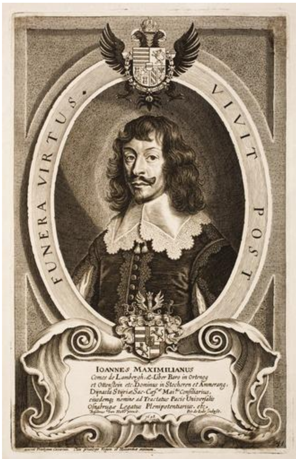
Obr. 2 Vyobrazení Jana Maxmiliána z Lamberku