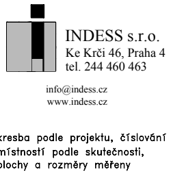
1.patro - 2np

AKCE: PASPORT OBJEKTU TF hlavní budova areál ČZU, PRAHA 6 OBJEDNATEL: Česká zemědělská univerzita Kamýcká 129 PSC 160 00, PRAHA 6 ZAKÁZKA ČÍSLO: 14016