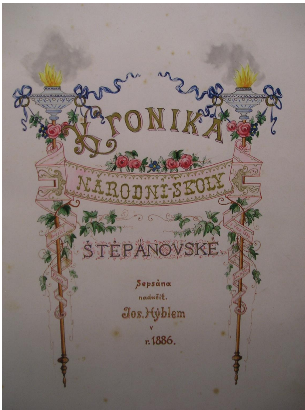
SOKA Olomouc, Kronika národní školy ve Štěpánově, 1886–1953.