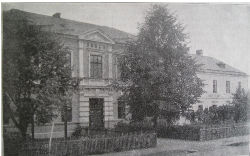
ZLÁMAL, J.: Štěpánov: kulturně-historické paměti a letopisy hlavně z doby předválečné. Štěpánov: Národní jednota, 1928.