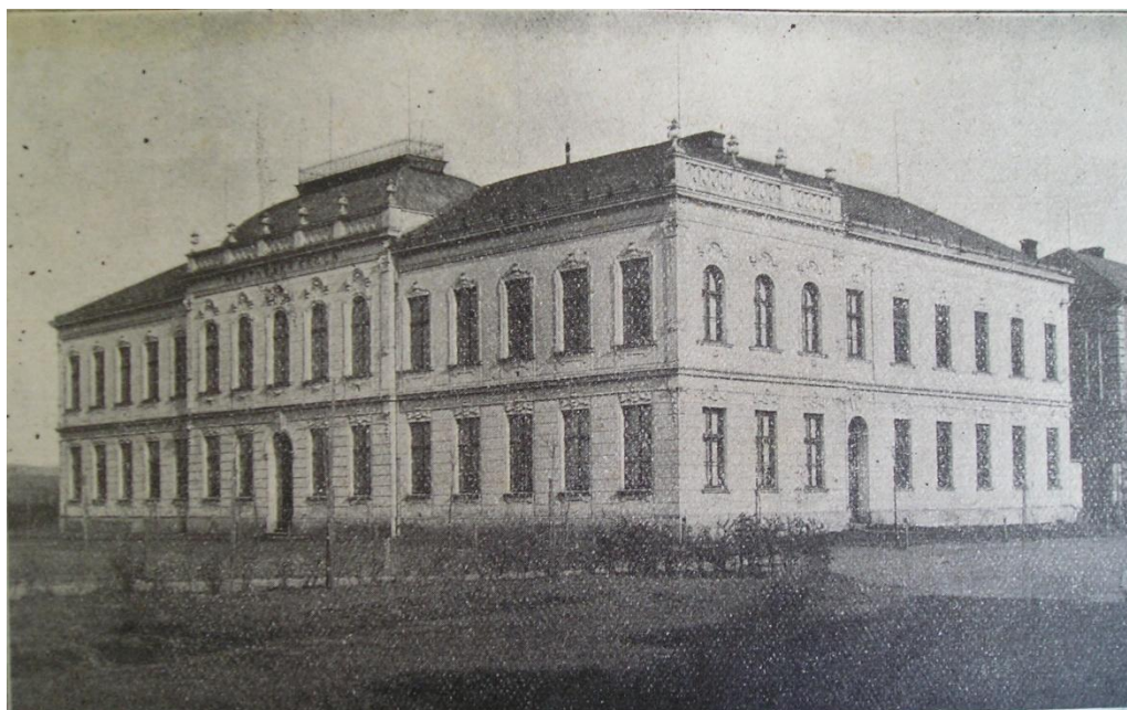
ZLÁMAL, J.: Štěpánov: kulturně-historické paměti a letopisy hlavně z doby předválečné. Štěpánov: Národní jednota, 1928.