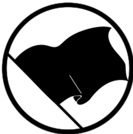
Obrázek č. 5 – černá vlajka v kruhu