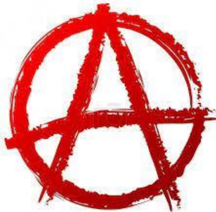
Obrázek č. 4 – písmeno A v kruhu