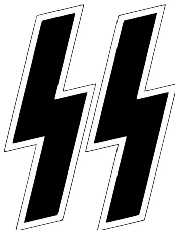
Obrázek č. 2 – runa vítězství