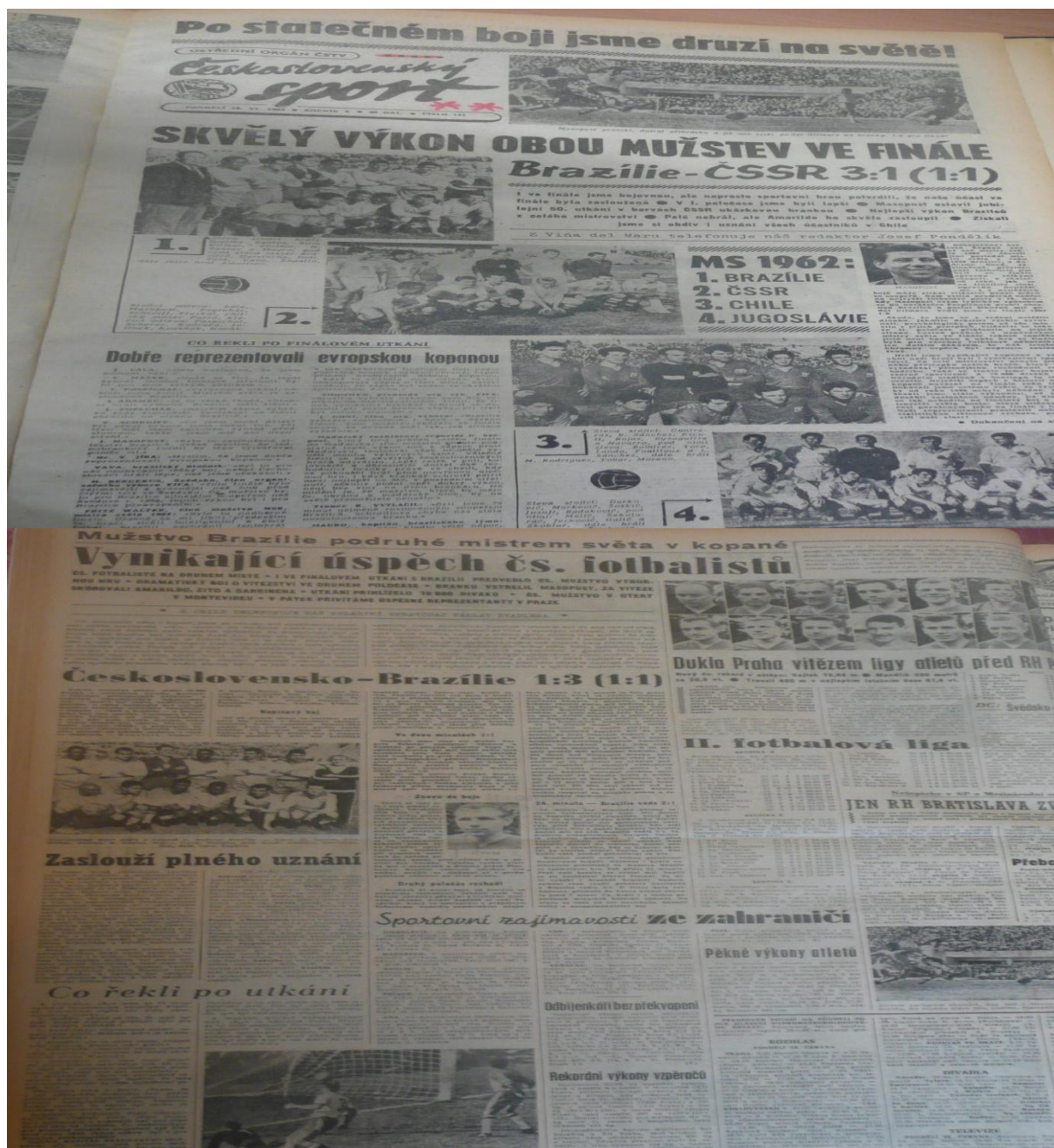
Zdroj: Československý sport. 18. června, 1962, str. 1 Rudé Právo. 18. června, 1962, str. 6