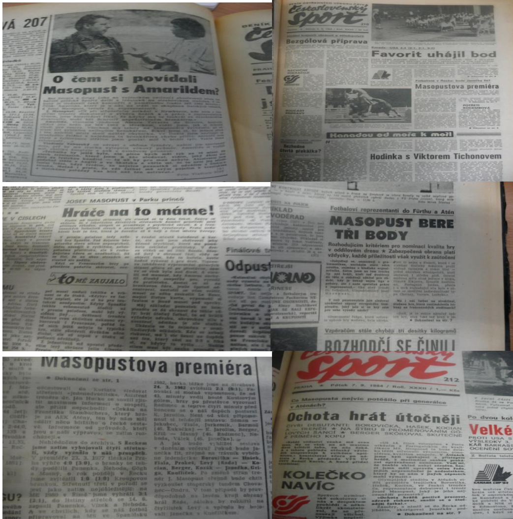
Zdroj: Československý sport. 14. května, 1984, str. 3 Československý sport. 7. září, 1984, str. 1 Československý sport. 9. září, 1984, str. 1 Československý sport. 2. srpna, 1984, str. 1 Československý sport. 2. července, 1984, str. 3