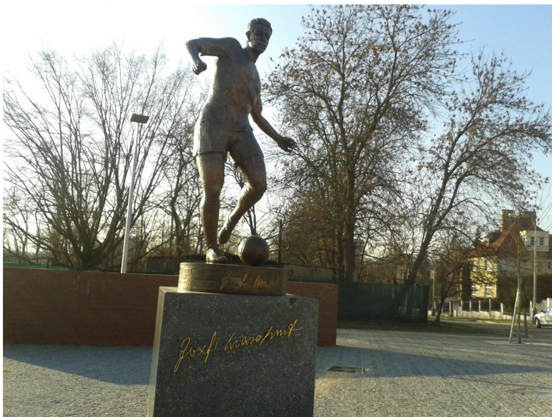
Obrázek 1: Socha Josefa Masopusta v parku Juliska

Nejpopulárnějšímu světovému fenoménu - fotbalu zasvětil celý život. V určité době ho díky svým kvalitám pomohl posouvat na lepší úroveň a popularizovat ho i v odlehlých koutech světa. Josef Masopust se stal rytířem světového sportu.