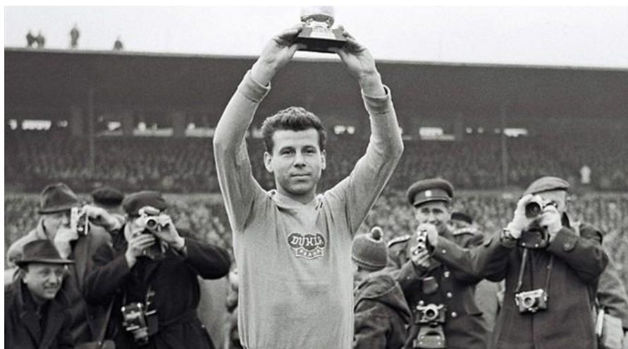
Obrázek 1: Předání Zlatého míče na Strahově